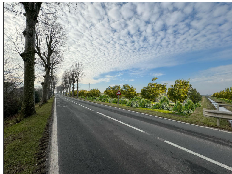
FOTO 3 STATO ATTUALE