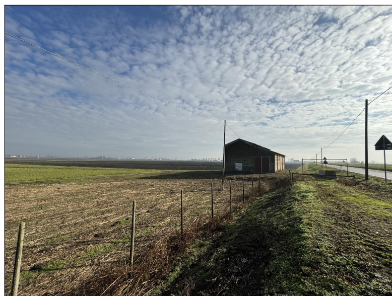
FOTO INSERIMENTO 1 STATO FUTURO