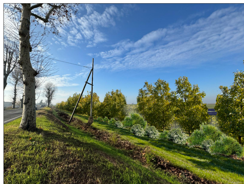
FOTO 4 STATO ATTUALE