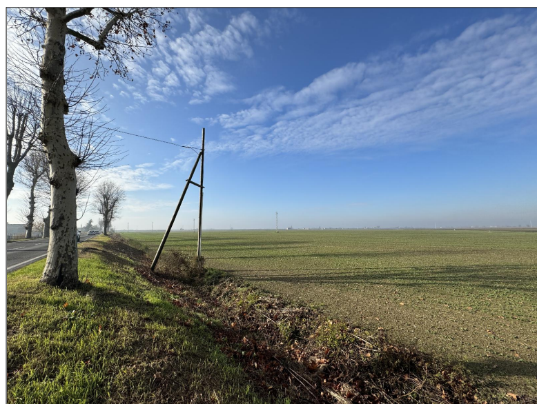
FOTO INSERIMENTO 3 STATO FUTURO