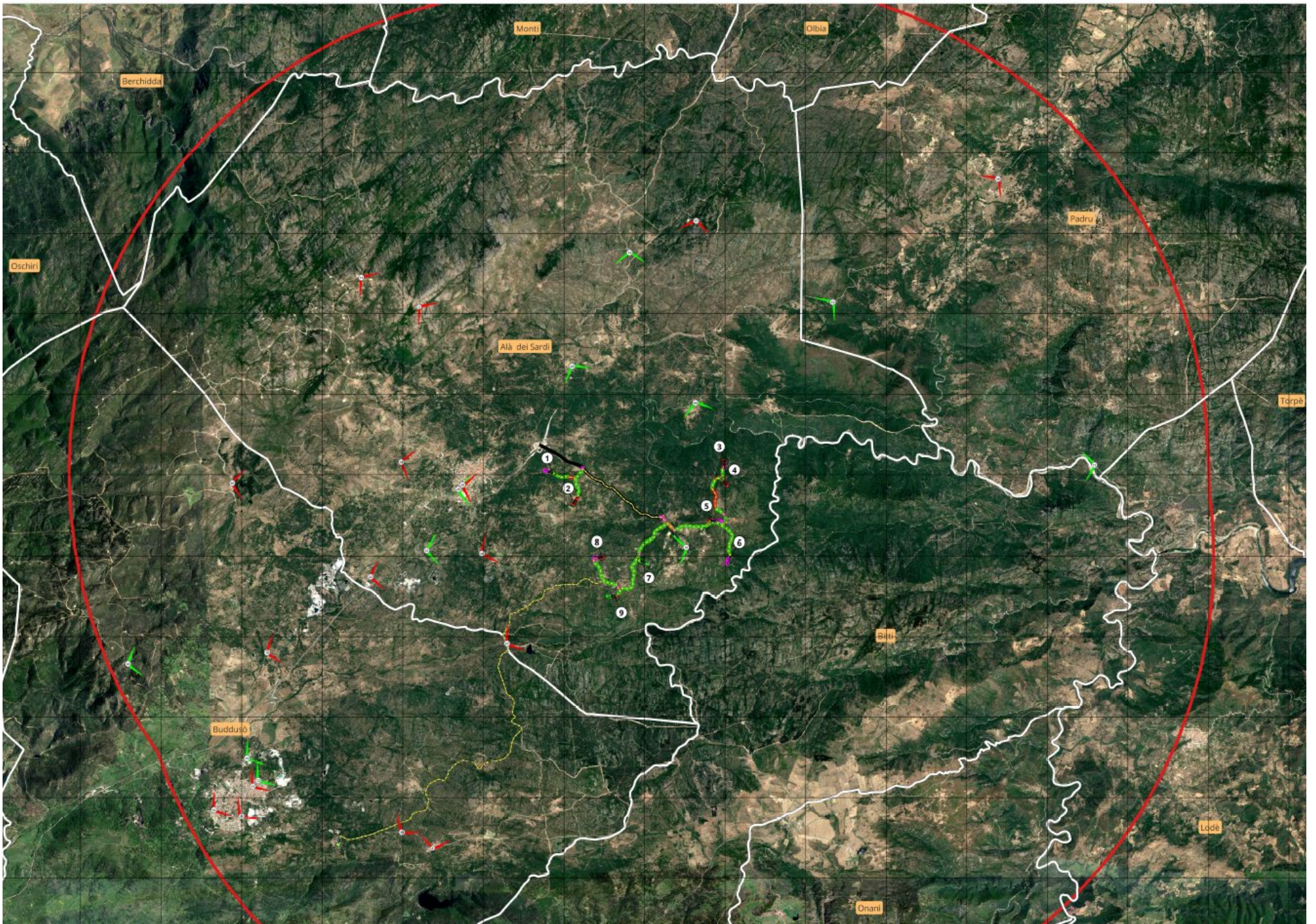
Figura 1 - Stralcio della tav. 2.18 "mappa dei punti di ripresa fotografica su base ortofoto"