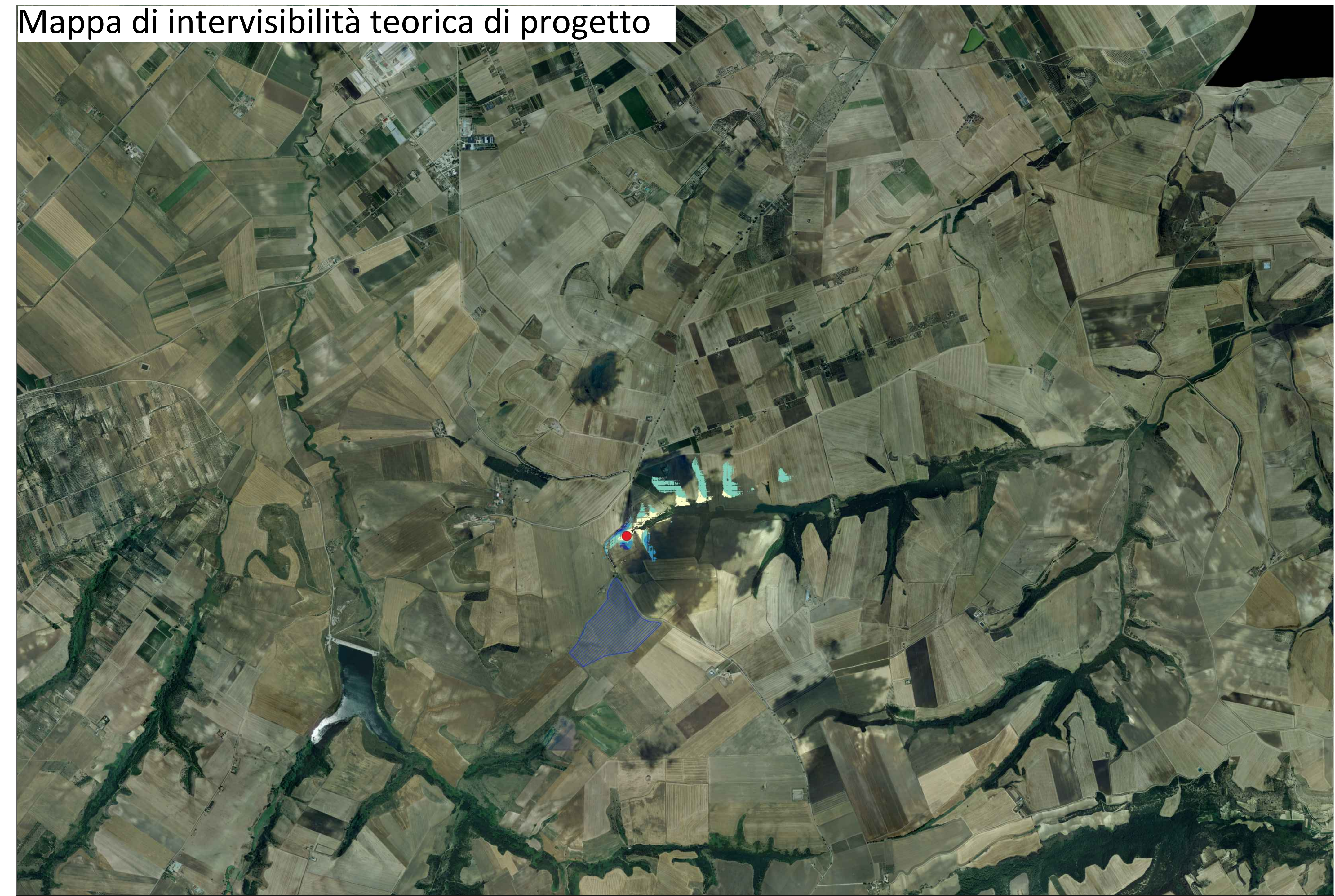
Mappa di intervisibilità teorica di progetto