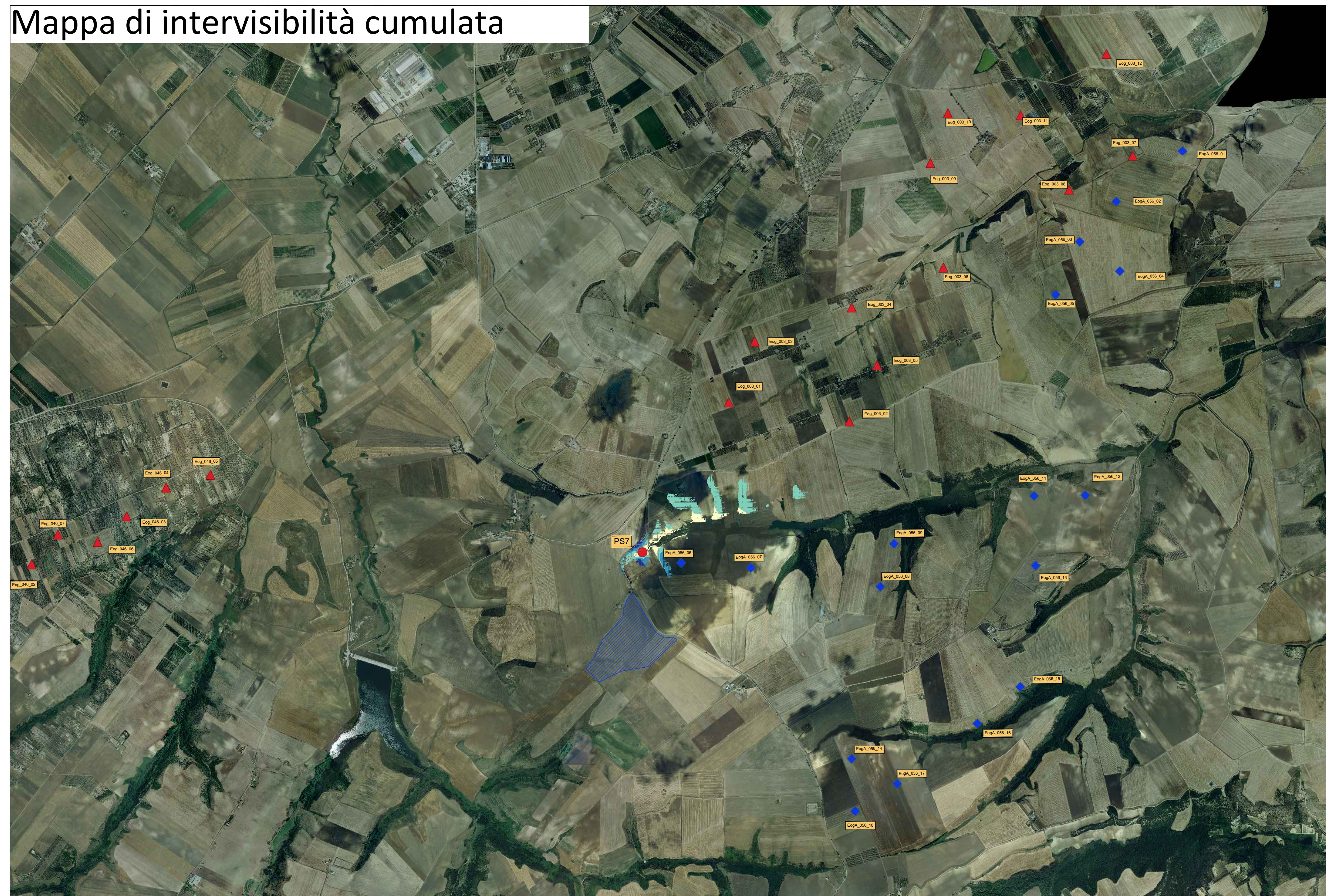
Mappa di intervisibilità cumulata