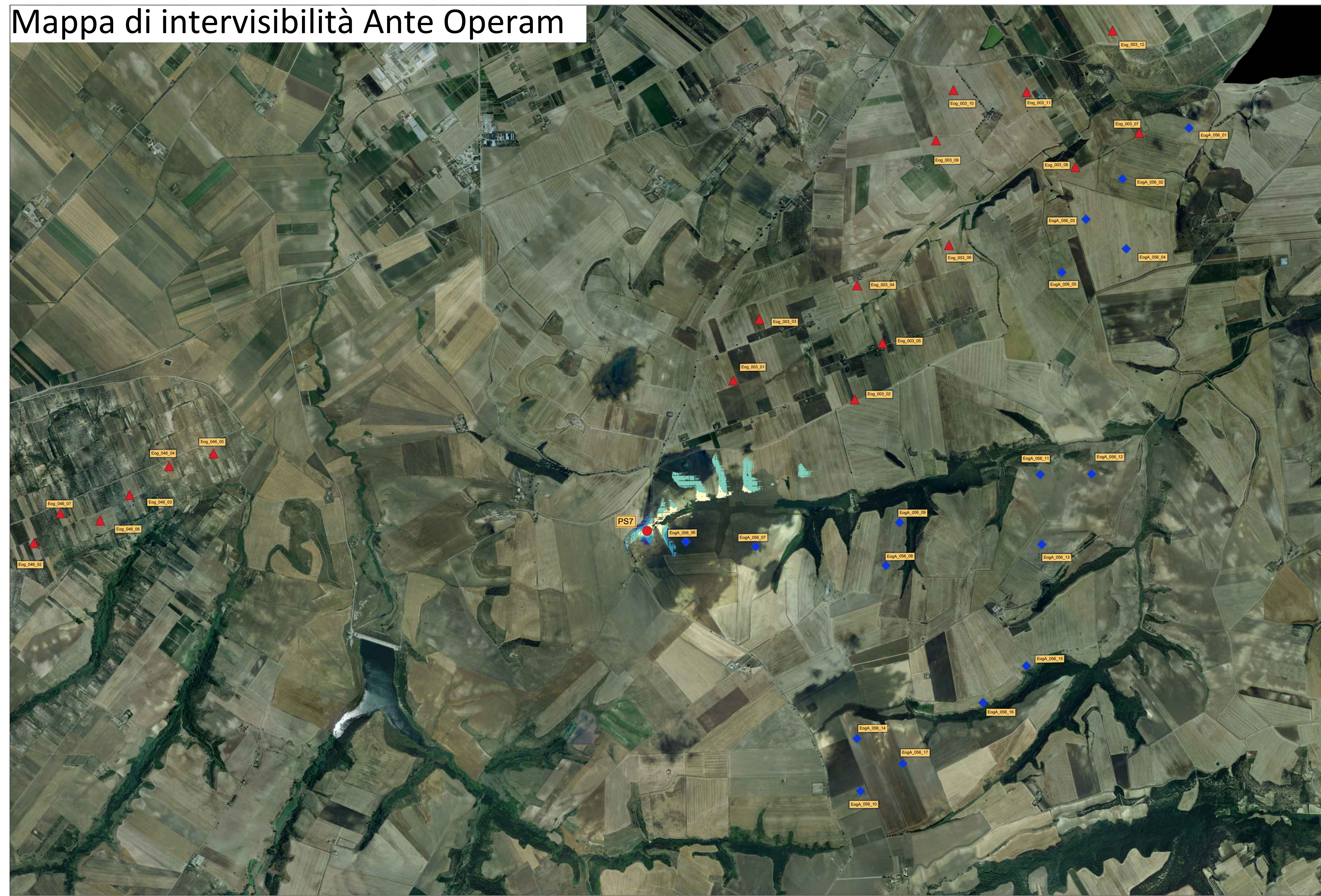
Mappa di intervisibilità Ante Operam