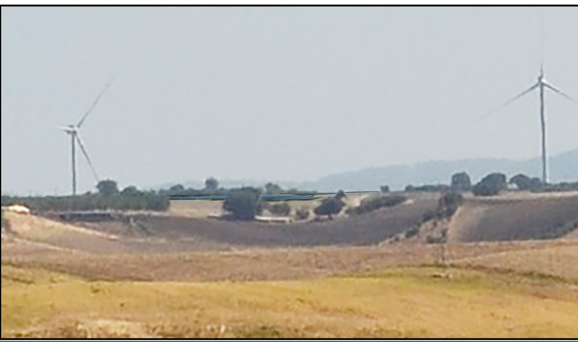
Stralcio dell'area di intervento: Nuovo Impianto Agrivoltaico di Progetto senza mitigazione con recinzione perimetrale zincata e verniciata RAL 6018 - Light Green.