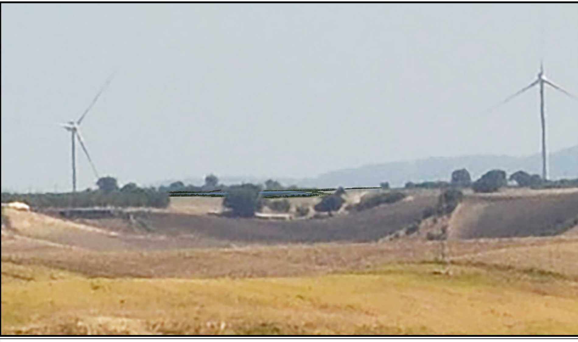
Stralcio dell'area di intervento: Nuovo Impianto Agrivoltaico di Progetto con recinzione perimetrale zincata e verniciata RAL 6018 - Light Green, integrata da fascia di mitigazione realizzata con un filare alberato di piante di Olivo lungo tutto il perimetro dell'impianto al fine di integrarsi con il paesaggio.