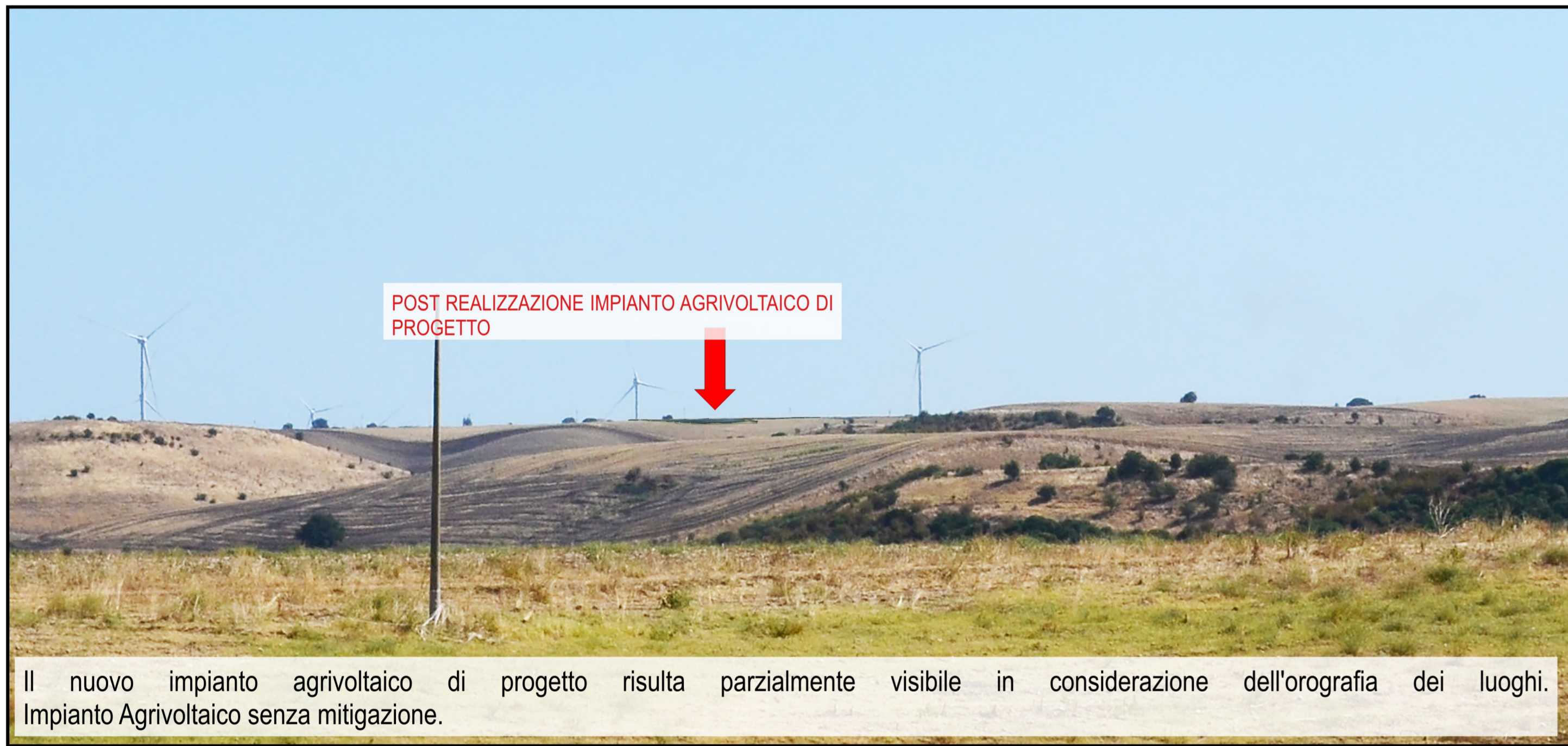
Il nuovo impianto agrivoltaico di progetto risulta parzialmente visibile in considerazione dell'orografia dei luoghi. Impianto Agrivoltaico senza mitigazione.