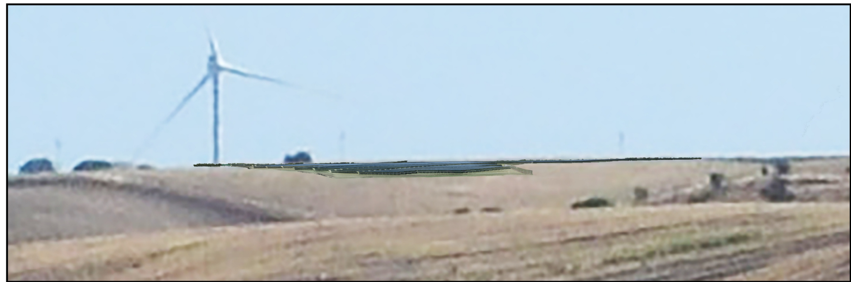
Stralcio dell'area di intervento: Nuovo Impianto Agrivoltaico di Progetto senza mitigazione con recinzione perimetrale zincata e verniciata RAL 6018 - Light Green.