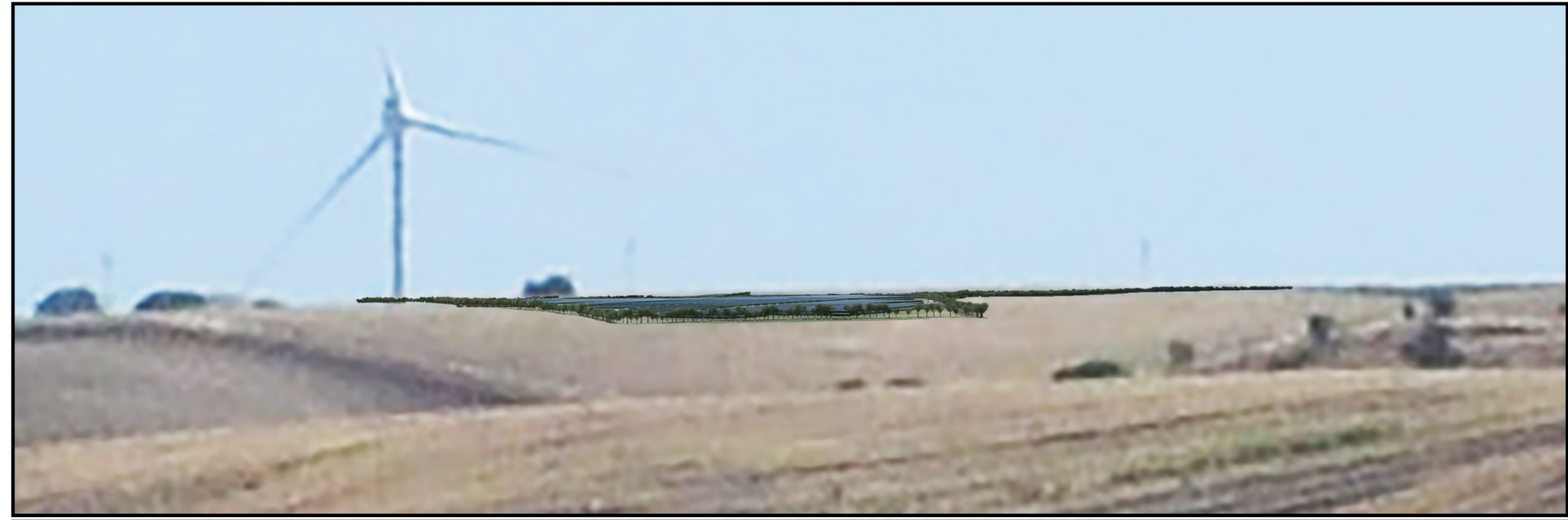
Stralcio dell'area di intervento: Nuovo Impianto Agrivoltaico di Progetto con recinzione perimetrale zincata e verniciata RAL 6018 - Light Green, integrata da fascia di mitigazione realizzata con un filare alberato di piante di Olivo lungo tutto il perimetro dell'impianto al fine di integrarsi con il paesaggio.