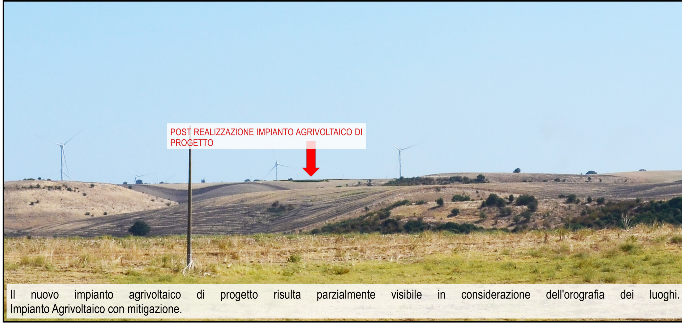
Il nuovo impianto agrivoltaico di progetto risulta parzialmente visibile in considerazione dell'orografia dei luoghi. Impianto Agrivoltaico con mitigazione.