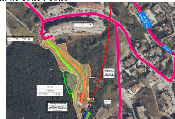
Figura 6 Stralcio planimetrico CO.07 e CO.08