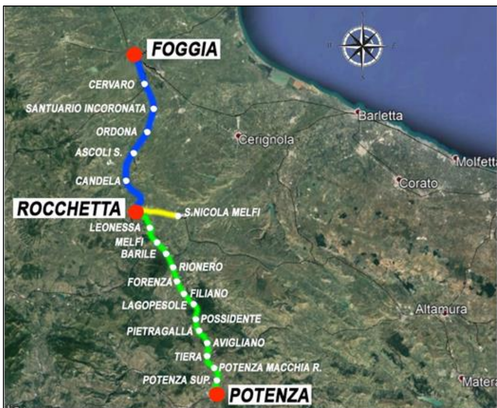
Figura 1 Tratte Lotto 1.1 Cervaro-Rocchetta-San Nicola di Melfi e tratta Lotto 1.2 Rocchetta-Potenza

In particolare, nella tratta Foggia Potenza – Lotto 1.2, sono presenti, le seguenti 4 gallerie di lunghezza maggiore di 1 km. Proseguendo da Foggia verso Potenza esse sono: