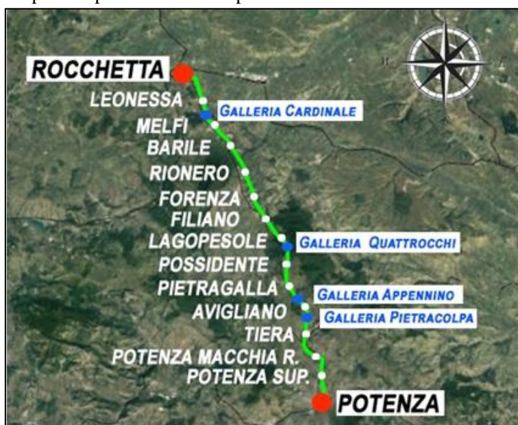
Figura 2 Lotto 1.2 - Localizzazione gallerie di estensione superiore a 1.000 m

Oggetto del presente progetto è la realizzazione del sistema di messa a terra della linea di contatto a ciascuno dei due imbocchi delle suddette gallerie con la predisposizione di un fabbricato o shelter ubicato in un piazzale