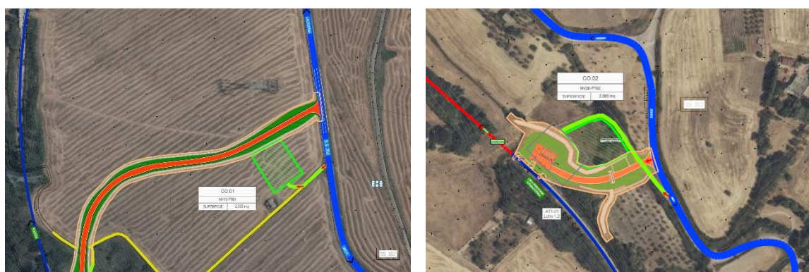
Figura 3 Stralci planimetrico CO.01 e CO.02

Si precisa che, in sede di progettazione definitiva, il Coordinatore per la Sicurezza in fase di Progettazione (CSP), definirà un'ideale organizzazione per ogni singola area di cantiere individuata (vedi Tabella 2), sulla base dei criteri definiti dal progetto di cantierizzazione, con riferimento alle modalità da seguire per la recinzione del cantiere, gli accessi e le segnalazioni, i servizi igienico-assistenziali, la viabilità principale di cantiere, gli impianti di terra e di protezione contro le scariche atmosferiche, le eventuali modalità di accesso dei mezzi di fornitura dei materiali, la dislocazione degli impianti di cantiere, la dislocazione delle zone di carico e scarico, le zone di deposito attrezzature e di stoccaggio materiali e dei rifiuti e le eventuali zone di deposito dei materiali con pericolo d'incendio o di esplosione (Allegato XV del D. Lgs. 81/2008 e s.m.i.). La sistemazione dei cantieri sarà pertanto oggetto di un esame critico da parte del CSP, che ne verificherà l'idoneità, per gli aspetti specifici della sicurezza legati alla difficoltà di sistemazione sul territorio, all'organizzazione logistica, alla funzionalità dell'esercizio ferroviario ed alla disponibilità di aree ed impianti.