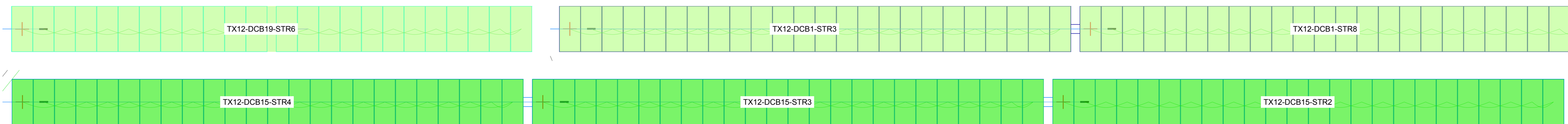
Particolare collegamento stringa - stringbox AREA PS12 (Esempio: Campo 12 - String box n°15 - Stringa n°4) Scala 1:100