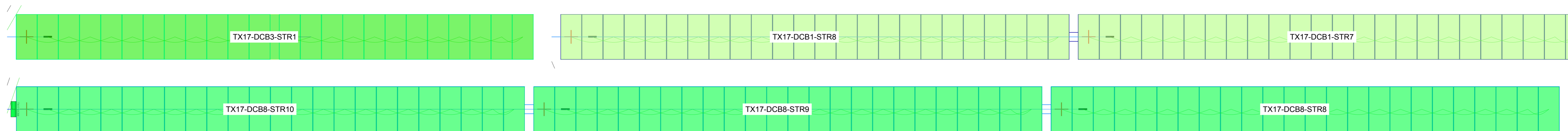
Particolare collegamento stringa - stringbox AREA PS17 (Esempio: Campo 17 - String box n°8 - Stringa n°10) Scala 1:100