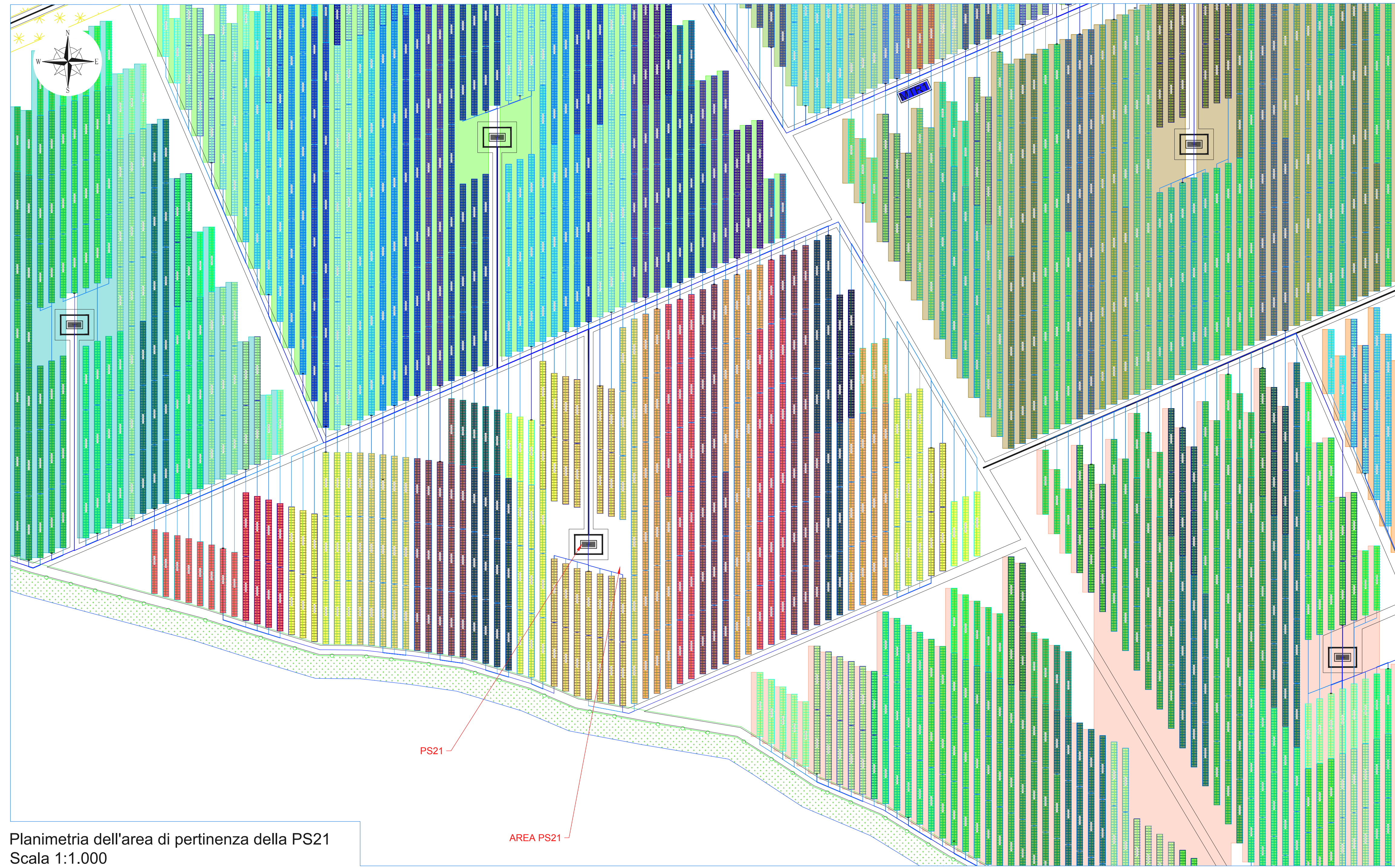
Planimetria dell'area di pertinenza della PS21 Scala 1:1.000