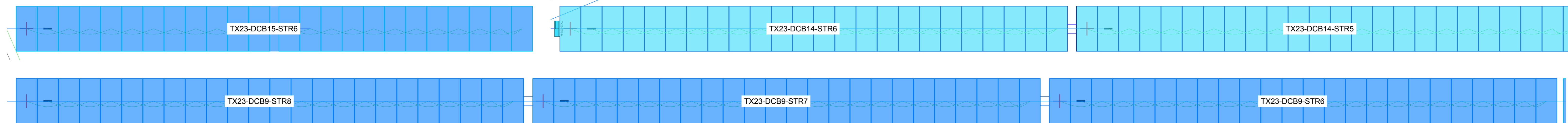
Particolare collegamento stringa - stringbox AREA PS23 (Esempio: Campo 23 - String box n°9 - Stringa n°8) Scala 1:100