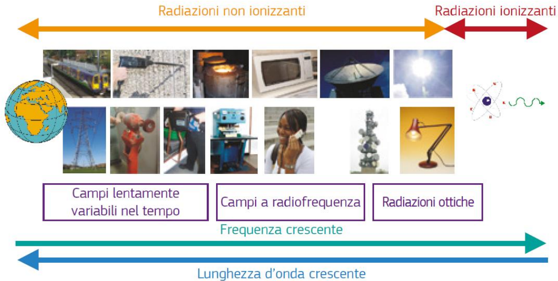
Grafico esplicativo della suddivisione delle radiazioni in non ionizzanti e ionizzanti

Si consulti in proposito l'immagine appresso indicata: