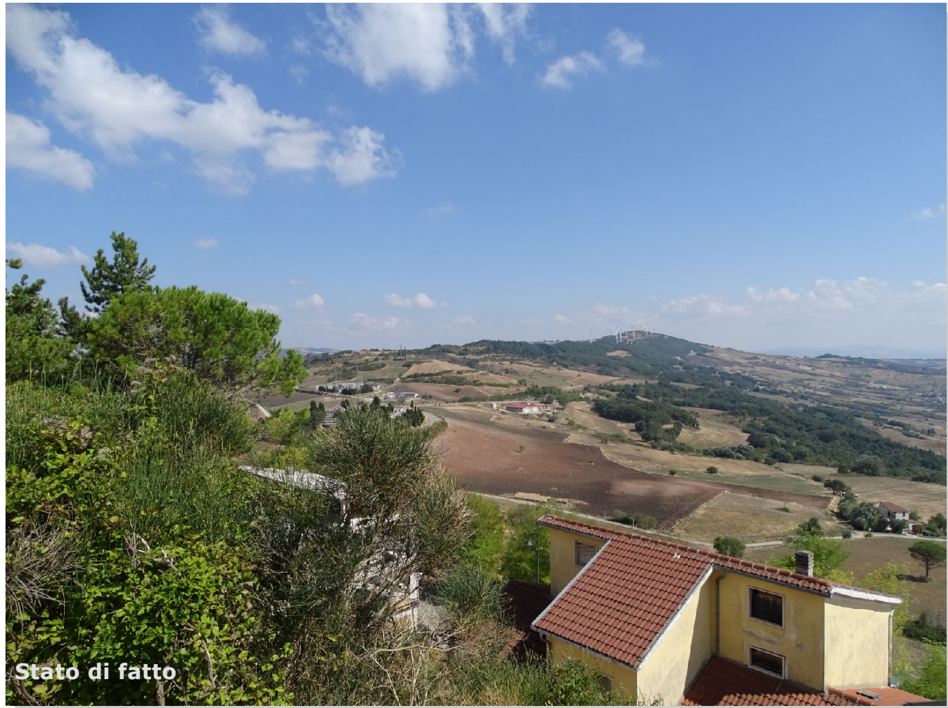
Stato di fatto