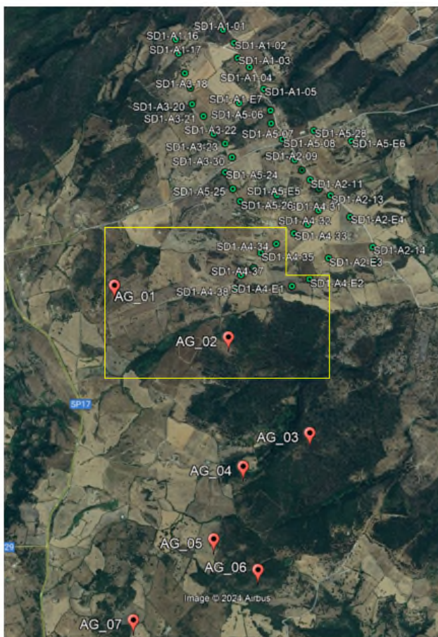
Fig.3 Interferenza vicinanza turbine