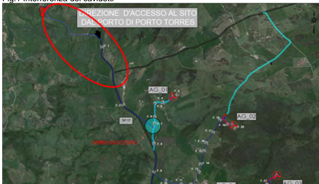
Fig.1 Interferenza dei cavidotti

Questo messaggio è destinato esclusivamente al seguente uso: CONFIDENZIALE