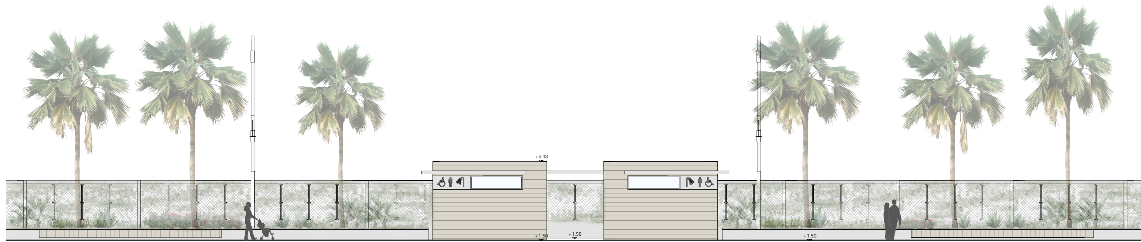
Prospetto sud scala 1:100