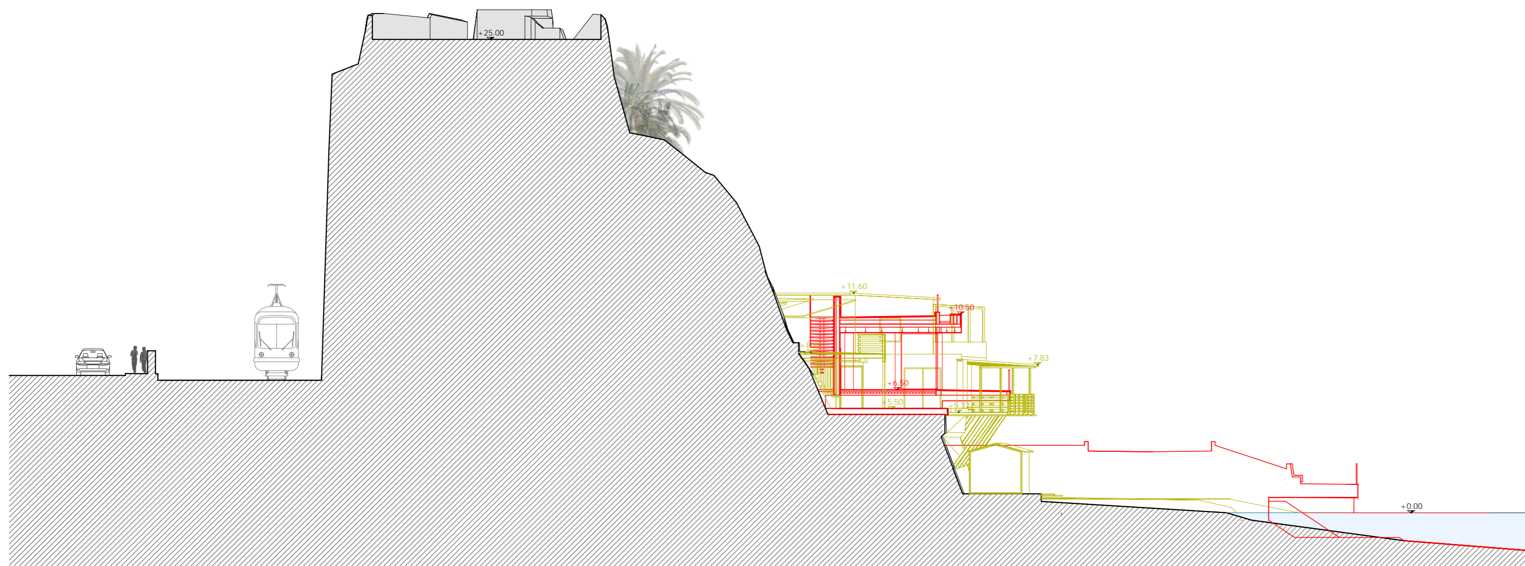
Sezione C-C' scala 1:200