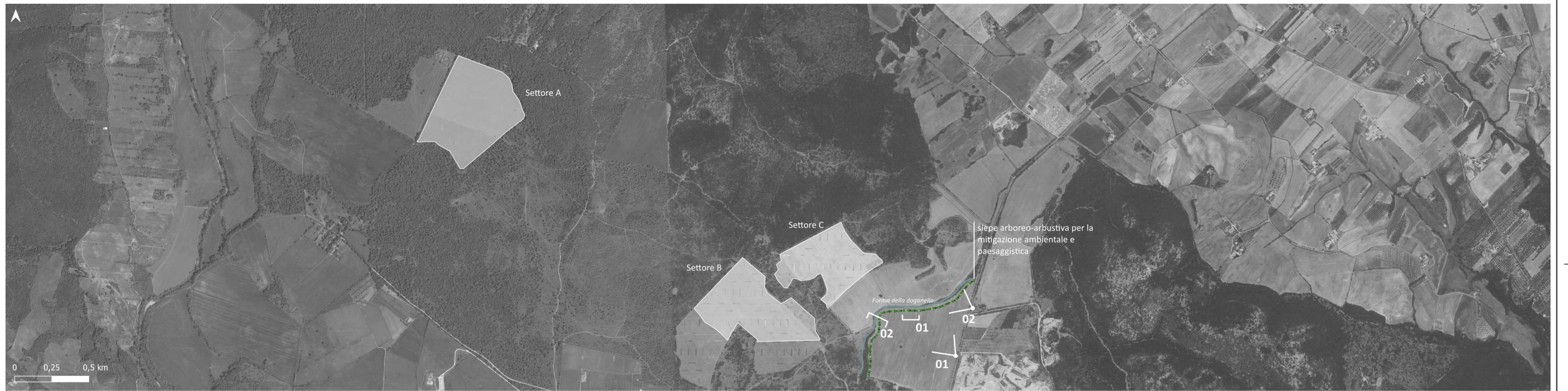
Abachi e tipologici