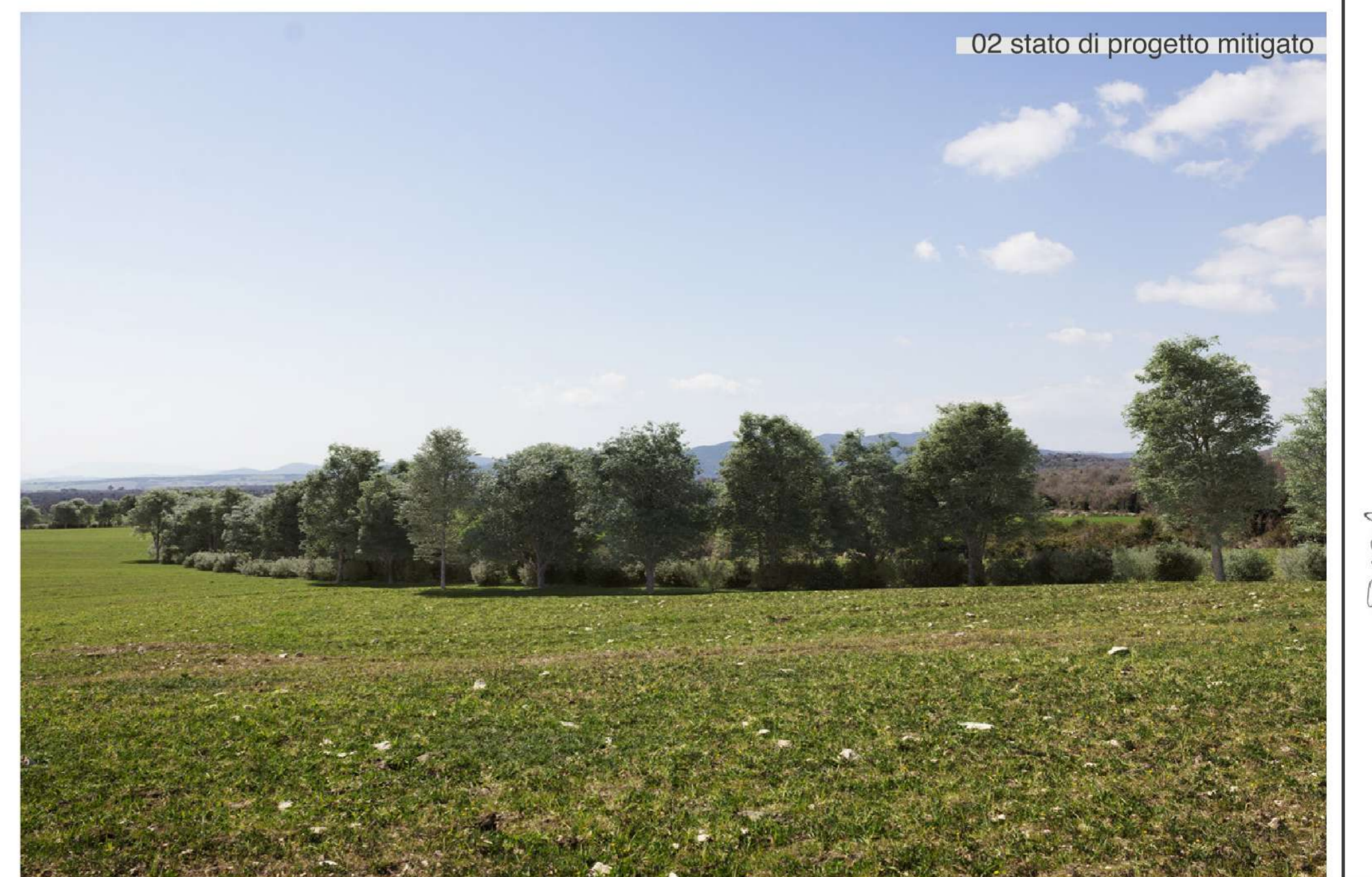
02 stato di progetto mitigato