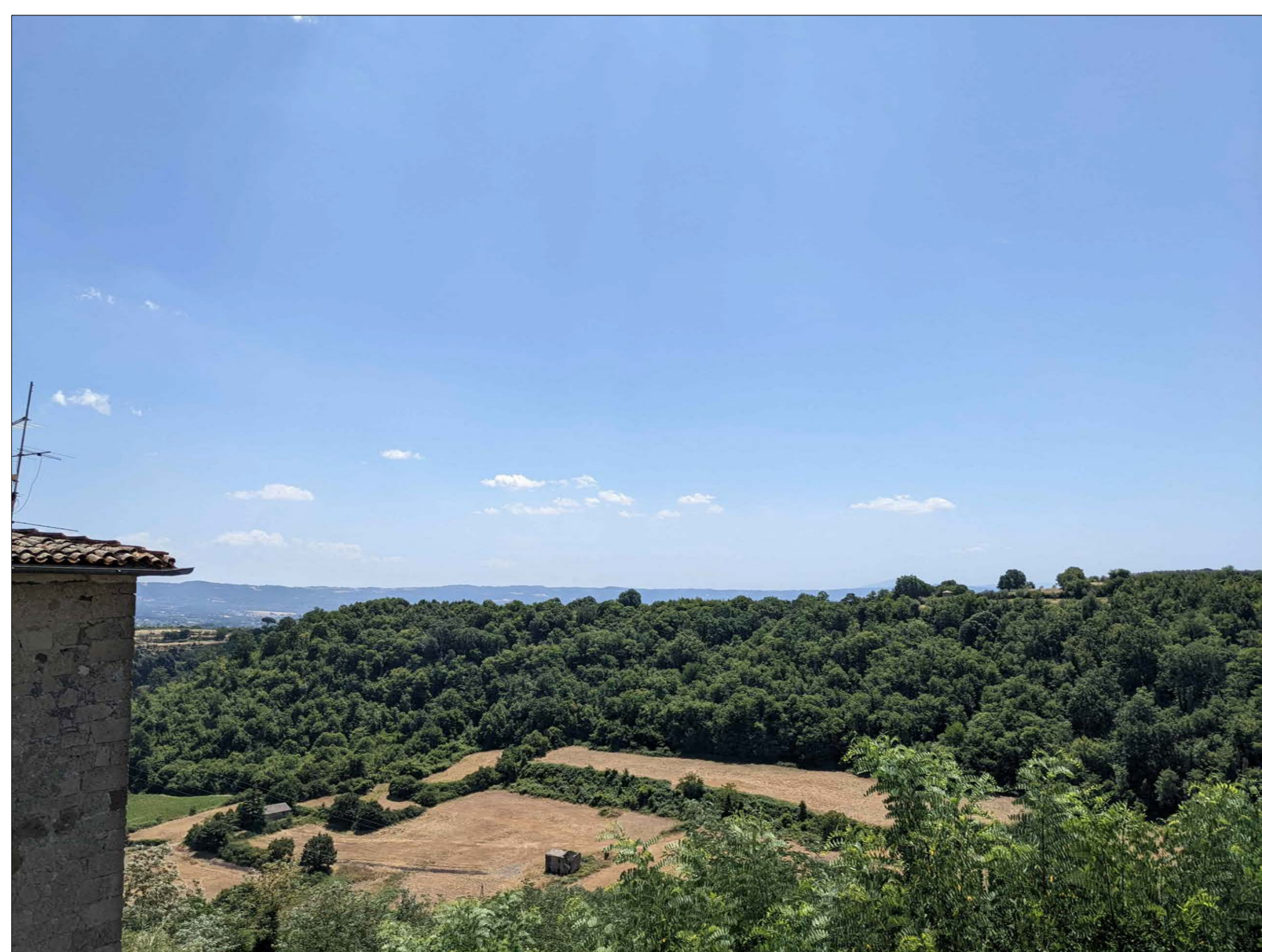
FOTINSERIMENTO 7 - STATO DI FATTO