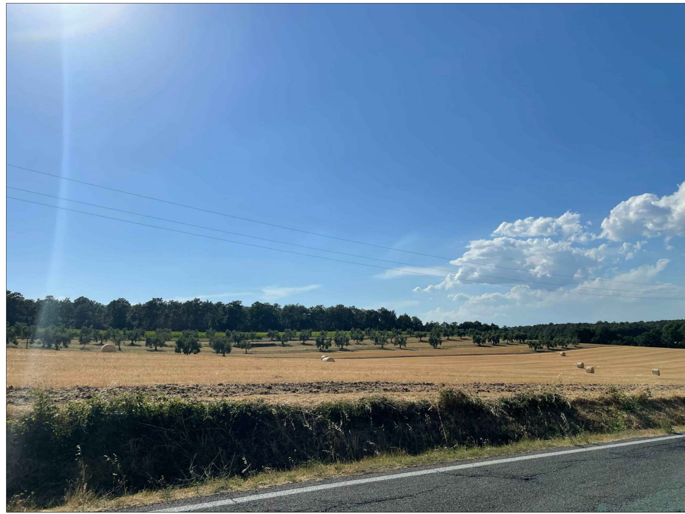
FOTINSERIMENTO 5 - STATO DI FATTO