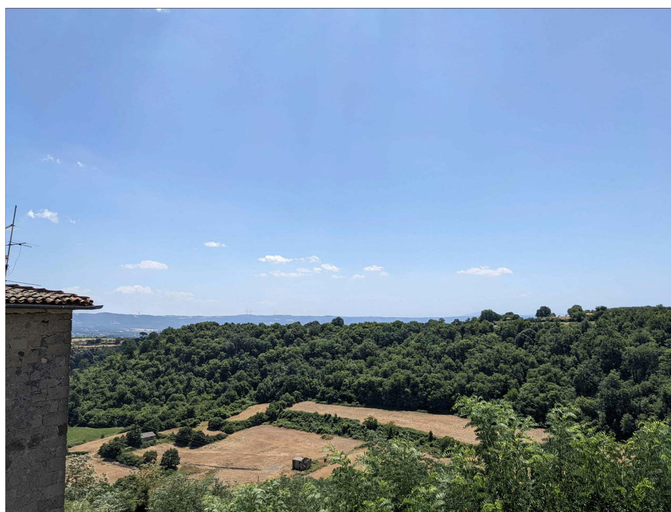
FOTINSERIMENTO 7 - STATO DI PROGETTO