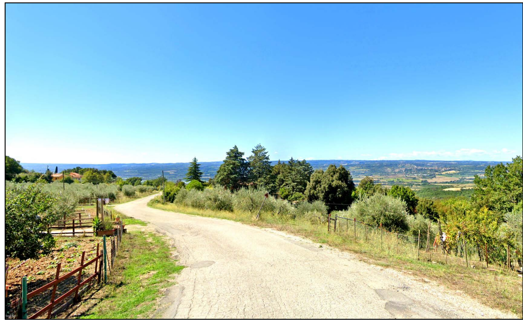
FOTOINSERIMENTO 37 - STATO DI FATTO