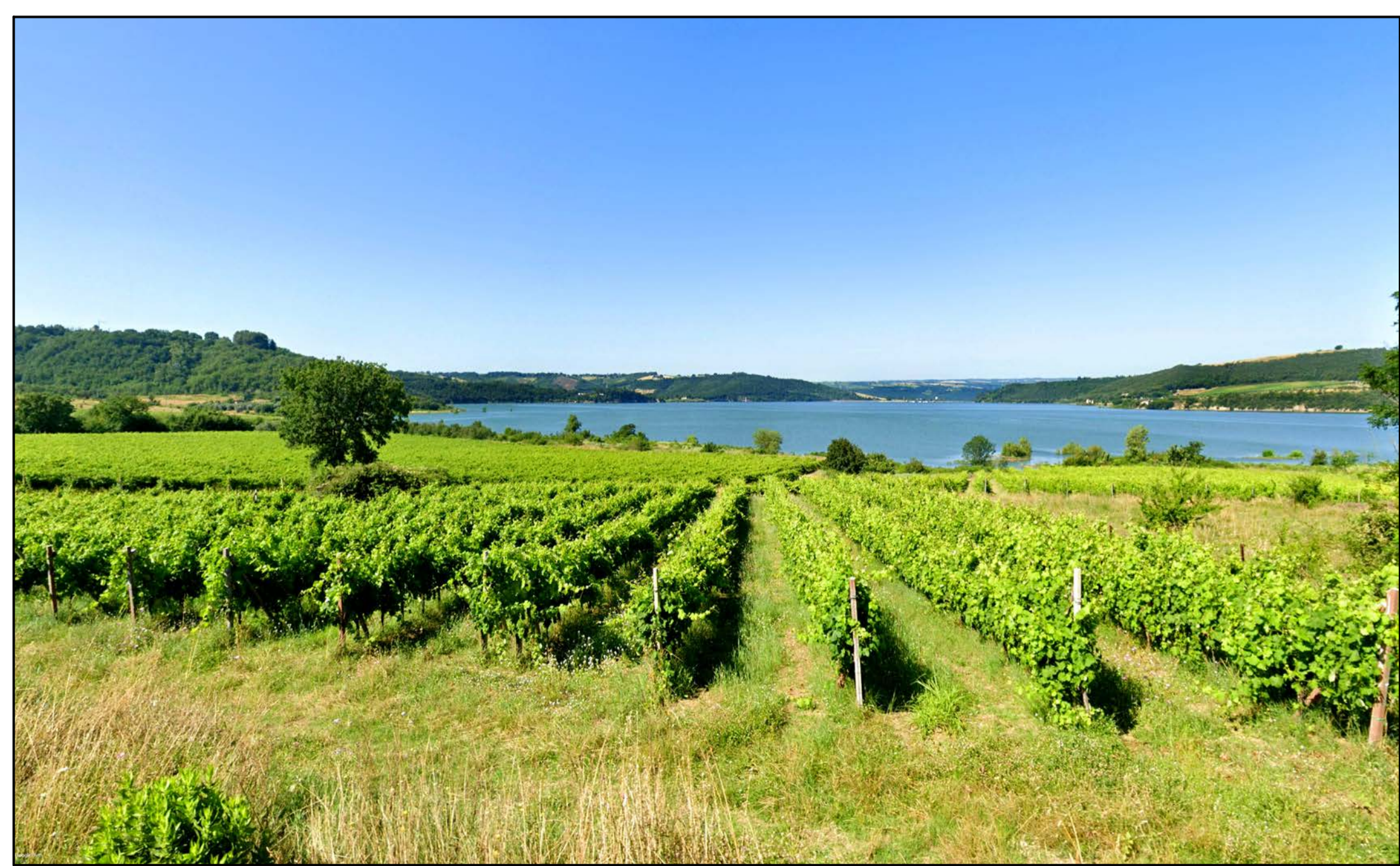
FOTOINSERIMENTO 38 - STATO DI FATTO

NOTA: il numero del Fotoinserimento fa riferimento al Recettore individuato, nel navigatore sono stati riportati solo i recettori dai quali è stato sviluppato il fotoinserimento. Per un elenco completo dei recettori selezionati si faccia riferimento allo Studio di Impatto Ambientale.