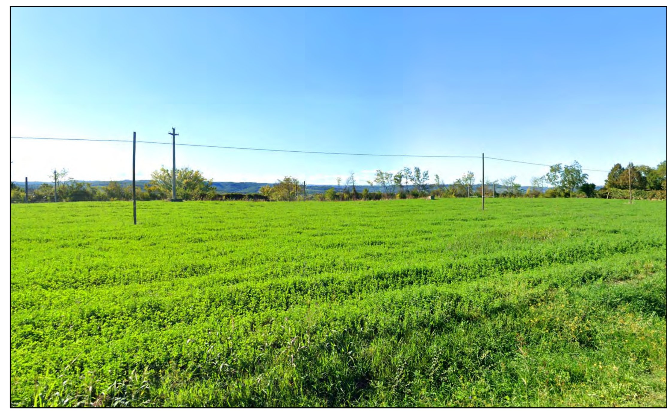
FOTOINSERIMENTO 25 - STATO DI FATTO