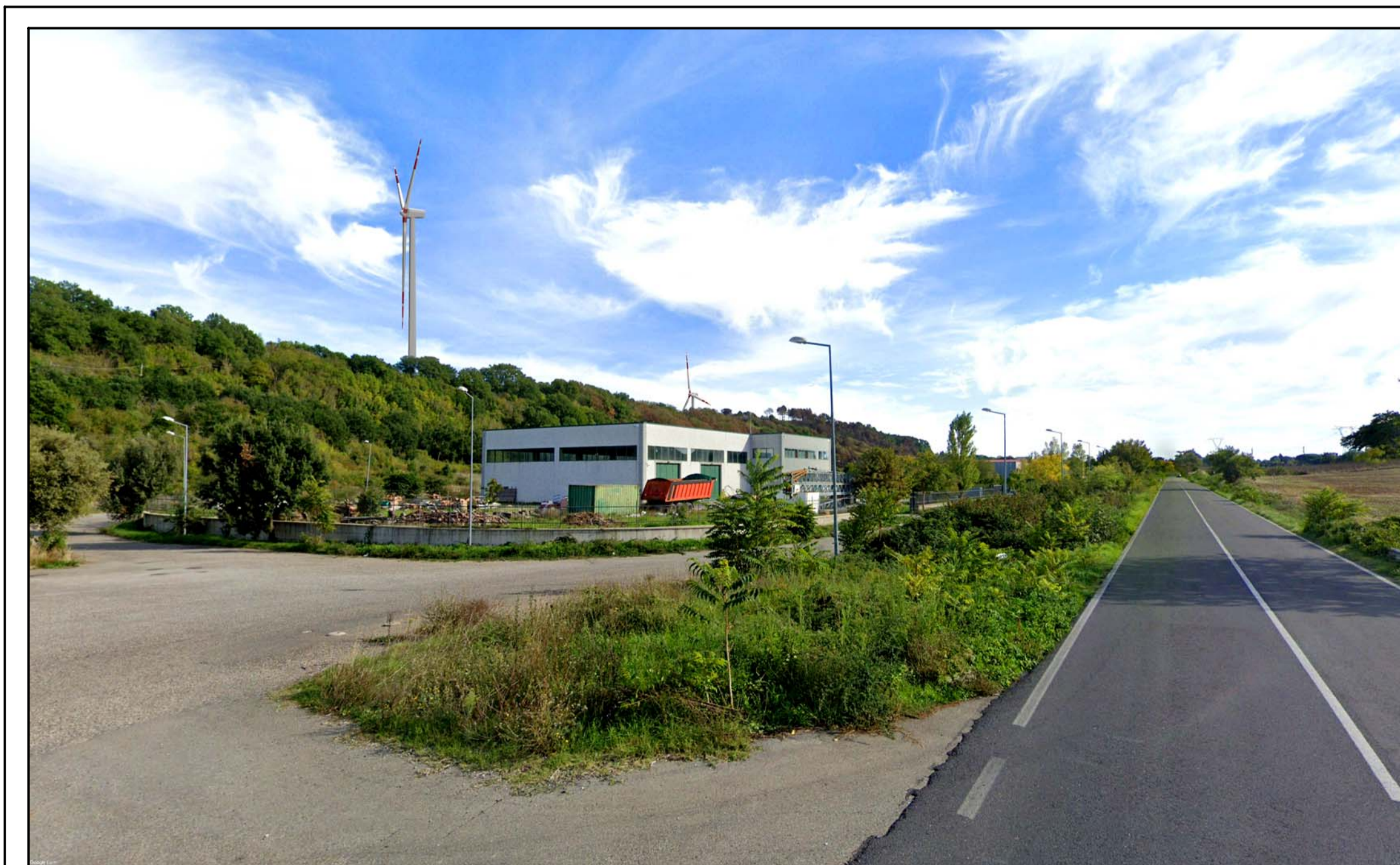
FOTOINSERIMENTO 26 - STATO DI PROGETTO