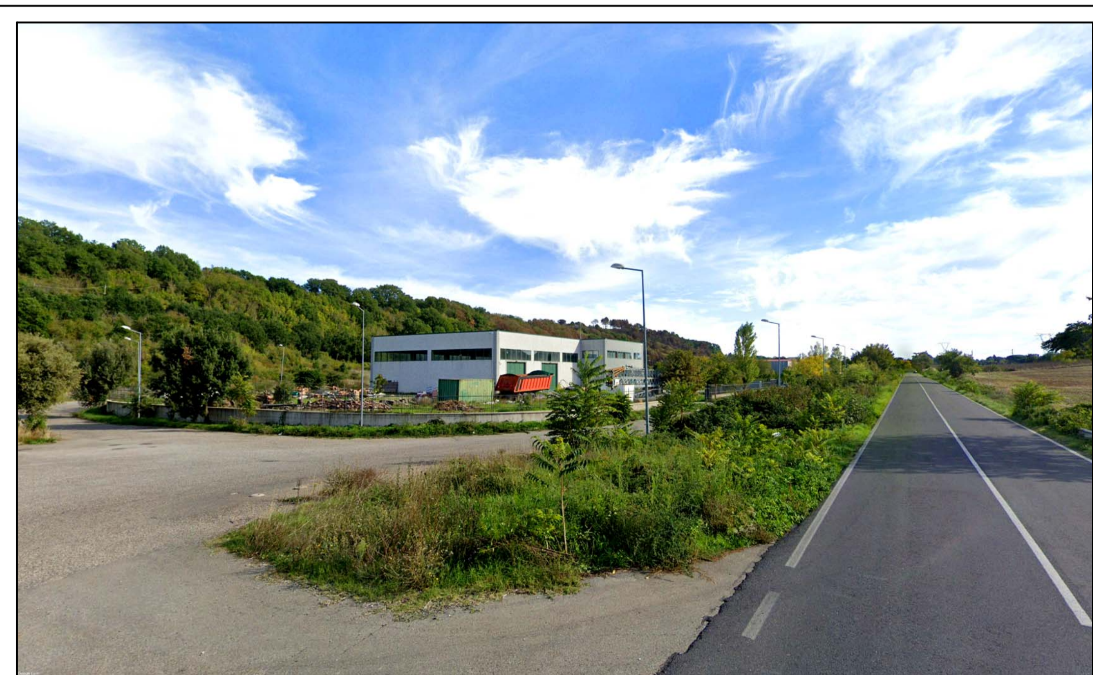
FOTOINSERIMENTO 26 - STATO DI FATTO

NOTA: il numero del Fotoinserimento fa riferimento al Recettore individuato, nel navigatore sono stati riportati solo i recettori dai quali è stato sviluppato il fotoinserimento. Per un elenco completo dei recettori selezionati si faccia riferimento allo Studio di Impatto Ambientale.