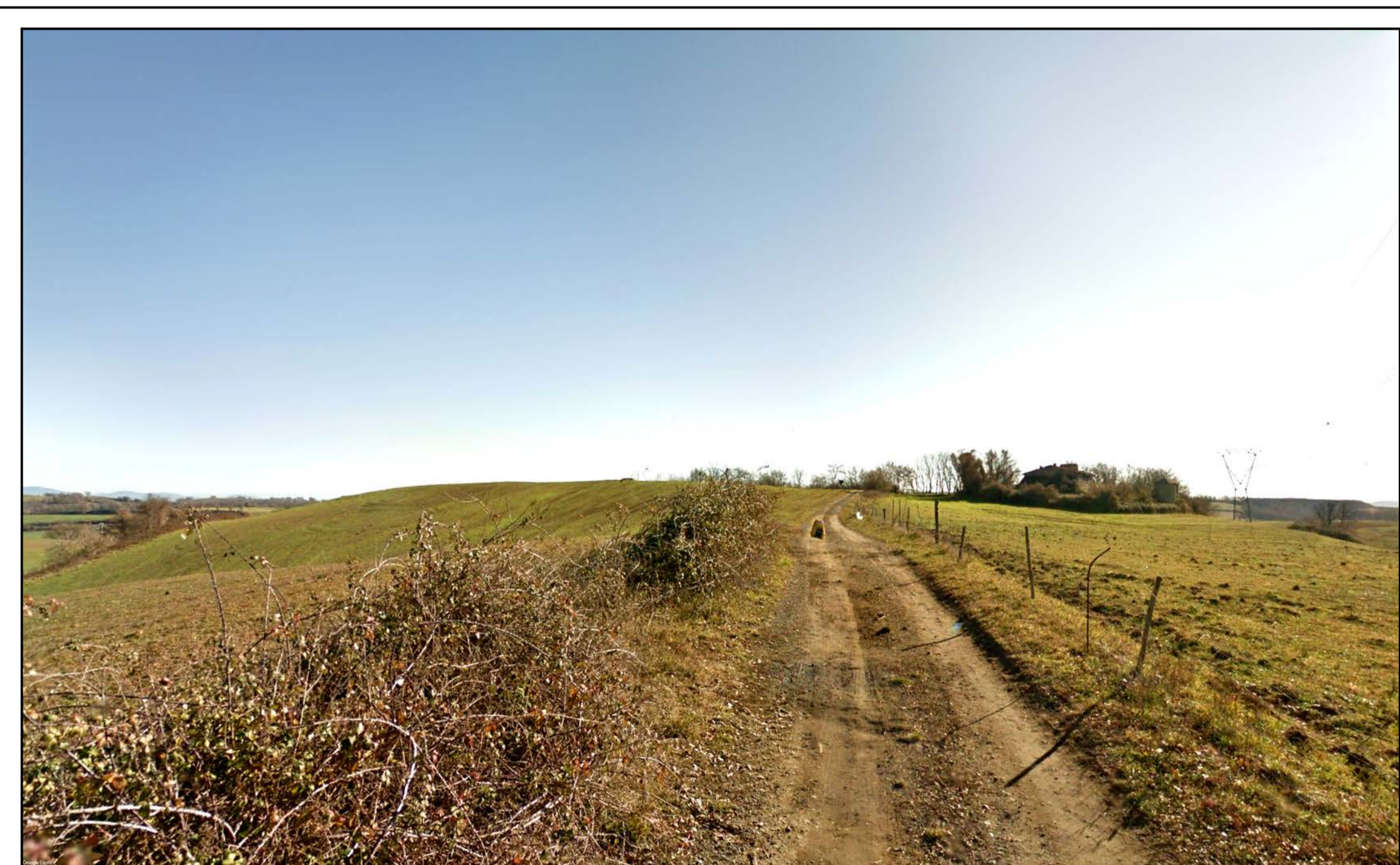
FOTOINSERIMENTO 29 - STATO DI FATTO

NOTA: il numero del Fotoinsertimento fa riferimento al Recettore individuato, nel navigatore sono stati riportati solo i recettori dai quali è stato sviluppato il fotoinsertimento. Per un elenco completo dei recettori selezionati si faccia riferimento allo Studio di Impatto Ambientale.