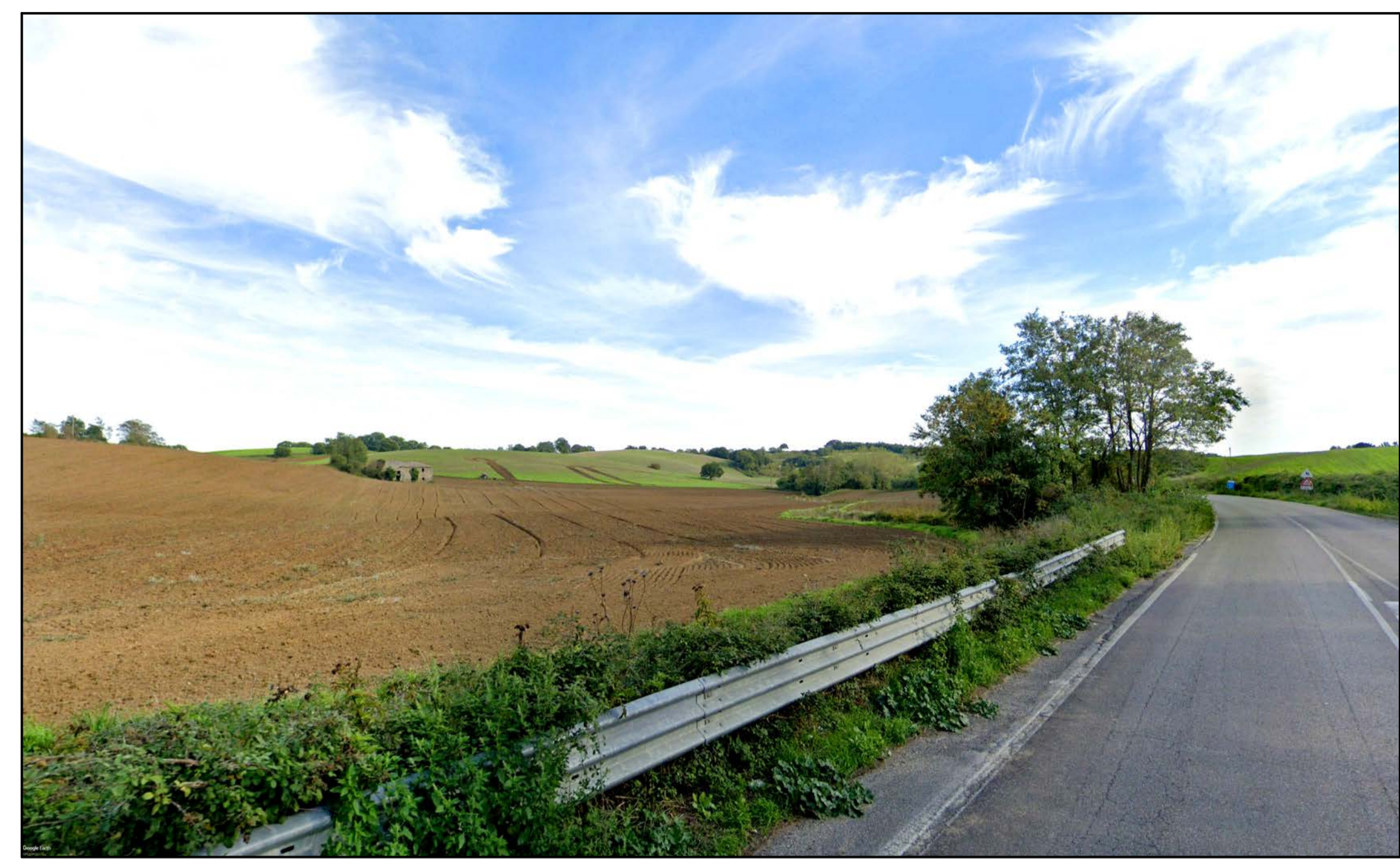
FOTOINSERIMENTO 27 - STATO DI FATTO