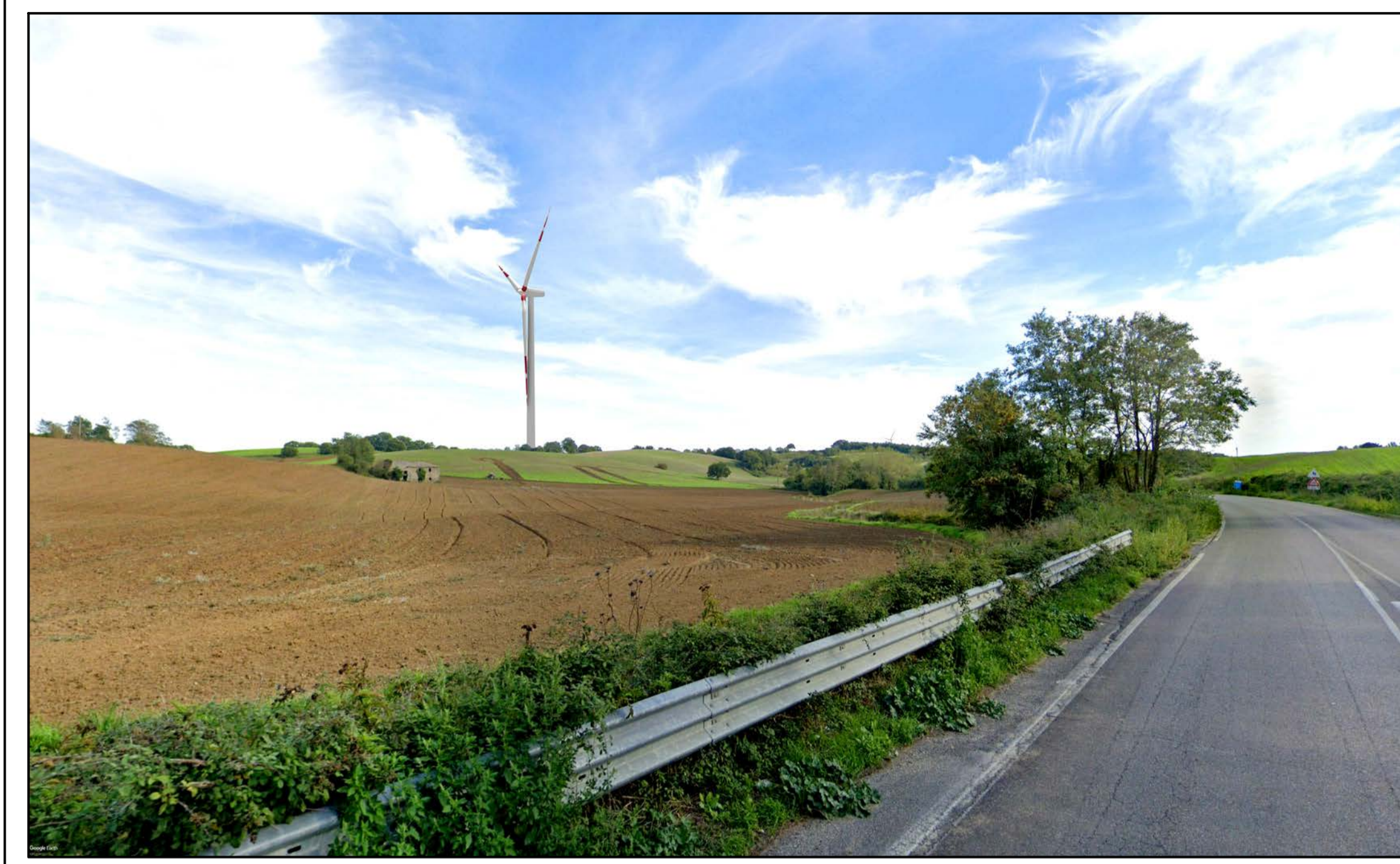
FOTOINSERIMENTO 27 - STATO DI PROGETTO