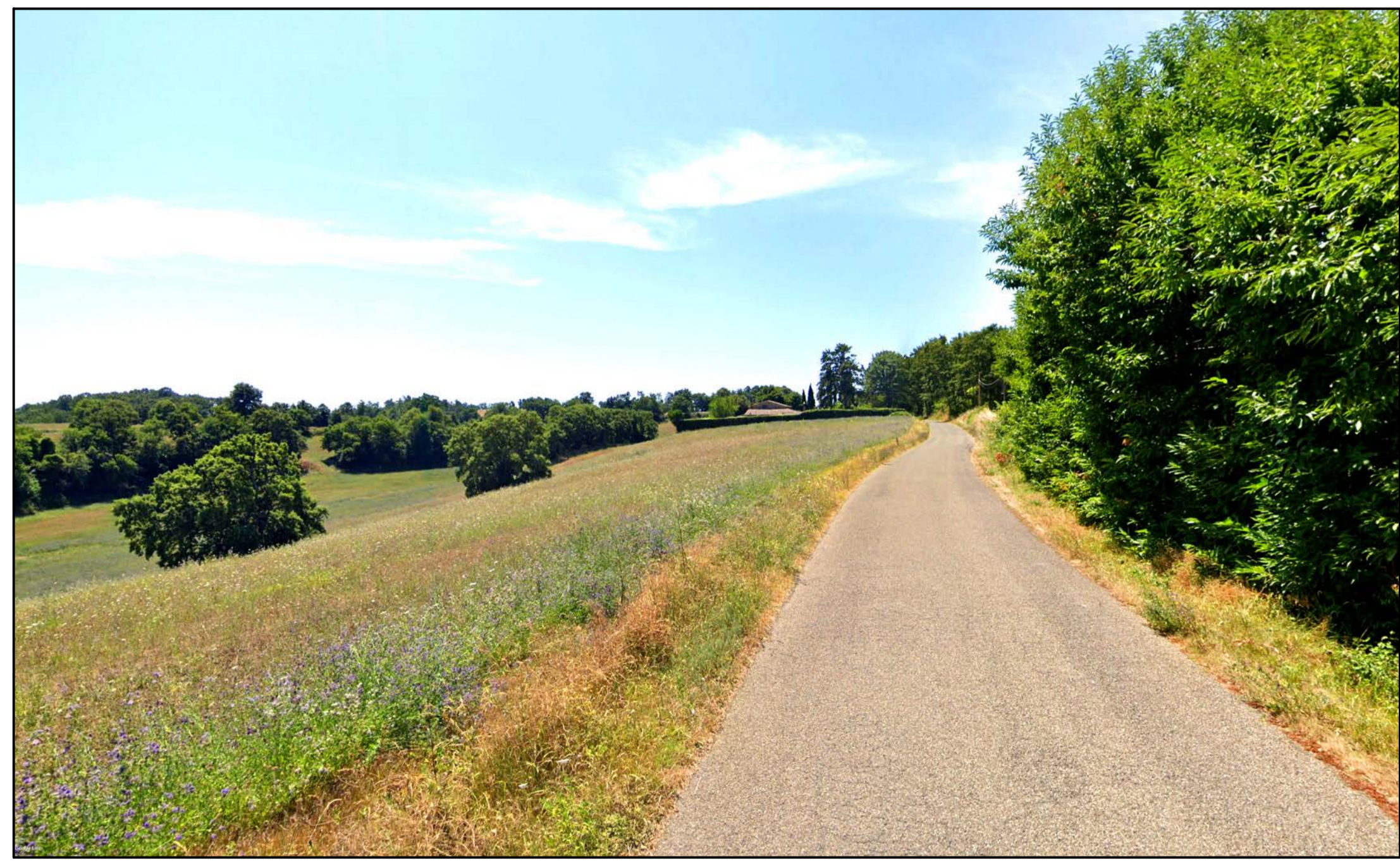
FOTOINSERIMENTO 36 - STATO DI FATTO

NOTA: il numero del Fotoinserimento fa riferimento al Recettore individuato, nel navigatore sono stati riportati solo i recettori dai quali è stato sviluppato il fotoinserimento. Per un elenco completo dei recettori selezionati si faccia riferimento allo Studio di Impatto Ambientale.