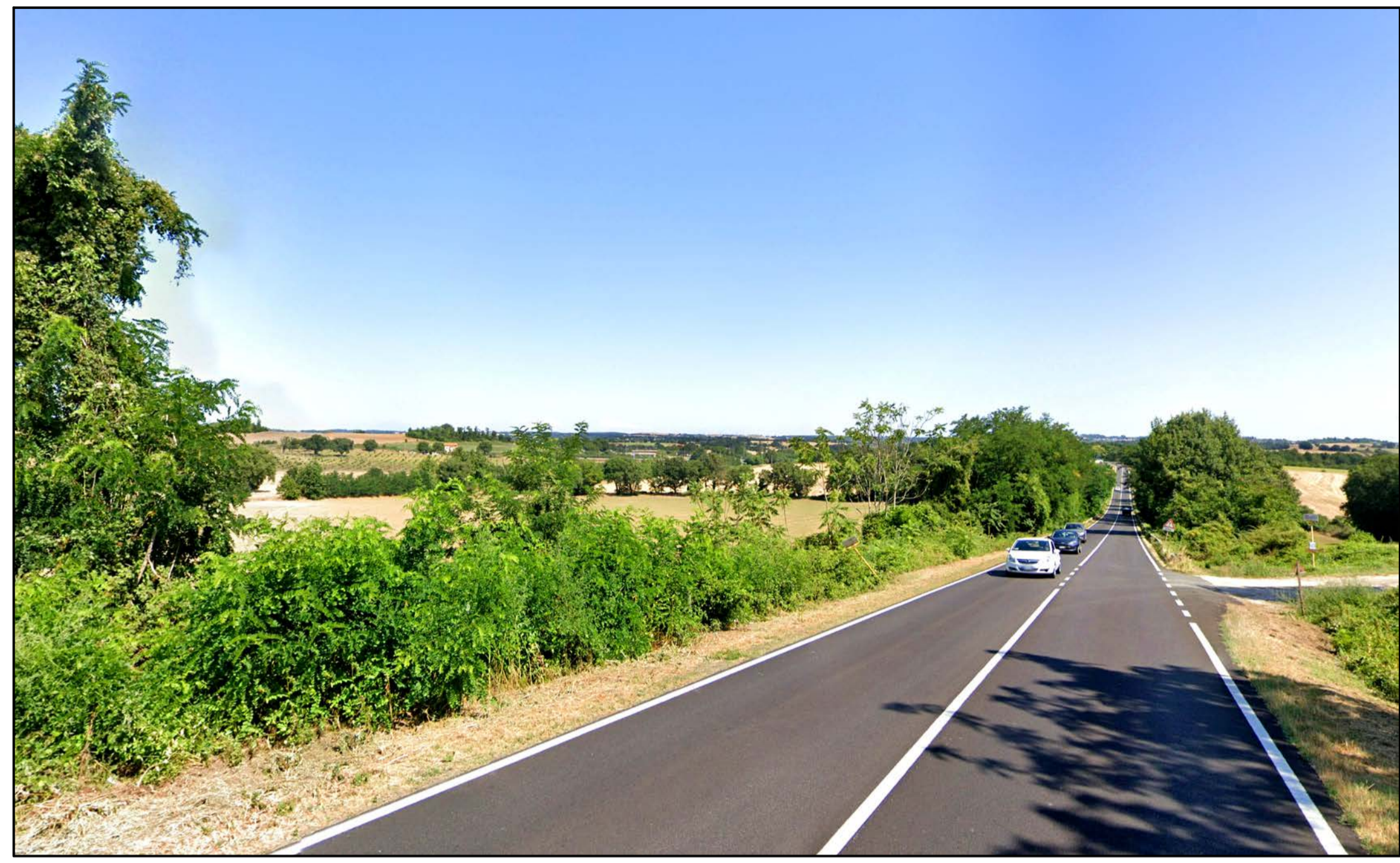
FOTOINSERIMENTO 33 - STATO DI FATTO