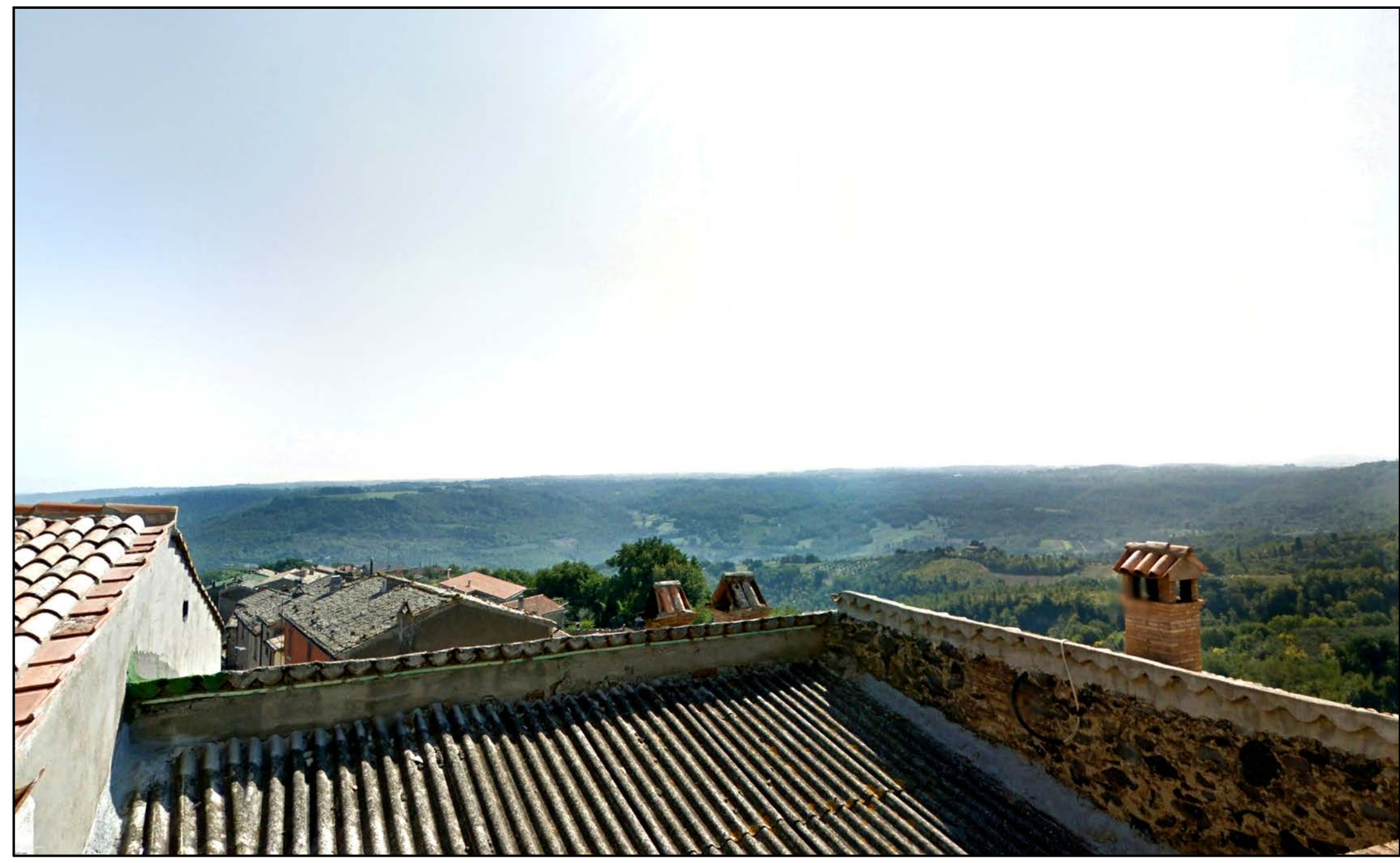
FOTOINSERIMENTO 39 - STATO DI FATTO