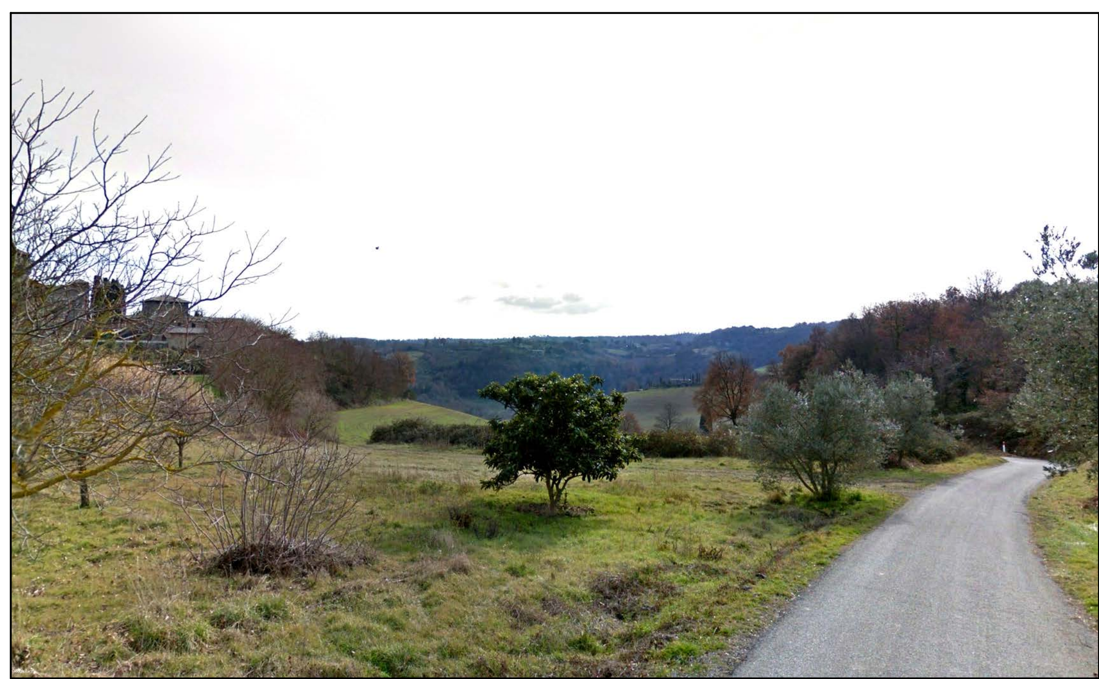
FOTOINSERIMENTO 40 - STATO DI FATTO