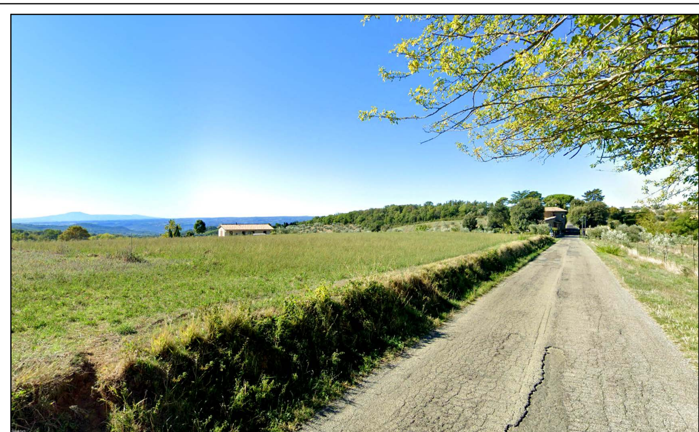
FOTOINSERIMENTO 42 - STATO DI FATTO

NOTA: il numero del Fotoinserimento fa riferimento al Recettore individuato, nel navigatore sono stati riportati solo i recettori dai quali è stato sviluppato il fotoinserimento. Per un elenco completo dei recettori selezionati si faccia riferimento allo Studio di Impatto Ambientale.