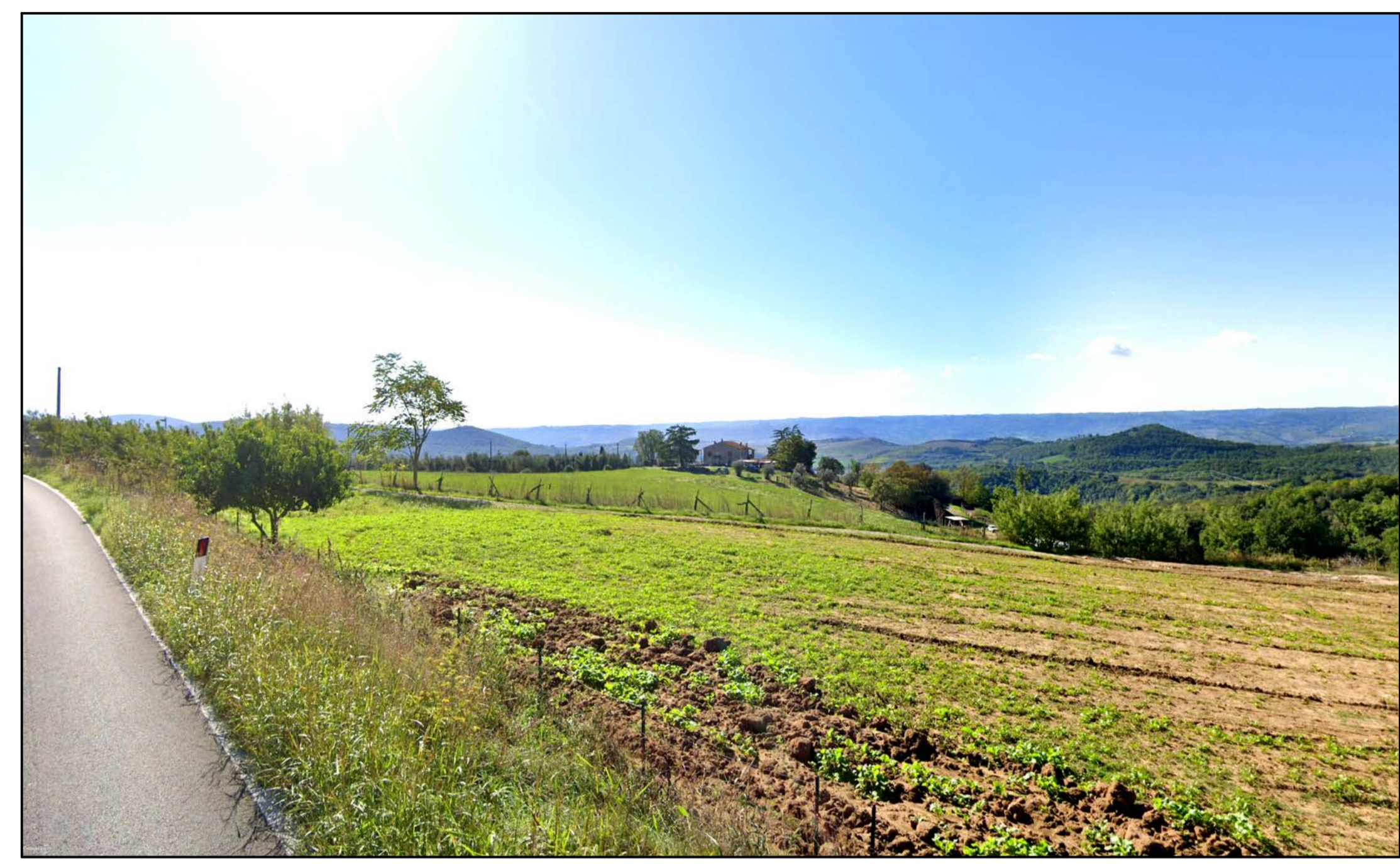
FOTOINSERIMENTO 41 - STATO DI FATTO