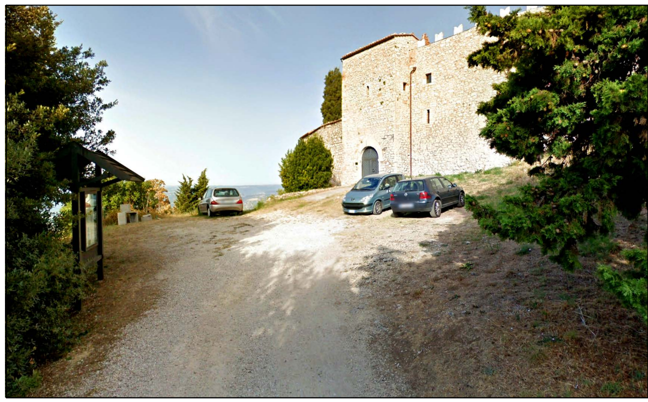
FOTOINSERIMENTO 44 - STATO DI FATTO

NOTA: il numero del Fotoinserimento fa riferimento al Recettore individuato, nel navigatore sono stati riportati solo i recettori dai quali è stato sviluppato il fotoinserimento. Per un elenco completo dei recettori selezionati si faccia riferimento allo Studio di Impatto Ambientale.