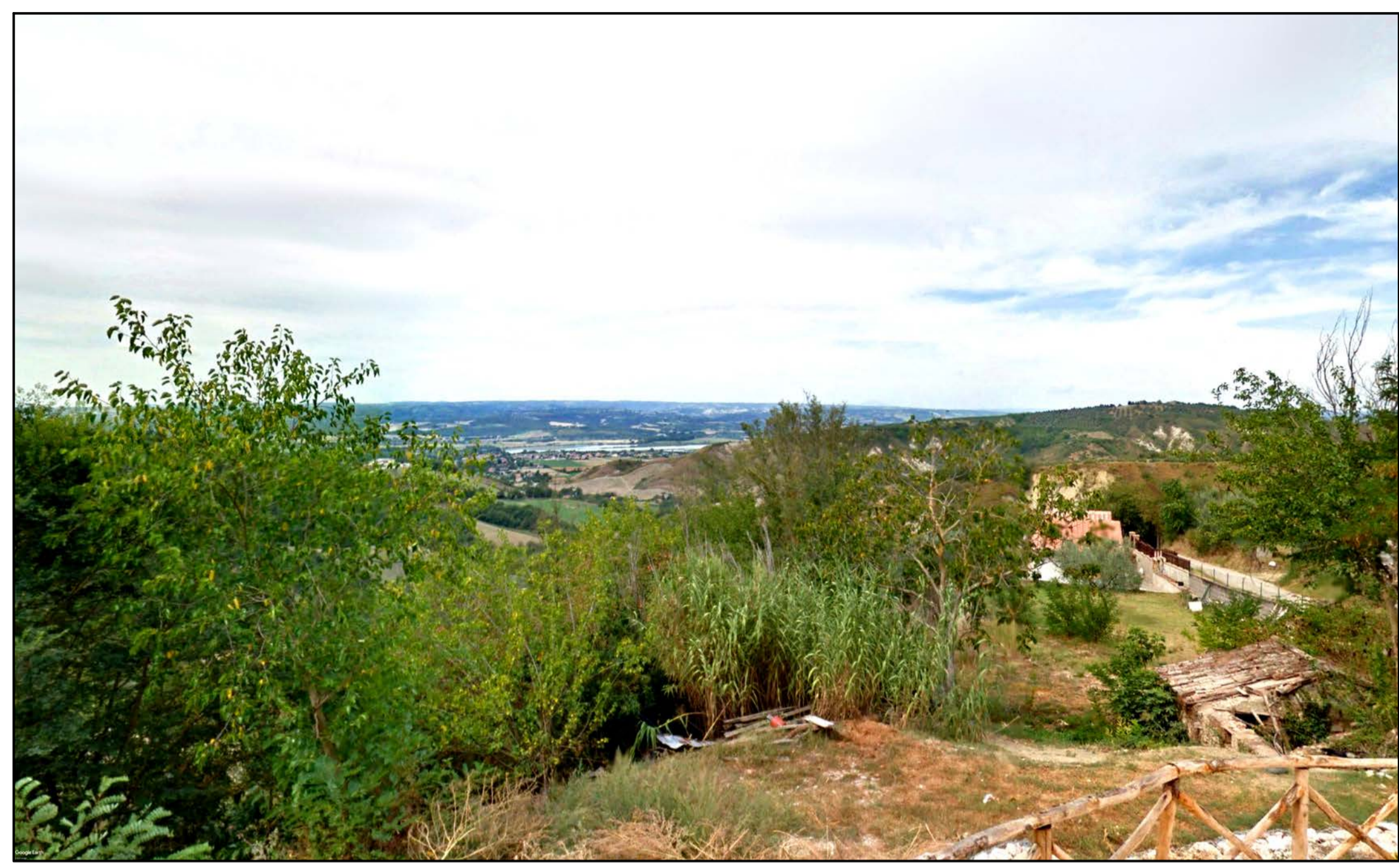
FOTOINSERIMENTO 43 - STATO DI FATTO