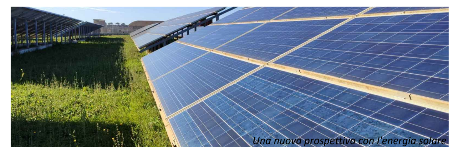
Una nuova prospettiva con l'energia solare

Progetto relativo alla costruzione e l'esercizio di un impianto fotovoltaico, denominato "FERRANDINA_FV", avente potenza nominale di 48 MWp, potenza in immissione richiesta 41,28 MW, e relative opere di connessione alla rete elettrica nazionale