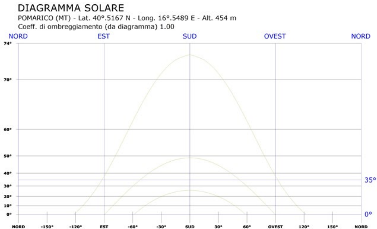
Fig. 2: Diagramma solare

Il Coefficiente di Ombreggiamento, funzione della morfologia del luogo, è pari a 1.00 . Di seguito il diagramma solare per il comune di POMARICO: