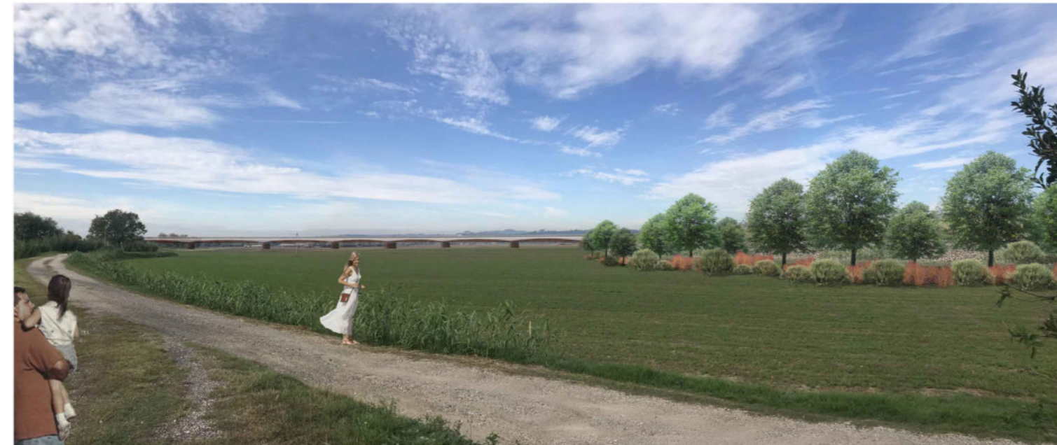
2 Il punto di ripresa fotografica, sito lungo la strada poderalica che affianca il fosso Pantanella, apre la vista sul viadotto dell'asse 2 (distante circa 250 metri dal punto considerato) e su parte del tracciato della strada argine. La forma del viadotto e la scelta cromatica consentono di introdurre l'opera d'arte nel contesto mantenendo l'apertura del campo visuale. Lungo la strada argine si vede il filare arboreo arbustivo con il percorso ciclopedonale posto tra il rilevato stradale ed il filare.