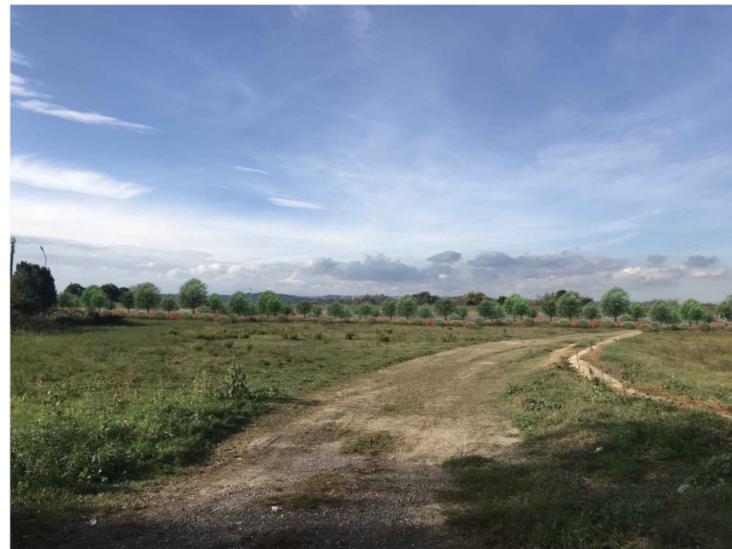
4 Il punto di ripresa fotografica dista circa 110 metri dal tracciato della strada argine. L'impianto del filare arboreo ed arbustivo ha l'intento di riprodurre un segno già presente sul territorio, rappresentato dalla vegetazione del fiume Tevere, ovvero quanto attualmente visibile dal fronte posto lungo la via Val Gardena. Le condizioni di visibilità dal fronte edificato non mutano: la vista rimane ampia, l'effetto che si avrà nella situazione post operam sarà quello di avere la vegetazione in posizione più ravvicinata.