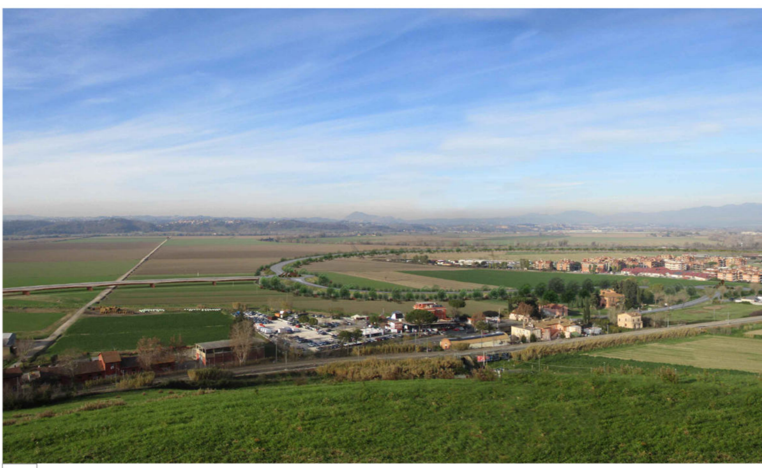
7 Il punto 7, ripreso dalla collina della Marcigliana che si caratterizza - come detto - da difficili condizioni di accessibilità, si apre sull'ampio fondovalle del Tevere e consente di avere l'unica visione panoramica del tracciato di progetto. Il tracciato della strada argine con la sistemazione a verde viene a creare un nuovo segno, assimilabile per la forma, a quello del fiume Tevere. Il tracciato si perde nella vastità della piana e si va a confondere con gli elementi del territorio. In primo piano il tratto terminale della strada argine ed il viadotto.