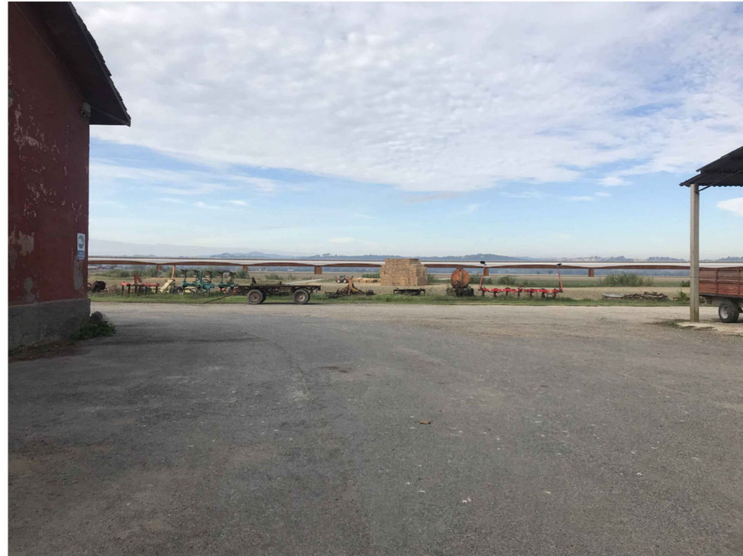
3 Il punto di ripresa fotografica, preso in prossimità dell'accesso al casale, dista circa 350 metri dall'opera d'arte. Il viadotto, pur rappresentando un nuovo "segno", in considerazione delle scelte architettoniche effettuate, si va ad integrare nel contesto e altera solo parzialmente le attuali condizioni di visibilità: la vista rimane comunque ampia, continua ad aprirsi sulla pianura del Tevere e sulle colline.