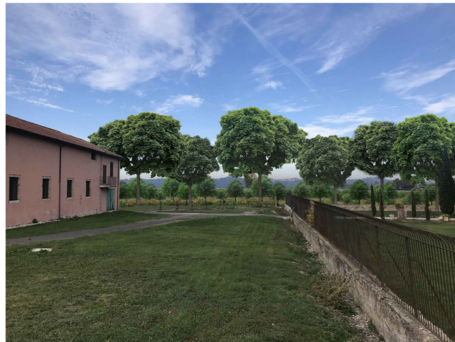
1 Il punto di ripresa fotografica dista circa 100 metri dal tracciato di progetto. I due manufatti vincolati e la villa ad essi vicina si trovano in posizione più ravvicinata rispetto al punto di vista. La strada argine va a determinare la chiusura del campo agricolo inserendo un ostacolo nel campo visuale, attualmente totalmente libero. La distanza del rilevato rispetto ai manufatti tutelati è di circa 50 metri mentre rispetto alla villa adiacente è di 35. Si ricorda che il piccolo sagrato della chiesa di S. Giorgio è rivolto verso la via Salaria, pertanto dall'ingresso della chiesa non è possibile vedere la piana del Tevere. L'impianto a verde proposto (filare a protezione della strada argine e formazione boschiva) consente di effettuare il mascheramento dell'infrastruttura consentendo di mantenere condizioni di visibilità relative alla vista di "sfondo" sul sistema collinare che lambisce la piana del Tevere.