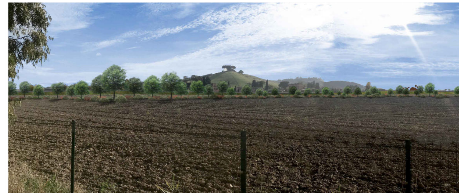
6 Il punto di ripresa fotografica dista circa 390 metri dal tracciato della strada argine e guarda in direzione delle formazioni collinari poste a ridosso della via Salaria. Analogamente con quanto indicato per i precedenti punti 4 e 5 l'impianto del filare arboreo arbustivo ha l'intento di riprodurre un segno già presente sul territorio, rappresentato dalla vegetazione del fiume Tevere. Le condizioni di visibilità dal fronte edificato posto lungo la via Montegrappa non mutano: la vista rimane ampia, l'effetto che si avrà nella situazione post operam sarà quello di avere in primo piano maggiore presenza delle formazioni a valenza naturalistica che attualmente sono limitate a qualche esemplare posto lungo la via Salaria. Sul lato destro dell'immagine si intravede il landmark previsto all'interno della rotonda che vuole ricordare all'utente della nuova strada la presenza delle formazioni collinari della riserva della Marcigliana.