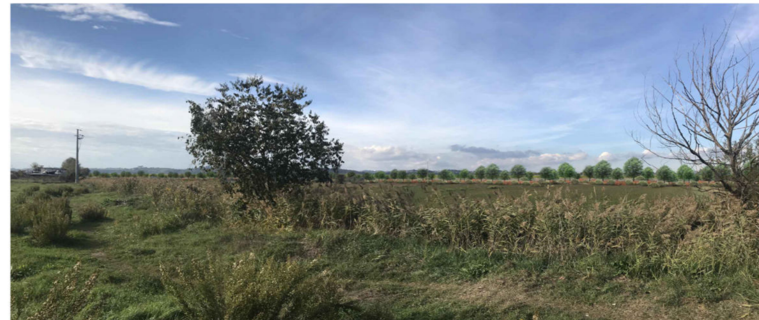
5 Il punto di ripresa fotografica dista circa 190 metri dal tracciato della strada argine. Analogamente con quanto indicato per il precedente punto 4 l'impianto del filare arboreo arbustivo ha l'intento di riprodurre un segno già presente sul territorio, rappresentato dalla vegetazione del fiume Tevere, ovvero quanto attualmente visibile, seppur in lontananza, posto lungo viale Carso. Le condizioni di visibilità dal fronte edificato non mutano: la vista rimane ampia, l'effetto che si avrà nella situazione post operam sarà quello di avere la vegetazione in posizione più ravvicinata.