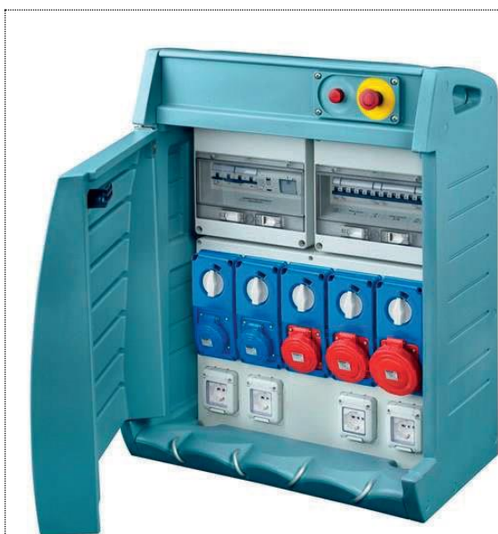
Figura 5 ASC di alimentazione principale