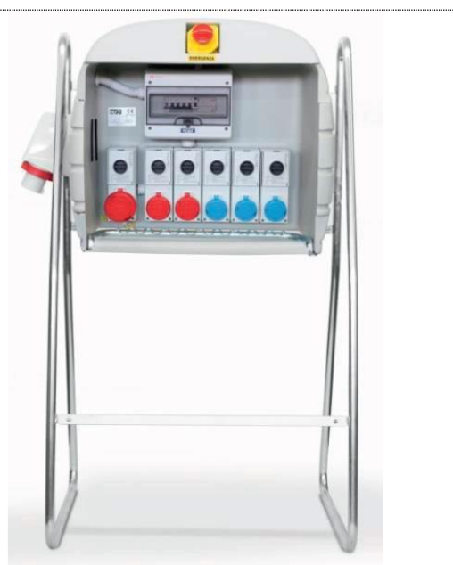
Figura 6 - ASC di distribuzione