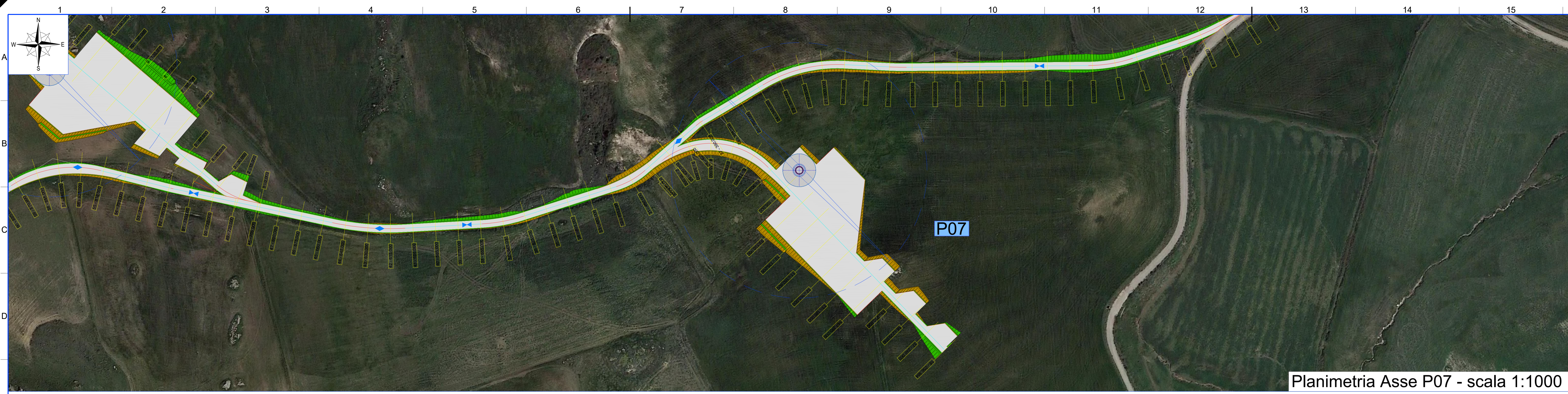
Planimetria Asse P07 - scala 1:1000