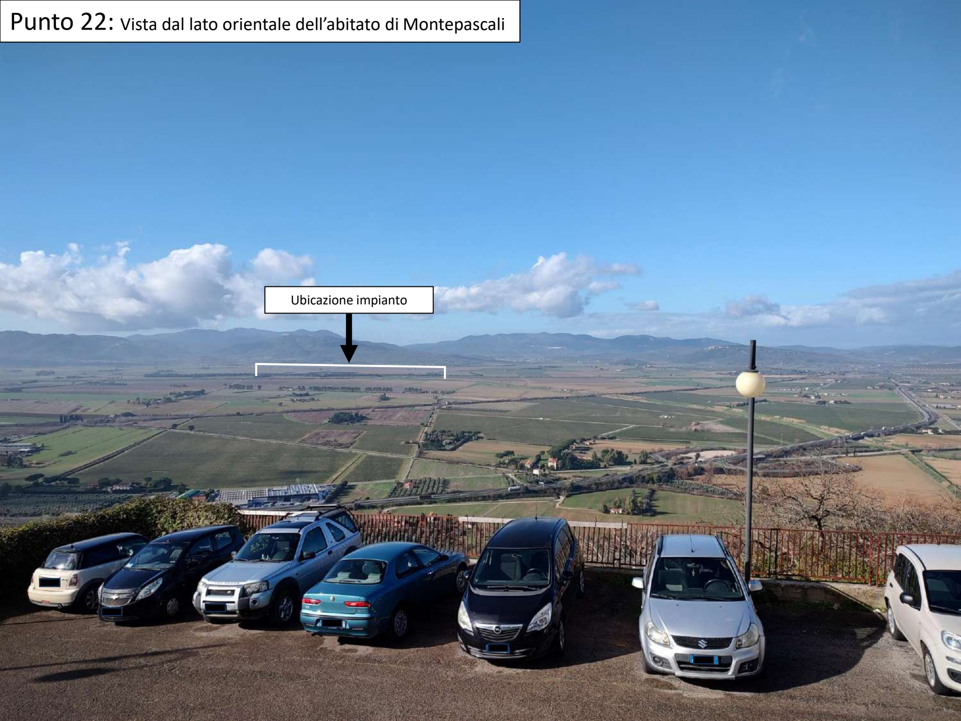
Punto 22: Vista dal lato orientale dell'abitato di Montepascalì