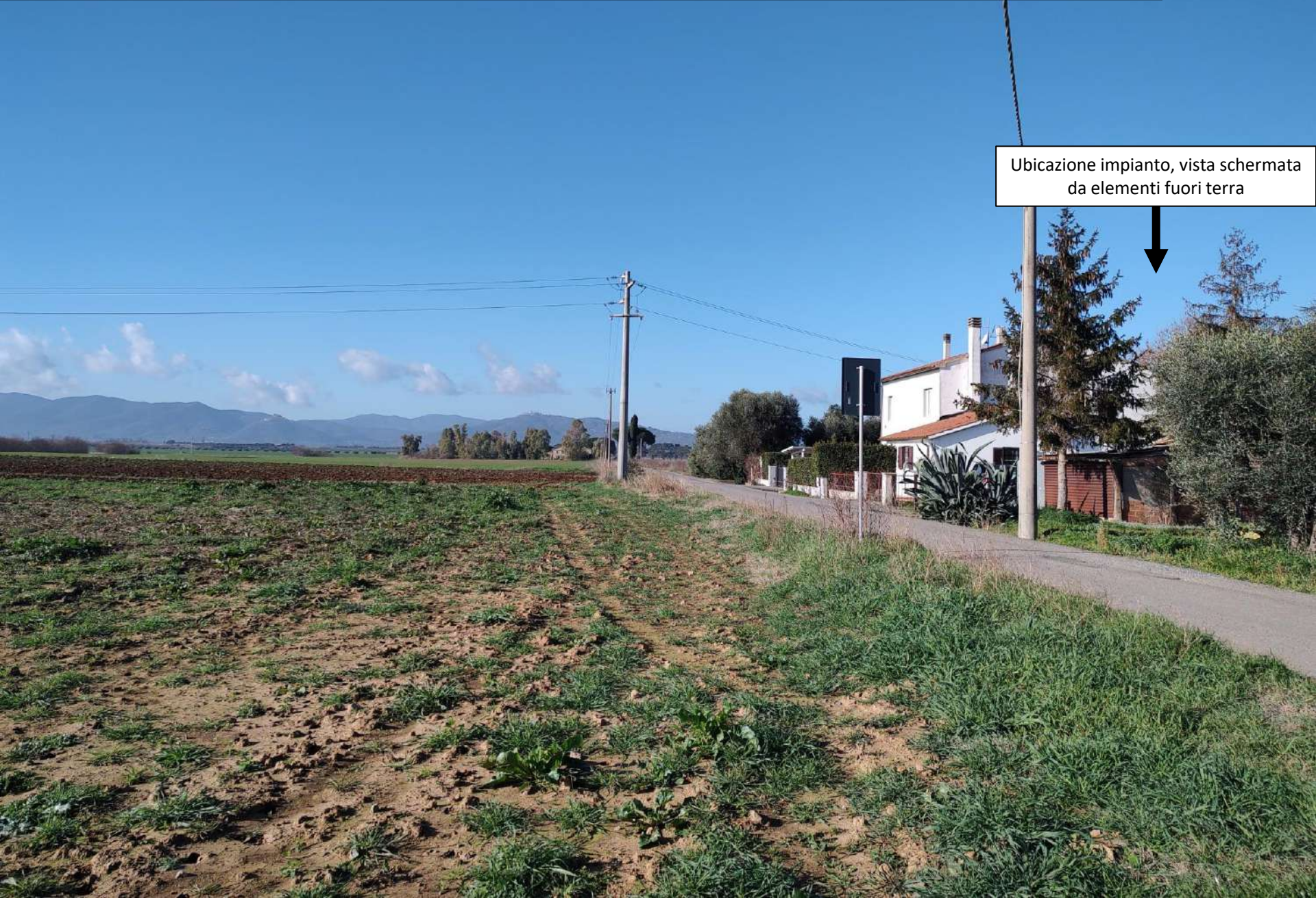
Ubicazione impianto, vista schermata da elementi fuori terra