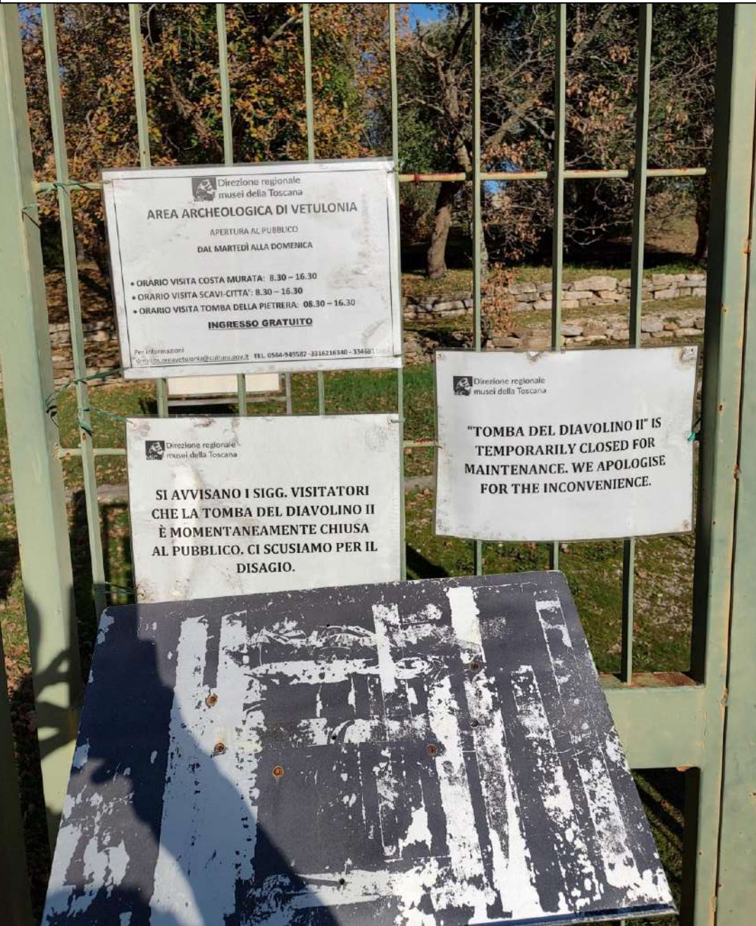
Punto 33: Bene archeologico Tomba del Diavolo temporaneamente chiusa