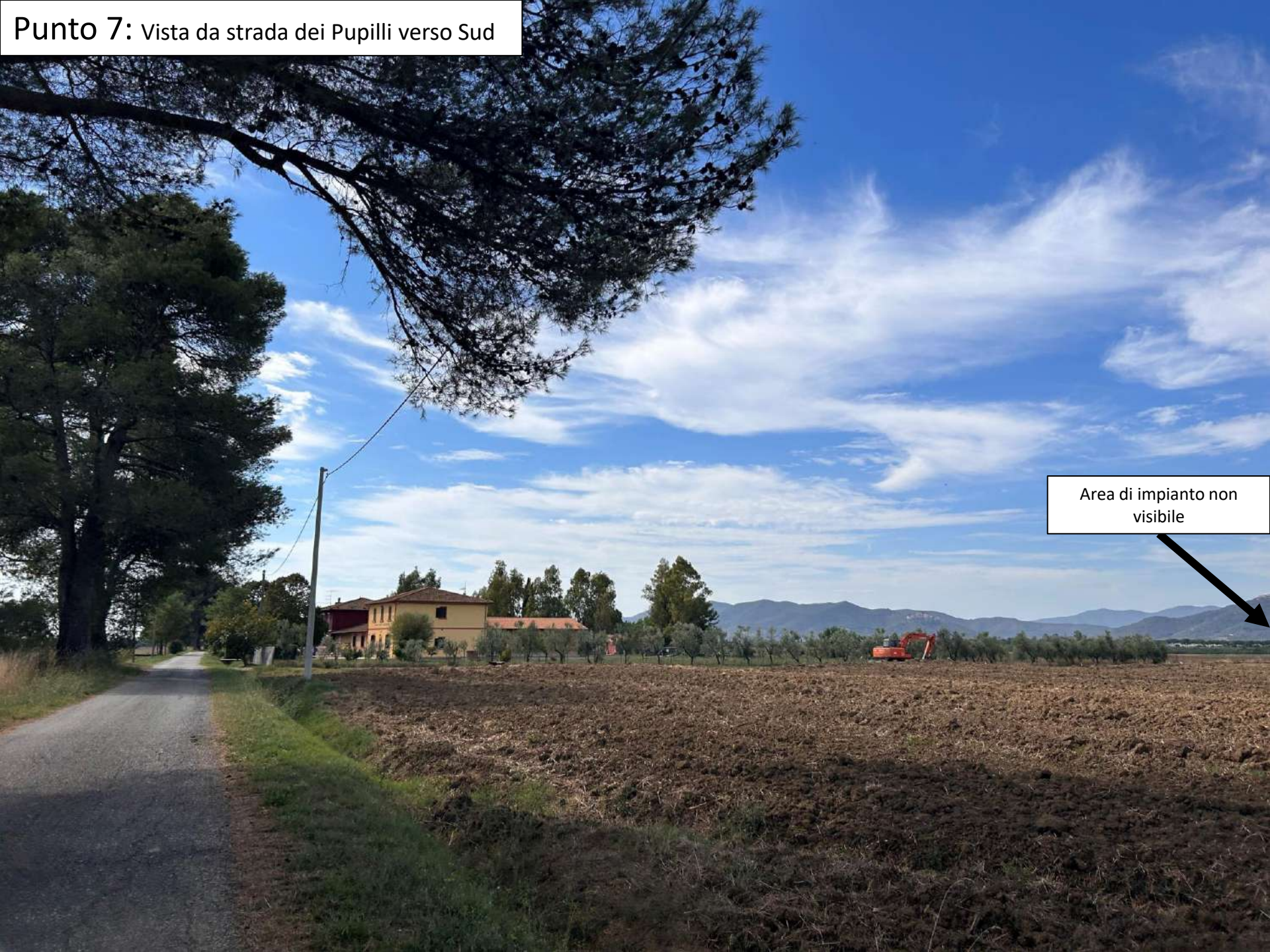
Punto 7: Vista da strada dei Pupilli verso Sud