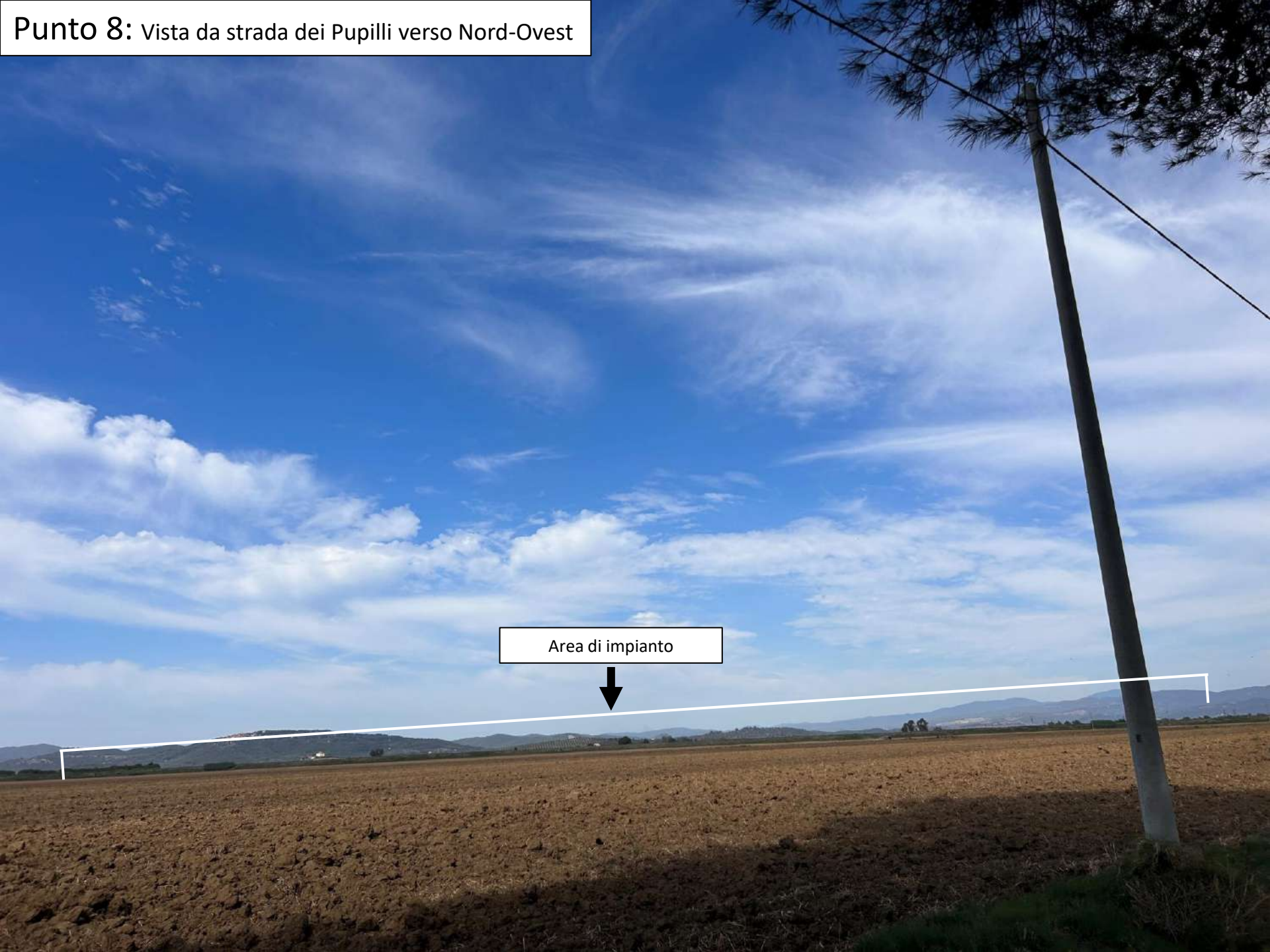
Punto 8: Vista da strada dei Pupilli verso Nord-Ovest