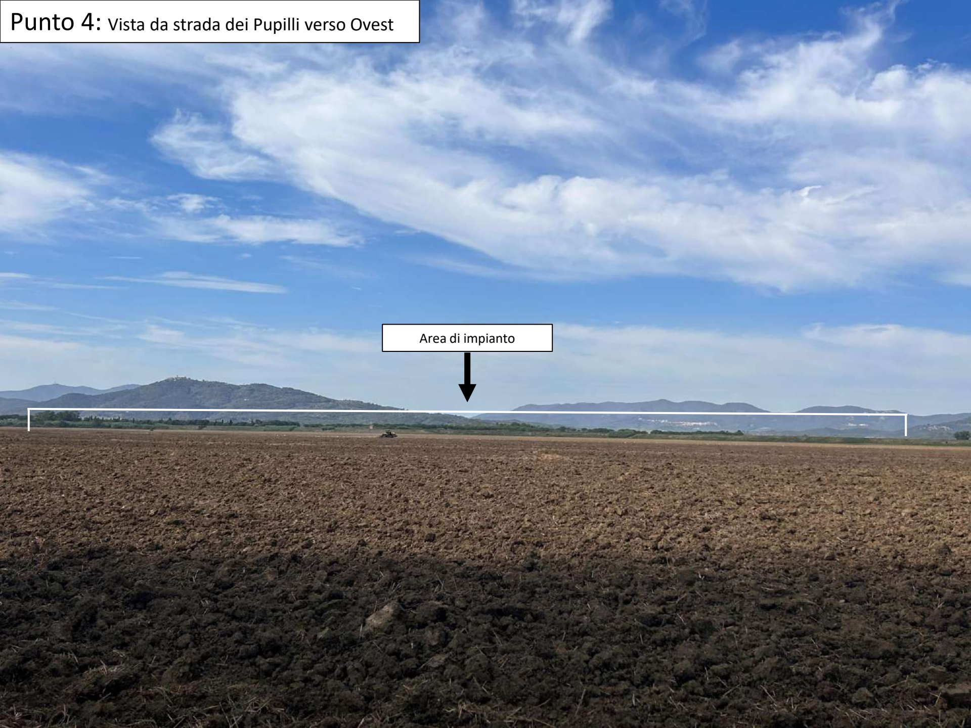
Punto 4: Vista da strada dei Pupilli verso Ovest