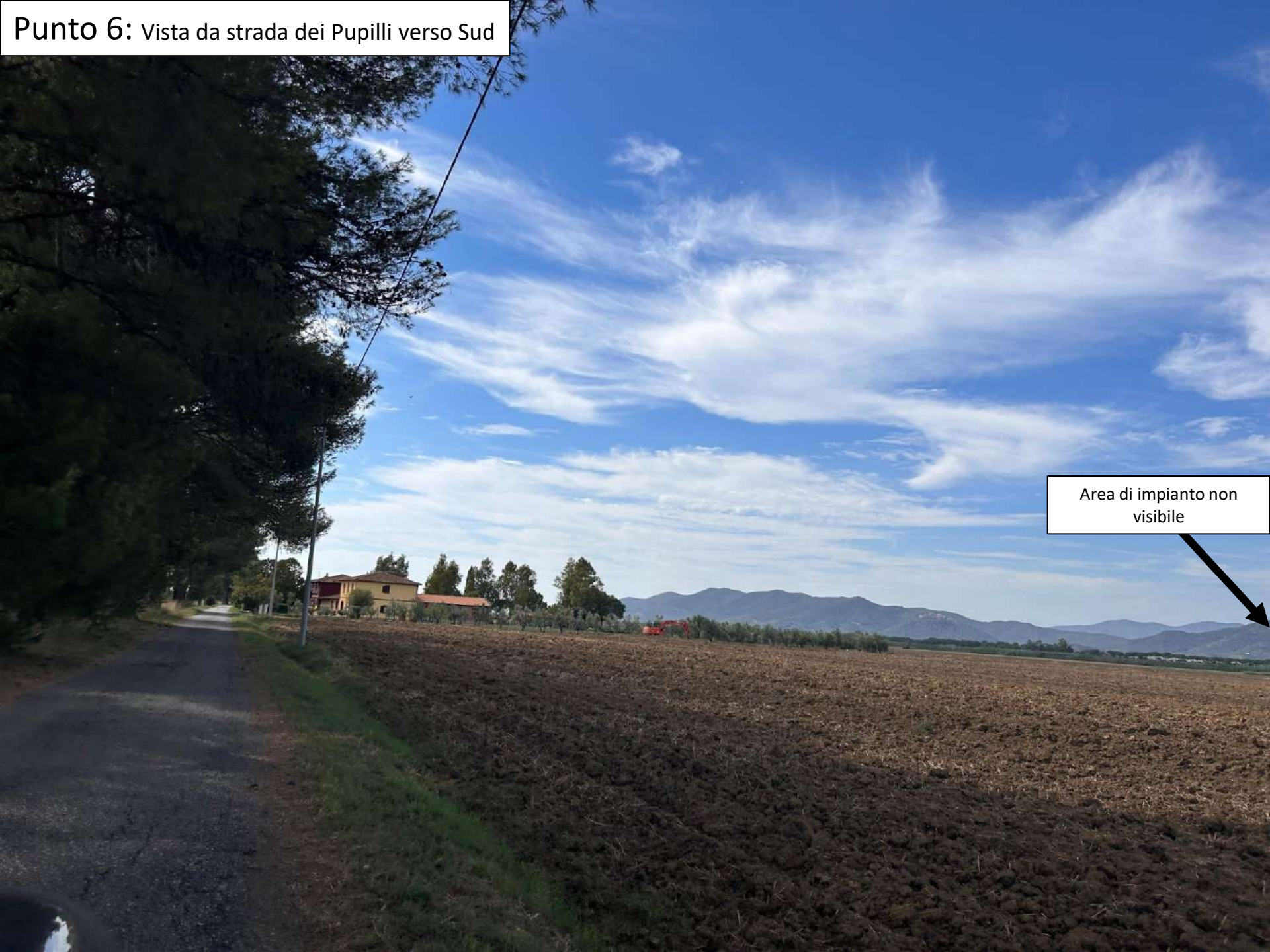
Punto 6: Vista da strada dei Pupilli verso Sud