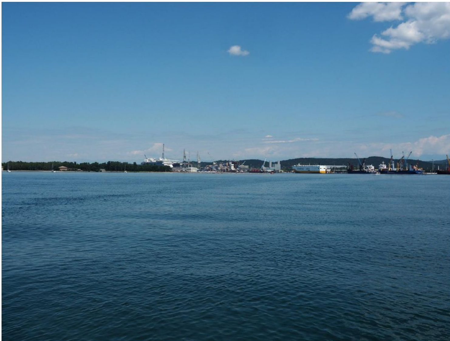
Figura 1f: Vista PV M3 al largo di Panzano - configurazione progetto autorizzato