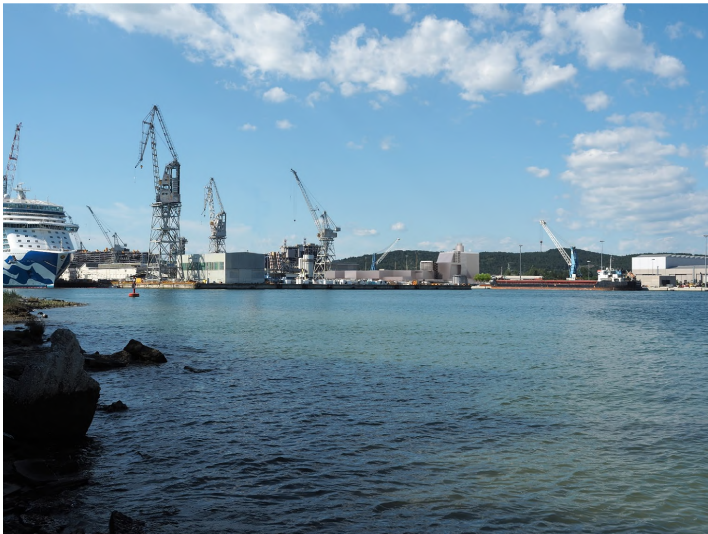
Figura 1c: Vista PV M1 dal promontorio di Panzano Bagni - configurazione progetto modificato oggetto della RP