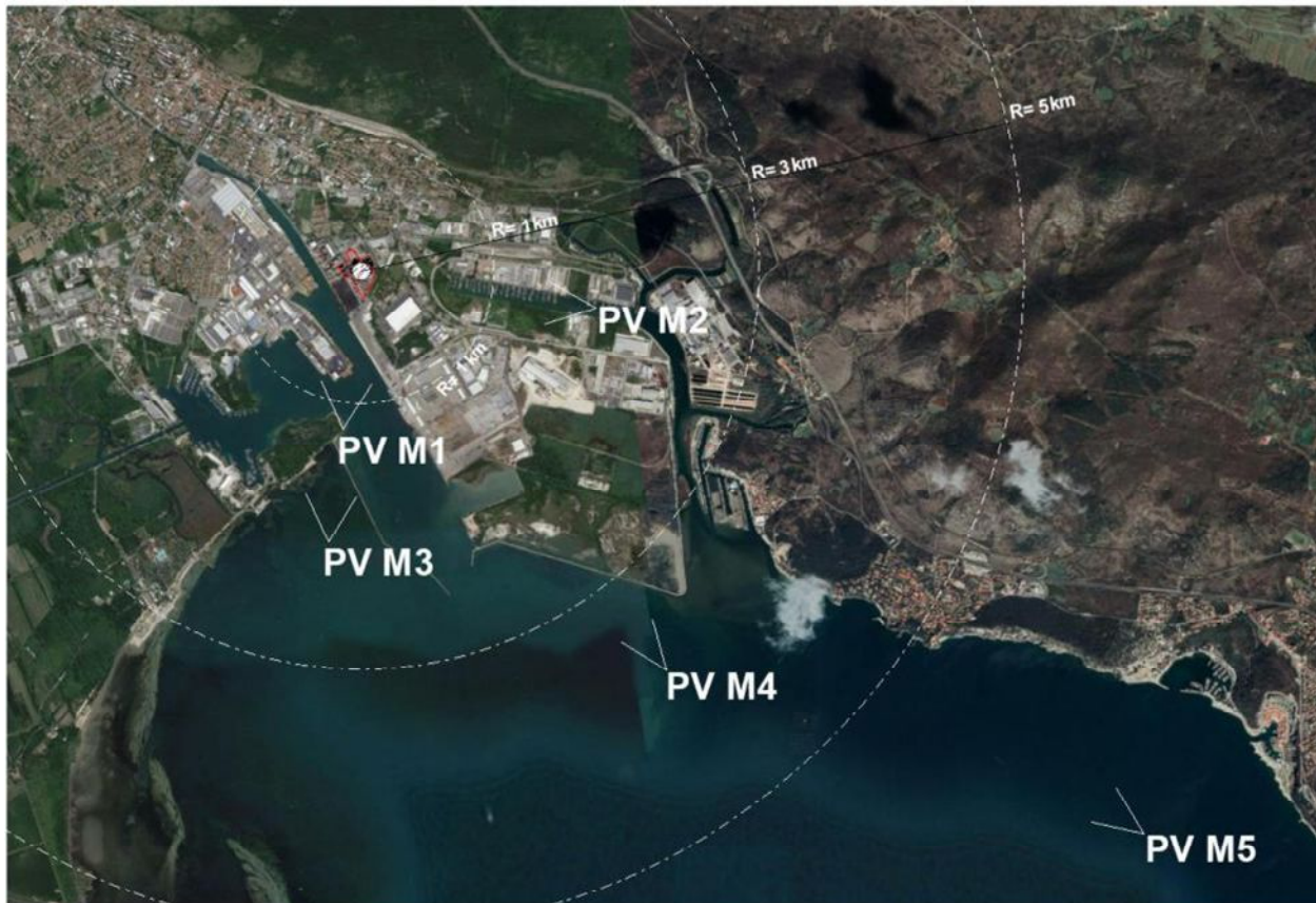
Figura 1a: Foto aerea dell'area di Monfalcone in cui sono riportate le posizioni dei fotoinserimenti rispetto alla centrale in progetto (punto bianco al centro dei cerchi di raggio 1-3-5 km).

Le caratteristiche dei punti di ripresa delle fotografie sono riportate nella seguente tabella.