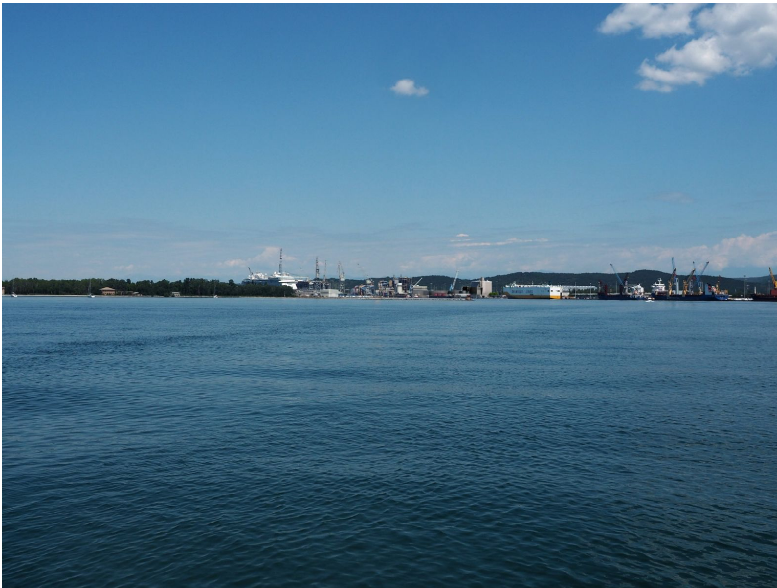
Figura 1g: Vista PV M3 al largo di Panzano - configurazione progetto modificato oggetto della RP