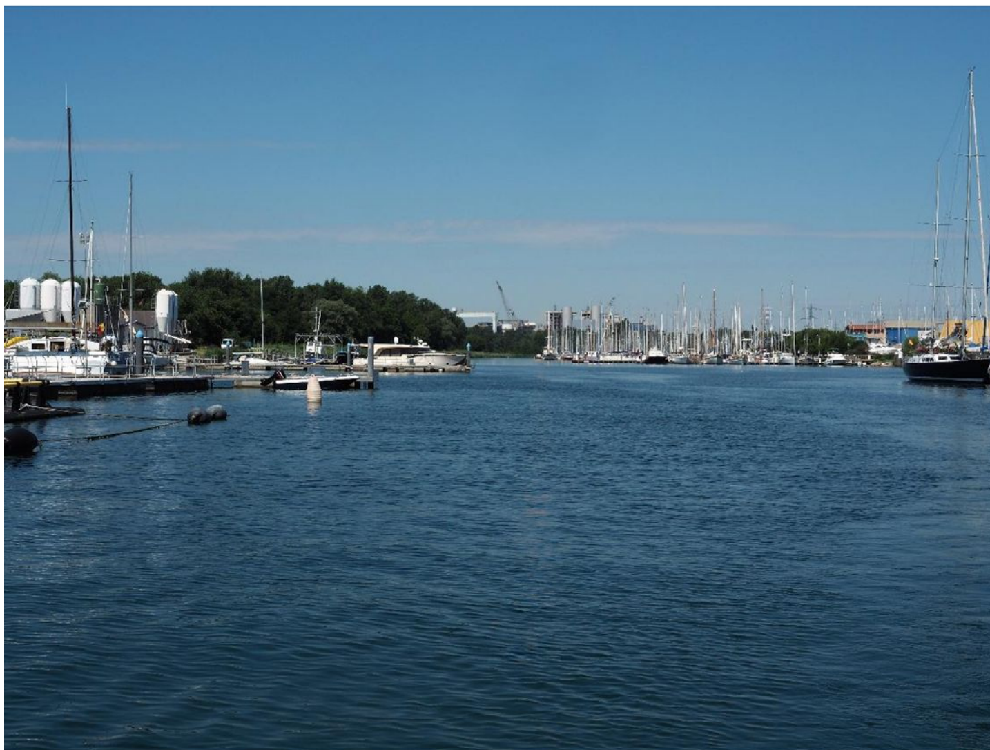
Figura 1d: Vista PV M2 in corrispondenza del porticciolo di Marina Lepanto - configurazione progetto autorizzato