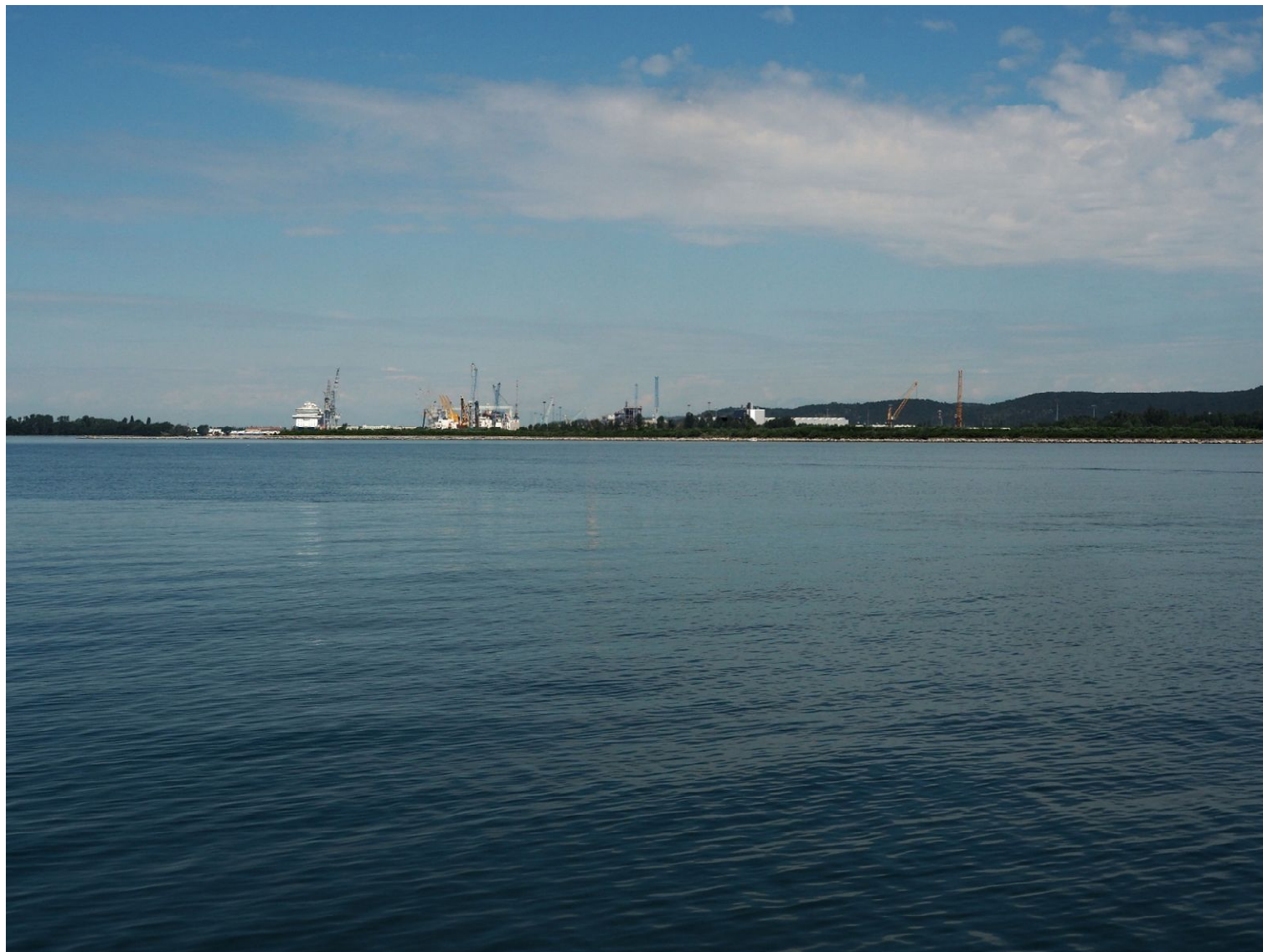
Figura 1i: Vista PV M4 al largo di Duino - configurazione progetto modificato oggetto della RP