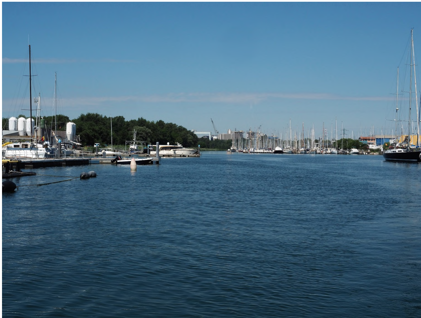
Figura 1e: Vista PV M2 in corrispondenza del porticciolo di Marina Lepanto - configurazione progetto modificato oggetto della RP