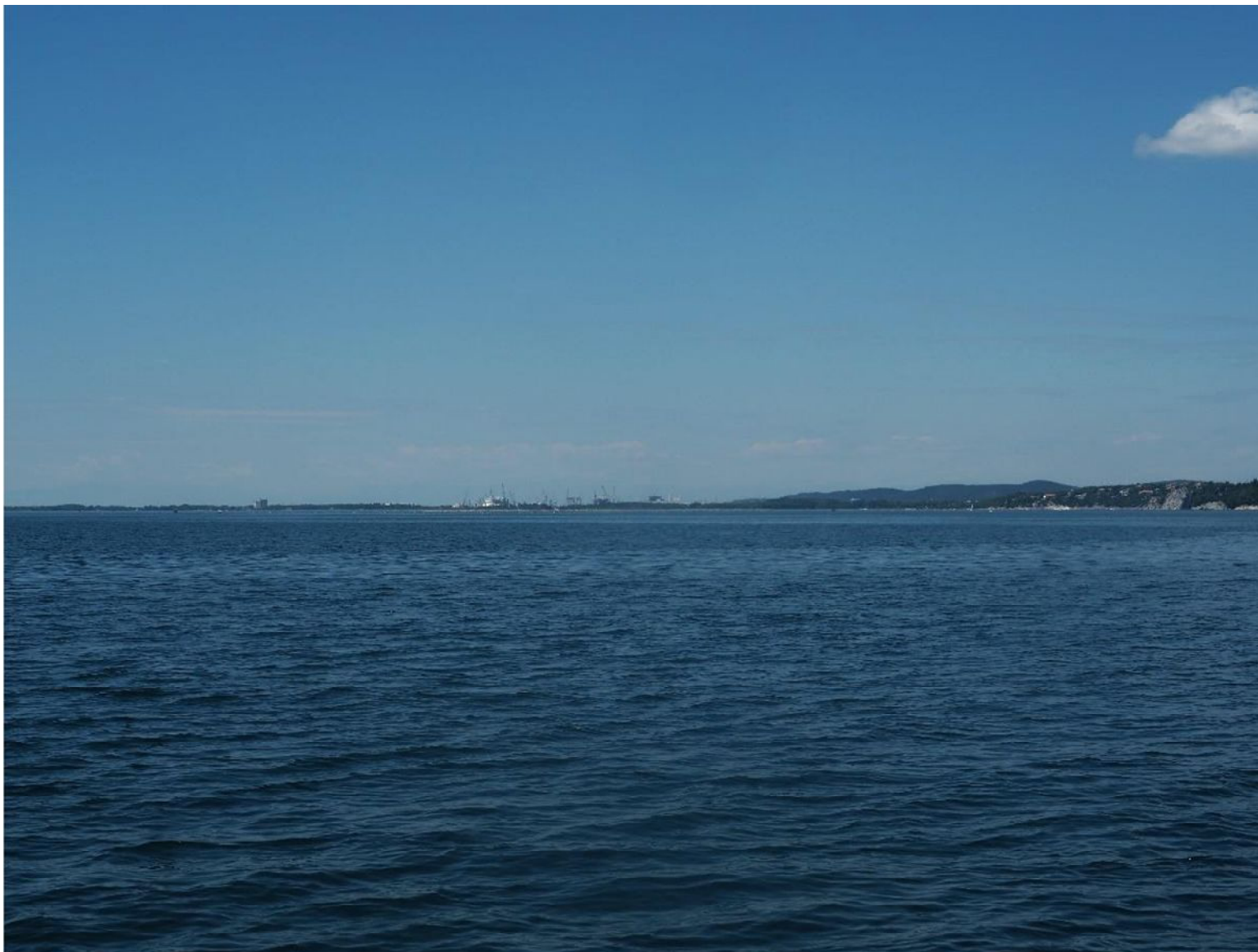
Figura 11: Vista PV M5 al largo di Sistiana, a SE della centrale - configurazione progetto autorizzato