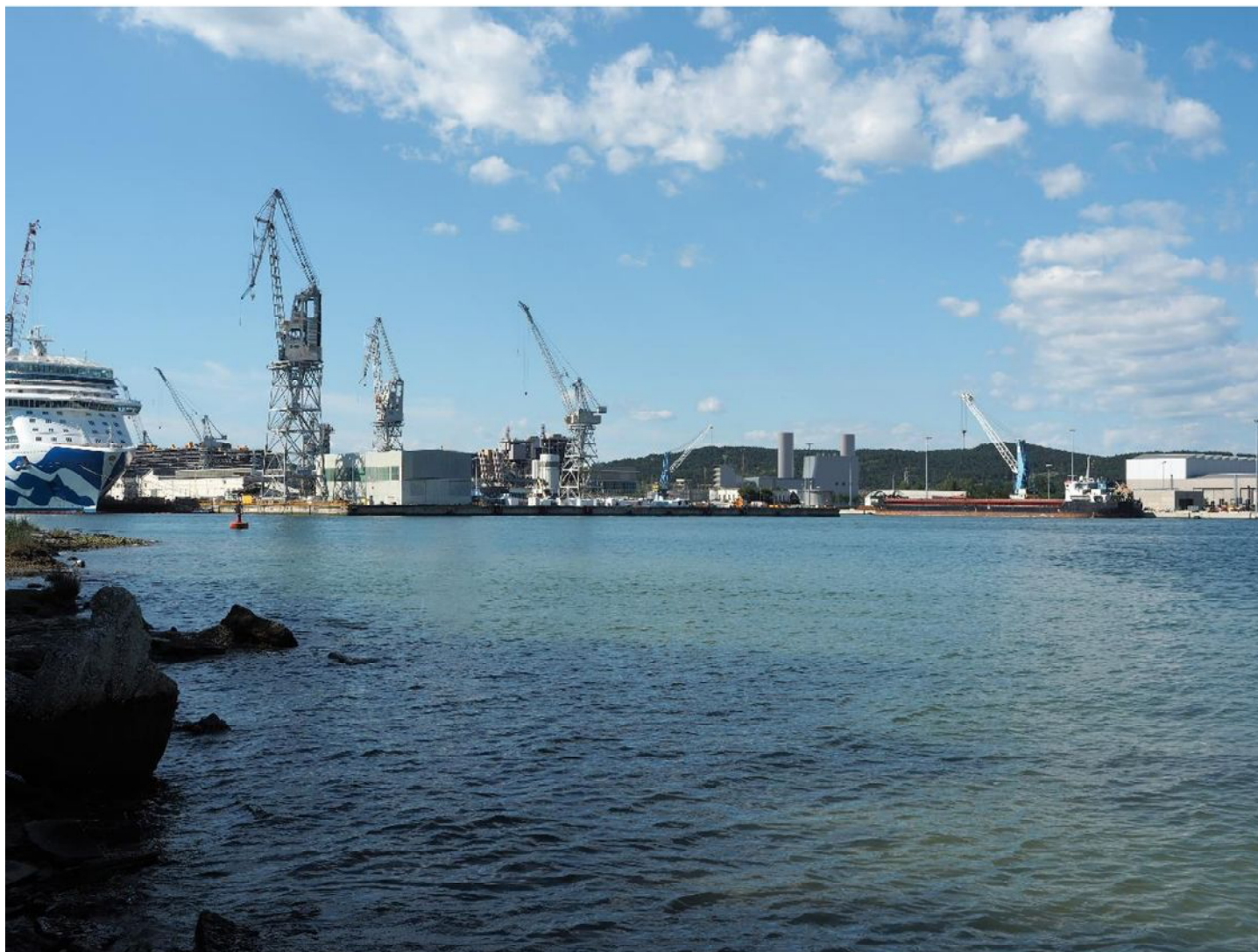
Figura 1b: Vista PV M1 dal promontorio di Panzano Bagni - configurazione progetto autorizzato