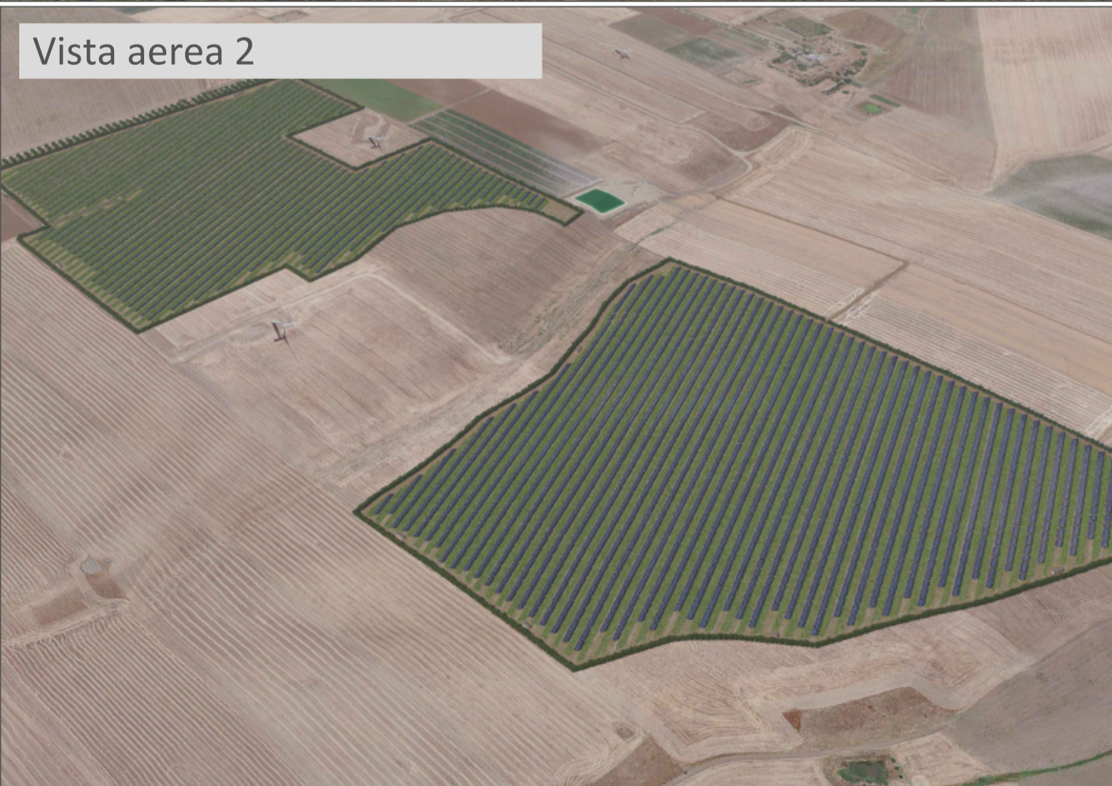
Vista aerea 2