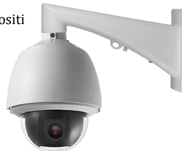
Figura 5 - Tipologico di telecamera "dome"

Di seguito si riportano le caratteristiche tecniche di un tipo ipotizzato da inserire a progetto: