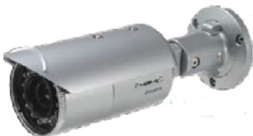
Figura 4 - Tipologico di telecamere IR fissa

Le telecamere fisse saranno posizionate sui pali dell'illuminazione perimetrale tramite apposito accessorio. La configurazione sarà tale da non lasciare angoli ciechi e da coprire la posizione di ciascuna telecamera con la visuale della precedente.