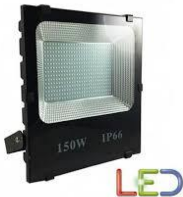
Figura 1 - Tipologico di proiettore LED

L'illuminazione perimetrale verrà posizionata su pali conici in acciaio laminato a caldo e privi di saldature di lunghezza pari a 3 m predisposti con foro per ingresso cavo di alimentazione, con attacco testa palo \phi 60 . La lunghezza da interrare sarà pari a 50 cm.