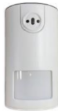
Figura 8 - Tipologico di sensore volumetrico

Dovendo effettuare l'installazione in locali ad alta instabilità termica verranno utilizzati sensori a doppia tecnologia (infrarossi e microonde) in grado di ridurre fortemente i falsi allarmi.