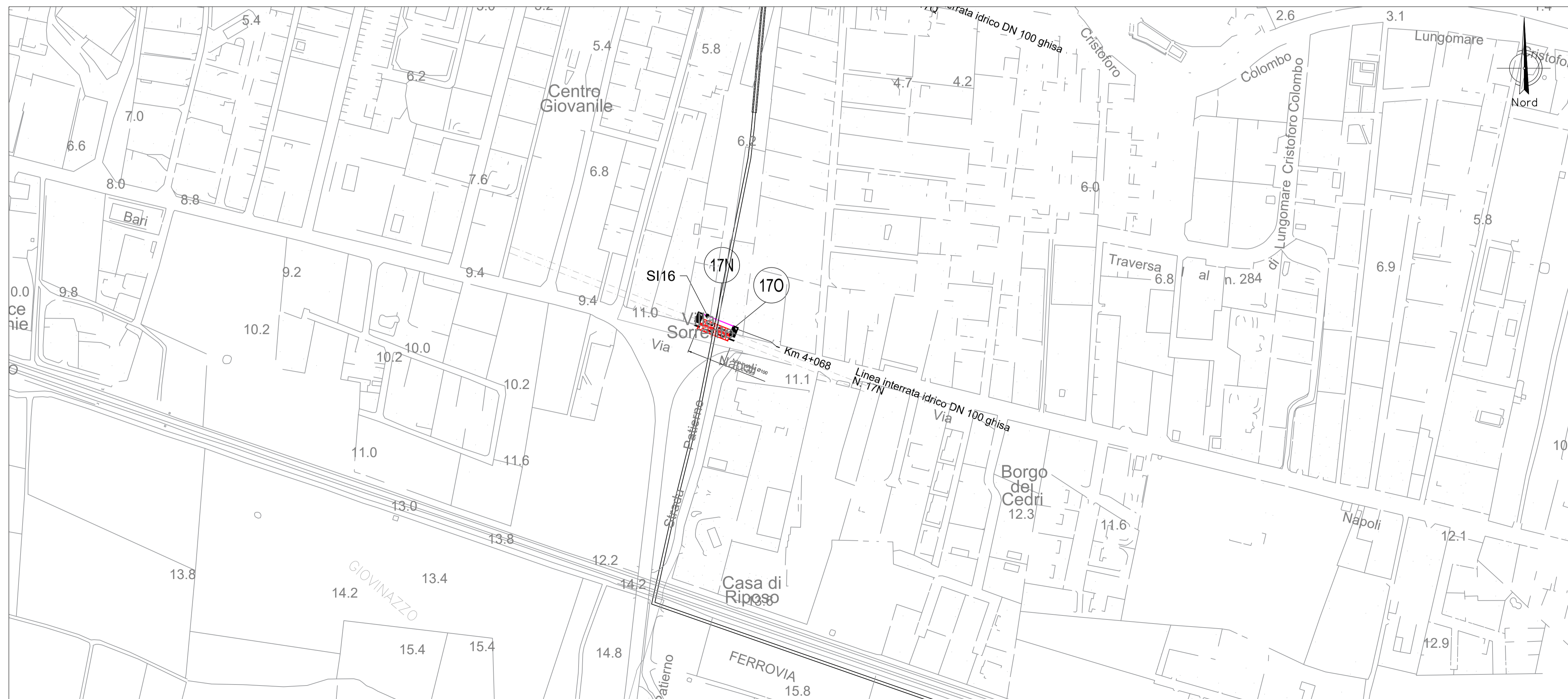
PLANIMETRIA PLANIMETRIA RISOLUZIONE INTERFERENZE SI16 Scala 1:2000