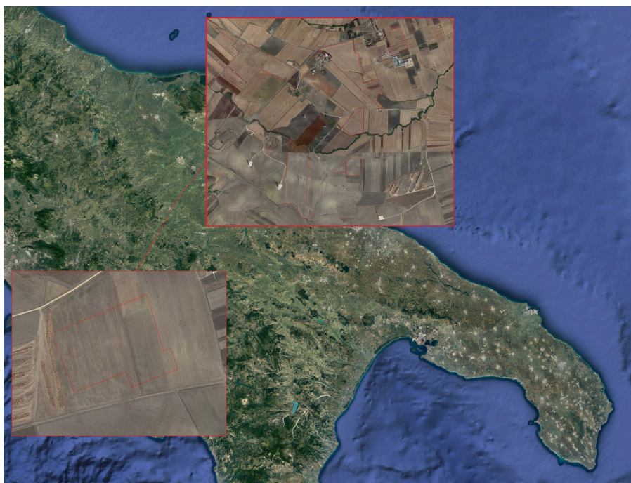
Figura 1 - Ubicazione area impianto e punto di connessione

L’impianto avrà una potenza di 39.779,9 kWp e l’energia prodotta verrà collegata in antenna a 36 kV su una nuova S.E. R.T.N. 380/150/36 kV da inserire in entra-esce all’elettrodotto 380 kV “Bisaccia-Deliceto”.