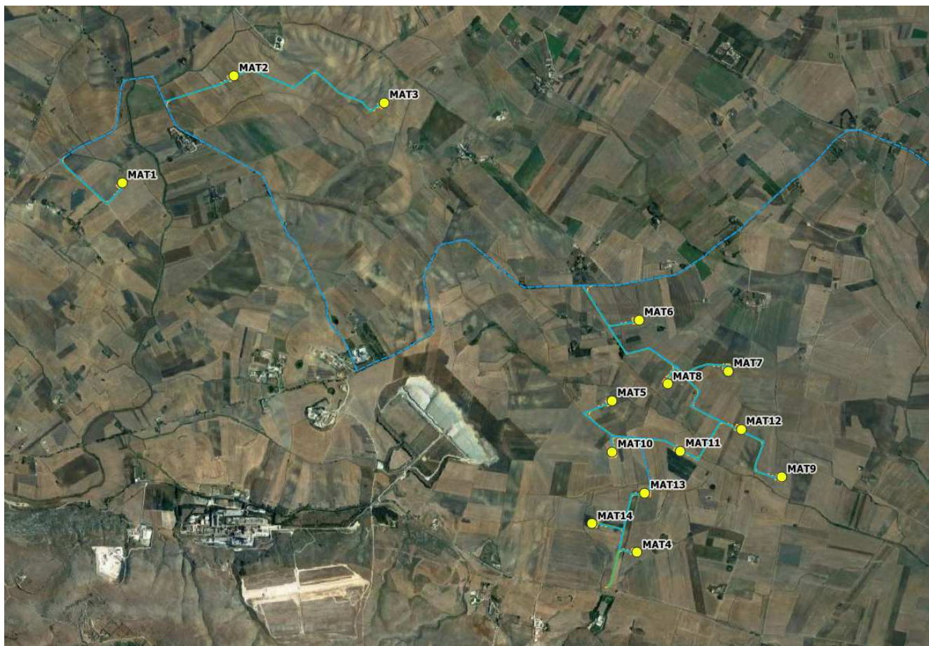
Figura 1: Inquadramento area di intervento su base ortofoto

Nel dettaglio si riporta in Figura 2 su base ortofoto, la posizione degli aerogeneratori in giallo e la posizione dei possibili ricettori sensibili in rosso.