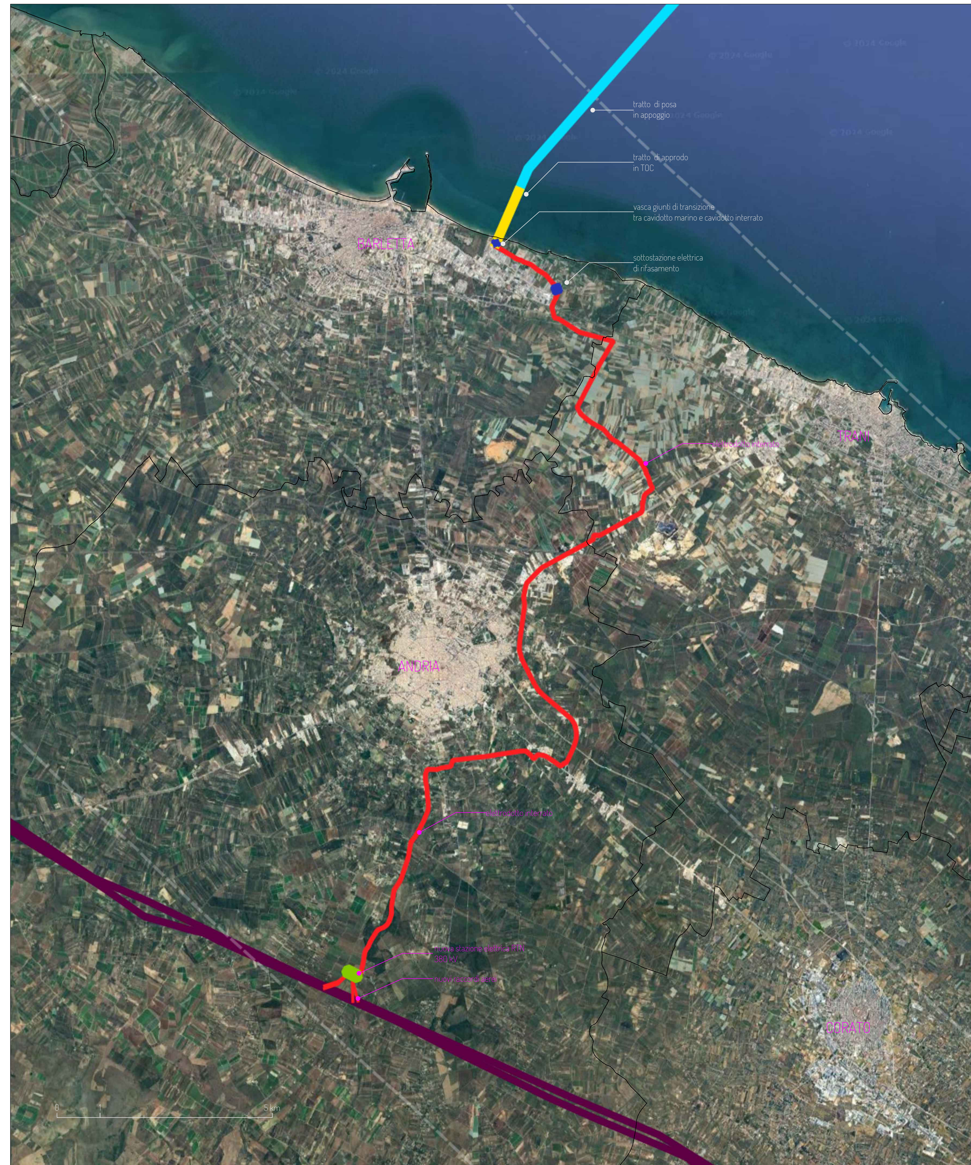
MAPPA DI INQUADRAMENTO SU CARTA ORTOFOTO SCALA 1:50.000