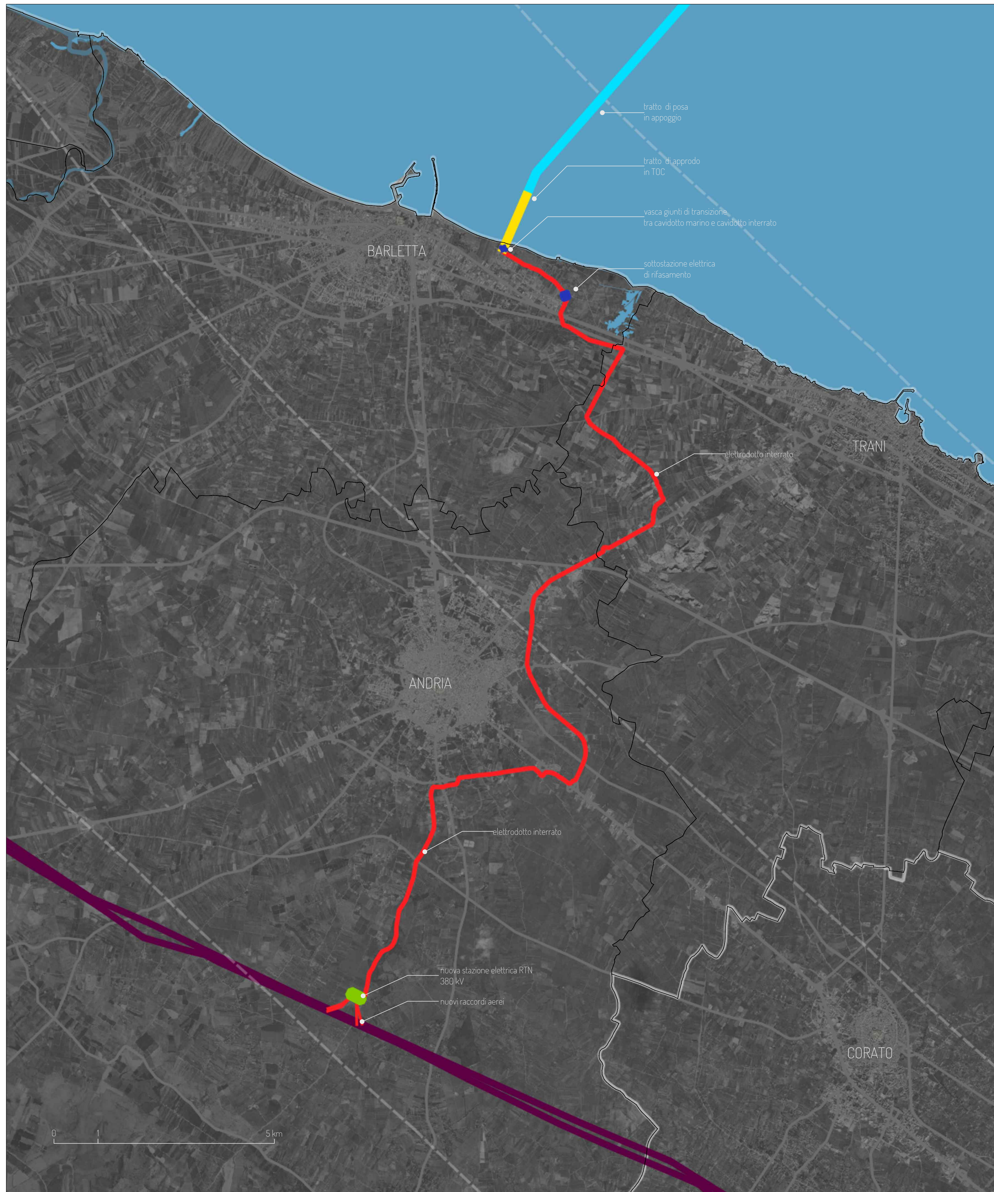
MAPPA DI INQUADRAMENTO SU CARTA TECNICA REGIONALE SCALA 1:25.000