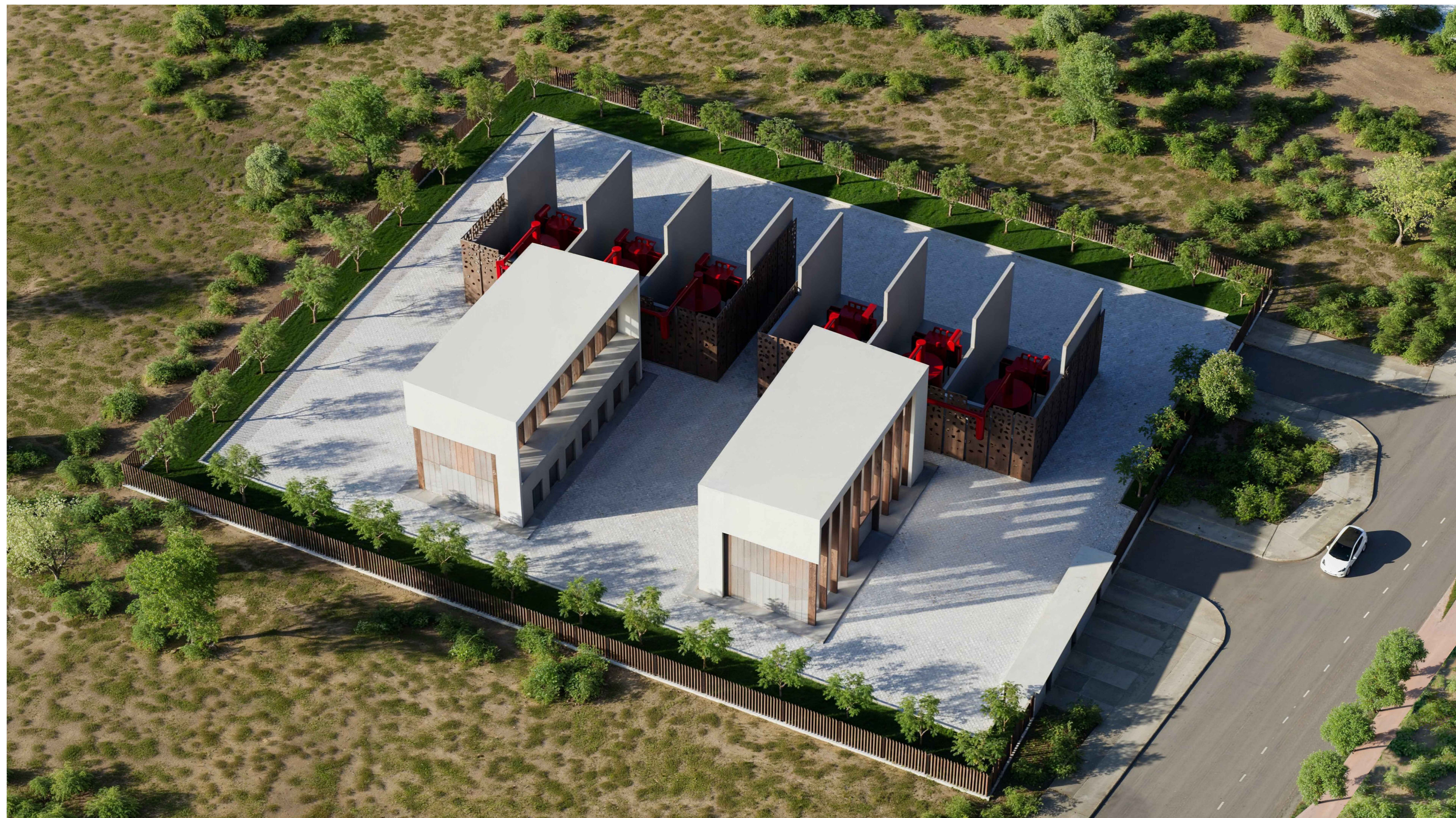
Concept di progetto e selezione dei materiali