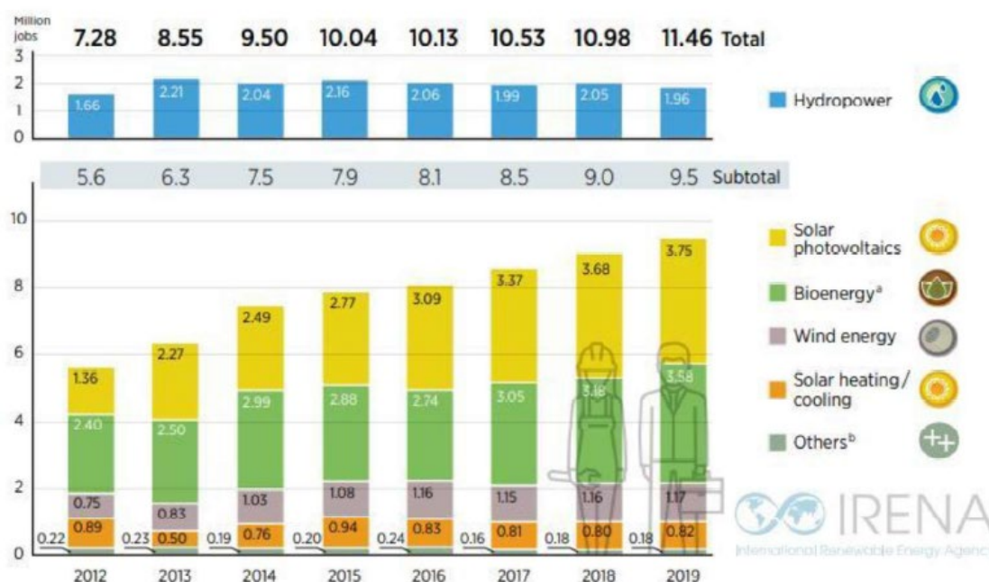
Figura1: Dati occupazionali nel settore rinnovabile negli ultimi anni

L'industria del solare fotovoltaico mantiene il primo posto, con il 33% della forza lavoro totale delle energie rinnovabili. Nel 2019, l'87% dell'occupazione globale nel fotovoltaico si è concentrato nei dieci paesi in testa distribuzione mondiale e nella produzione di attrezzature.