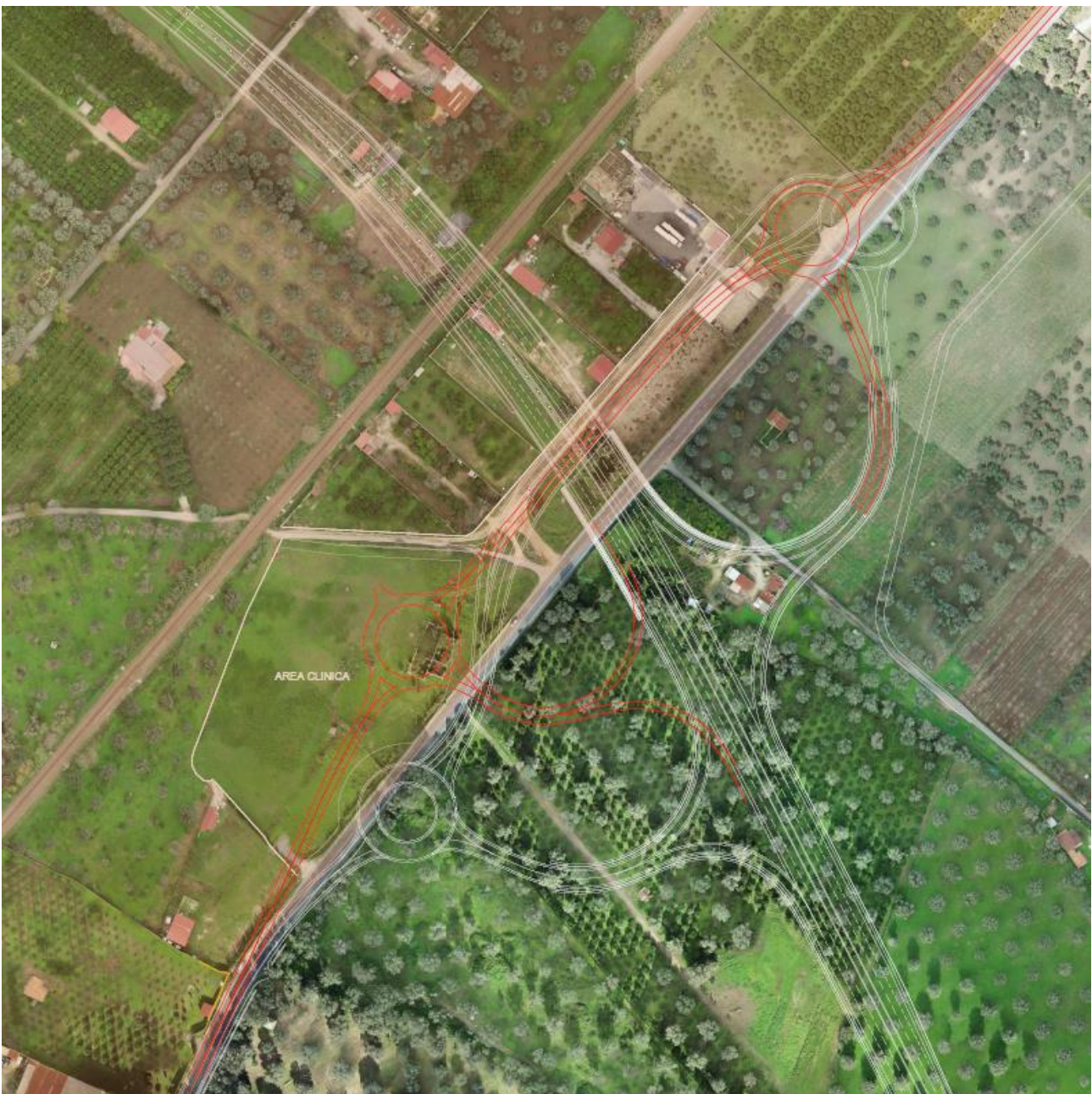
Figura 2: in rosso il progetto sottoposto a VIA, in bianco le modifiche proposte. La parte "ombreggiata" mostra l'area sottoposta a vincolo ex art. 136 lettera d) del D. L.gs 42/2004.

La seconda modifica, invece, scaturisce dalla richiesta del Comune di Gioia Tauro, che ha evidenziato come lo svincolo di progetto previsto sulla S.S. 18 proposto da Anas S.p.a. interferisse con un'area in cui è prevista e già autorizzata la realizzazione di un complesso sanitario. Pertanto, il Proponente ha progettato una minima traslazione della rotatoria sud con connessi piccoli aggiustamenti del tracciato stradale, onde ridurre l'interferenza con l'area del complesso sanitario. La Società sottolinea come la modifica proposta permetta un allontanamento dall'area vincolata ex art. 136 lettera d) del D. L.gs 42/2004 "Area panoramica costiera tirrenica caratterizzata da ricca vegetazione".