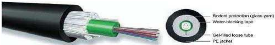
Figure 1: Fibre optic cable (cross section)