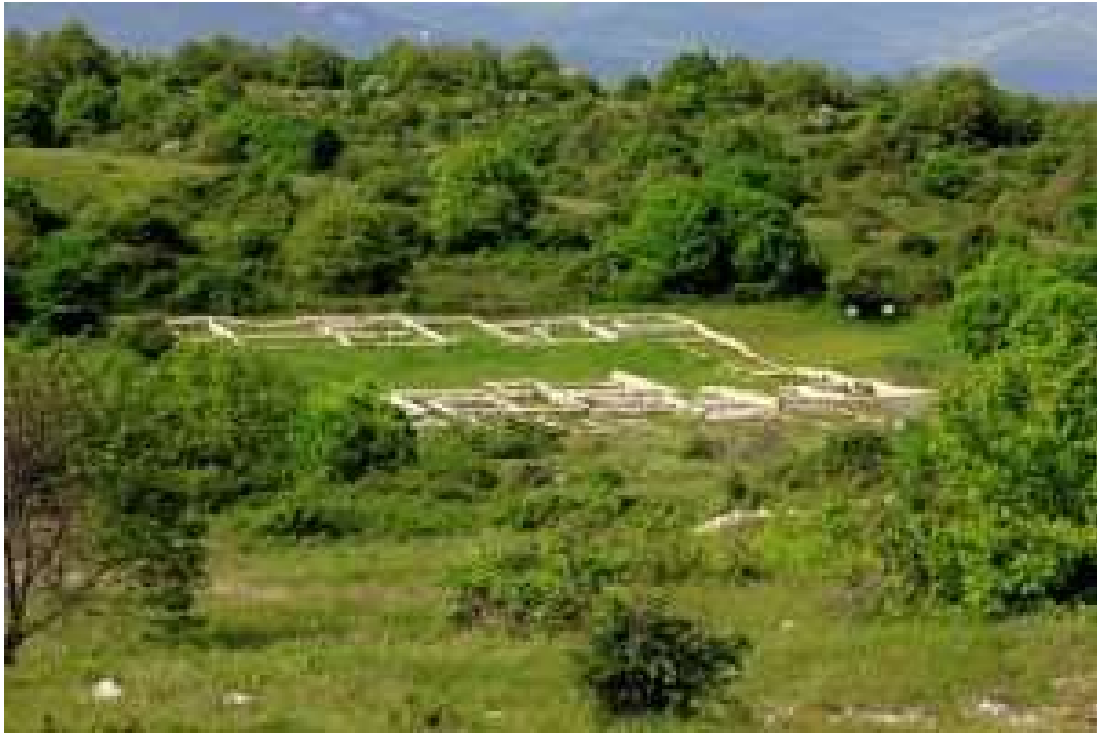
Area archeologica all'interno del Sito di Importanza Comunitario Monte Pallano a poche centinaia di metri dalla concessione Colle Santo.

9. La LNEnergy non offre garanzie sulle modalità in cui le sue operazioni garantiranno pace, quiete e bellezza ai residenti. Ci saranno forti rumori nel circondario dovuti agli impianti di stoccaggio e di desolfurazione che saranno operativi 24 ore su 24, e 365 giorni l'anno togliendo sonno e tranquillità ai residenti. In più il progetto prevede il trasporto di materiali di lavorazione e di prodotti finiti (altamente tossici, infiammabili e pericolosi) su un percorso di almeno 7 chilometri su strade di montagna, piccole, tortuose e di pericolosità elevata, specie nei mesi invernali sotto la pioggia e la neve. Non è possibile dunque escludere del tutto forti problemi alla viabilità, incidenti anche gravi, e blocchi stradali. Non è nemmeno chiaro chi dovrà provvedere alla cura del manto stradale che sicuramente sarà impattato negativamente dall'eccessivo traffico. Ci sono studi scientifici che mettono in correlazione il vivere vicino ad infrastruttura estrattiva e lavorativa con alti rischi di stress, depressione e problemi di salute mentale.