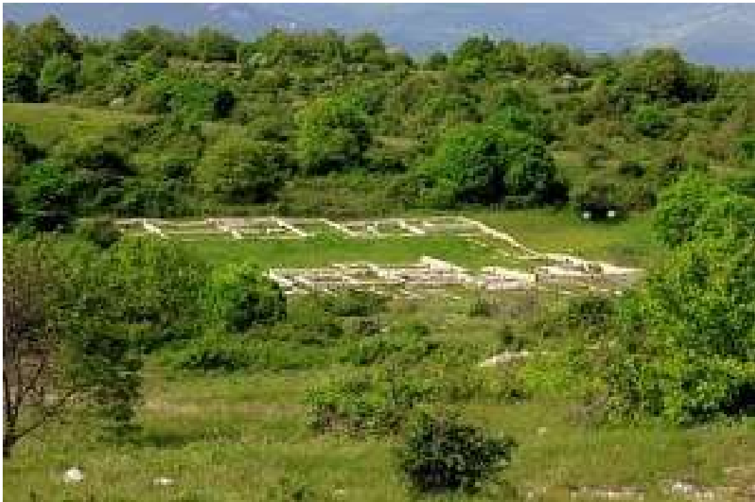
Area archeologica all'interno del Sito di Importanza Comunitario Monte Pallano a poche centinaia di metri dalla concessione Colle Santo.

raffreddati sono facilmente infiammabili in caso di fughe, fluttuazioni termiche o di pressione e non per niente in Italia esiste l'obbligo di un nulla osta di sicurezza quando i quantitativi di gas liquid siano così elevate. Nel 2022 c'è stato uno scoppio seguito da un incendio devastante presso un impianto LNG in Texas a causa di squilibri nelle pressioni di operazione. L'evento ha causato forti tremori nel circondario. È evidente che incidenti simili, anche in scala minore, sarebbero devastanti per Bomba, che come detto, è caratterizzata da un territorio fortemente instabile.