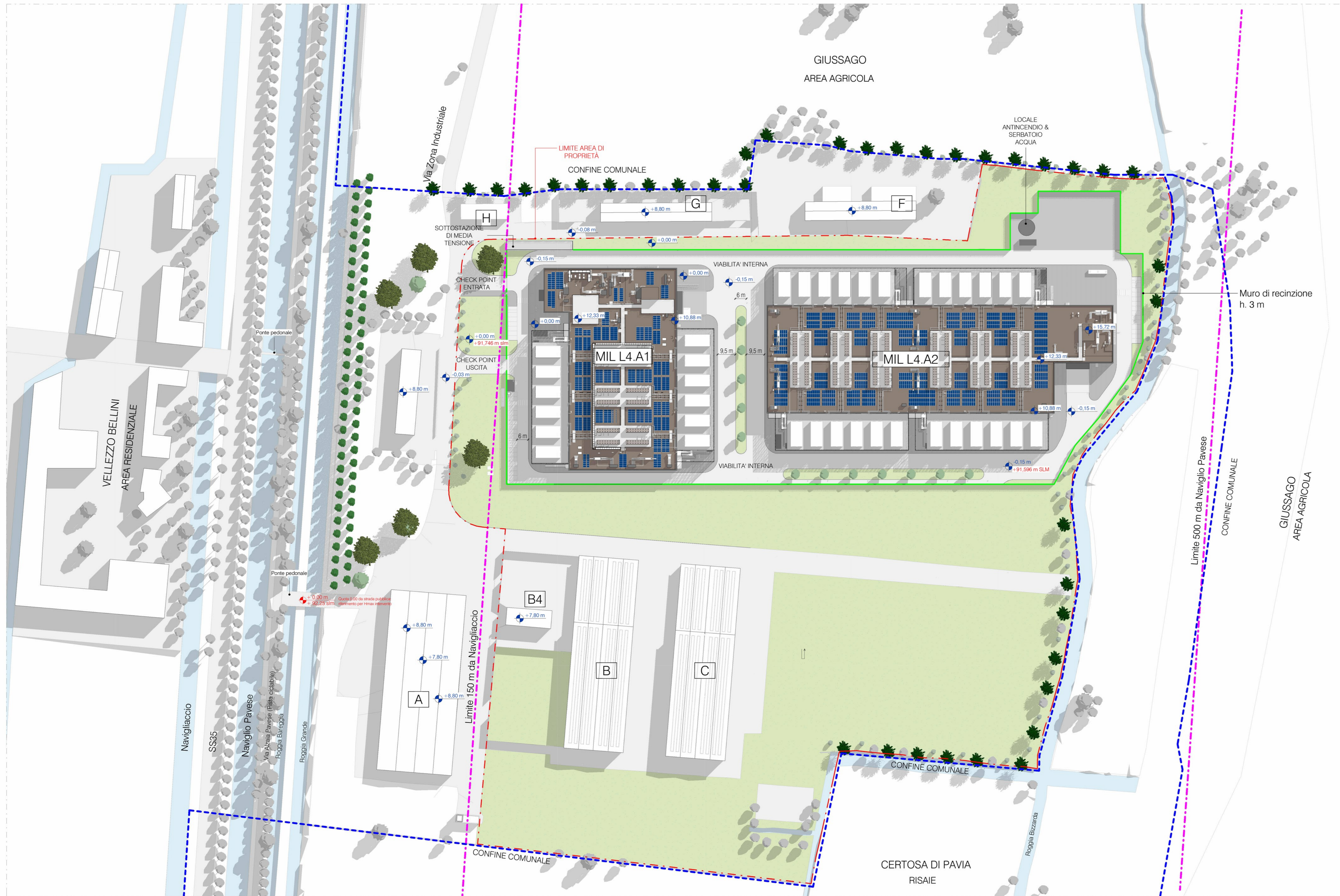
Stato di Fatto - Planimetria 1:1000