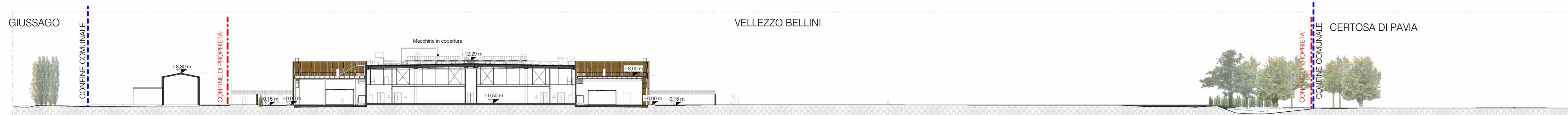
Stato di Fatto - Sezione AA 1:500