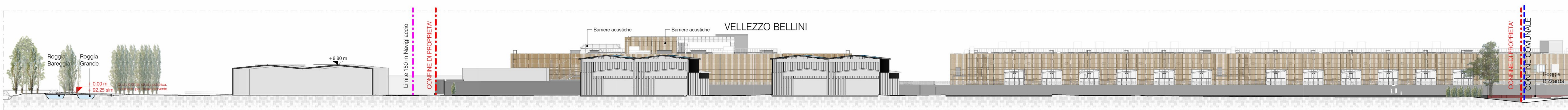
Stato di Fatto - Sezione BB 1:500