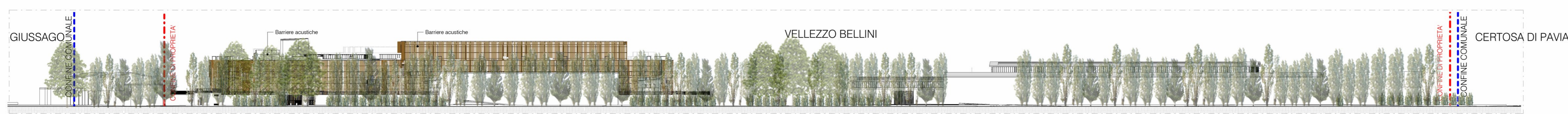
Stato di Fatto - Prospetto Ovest 1:500