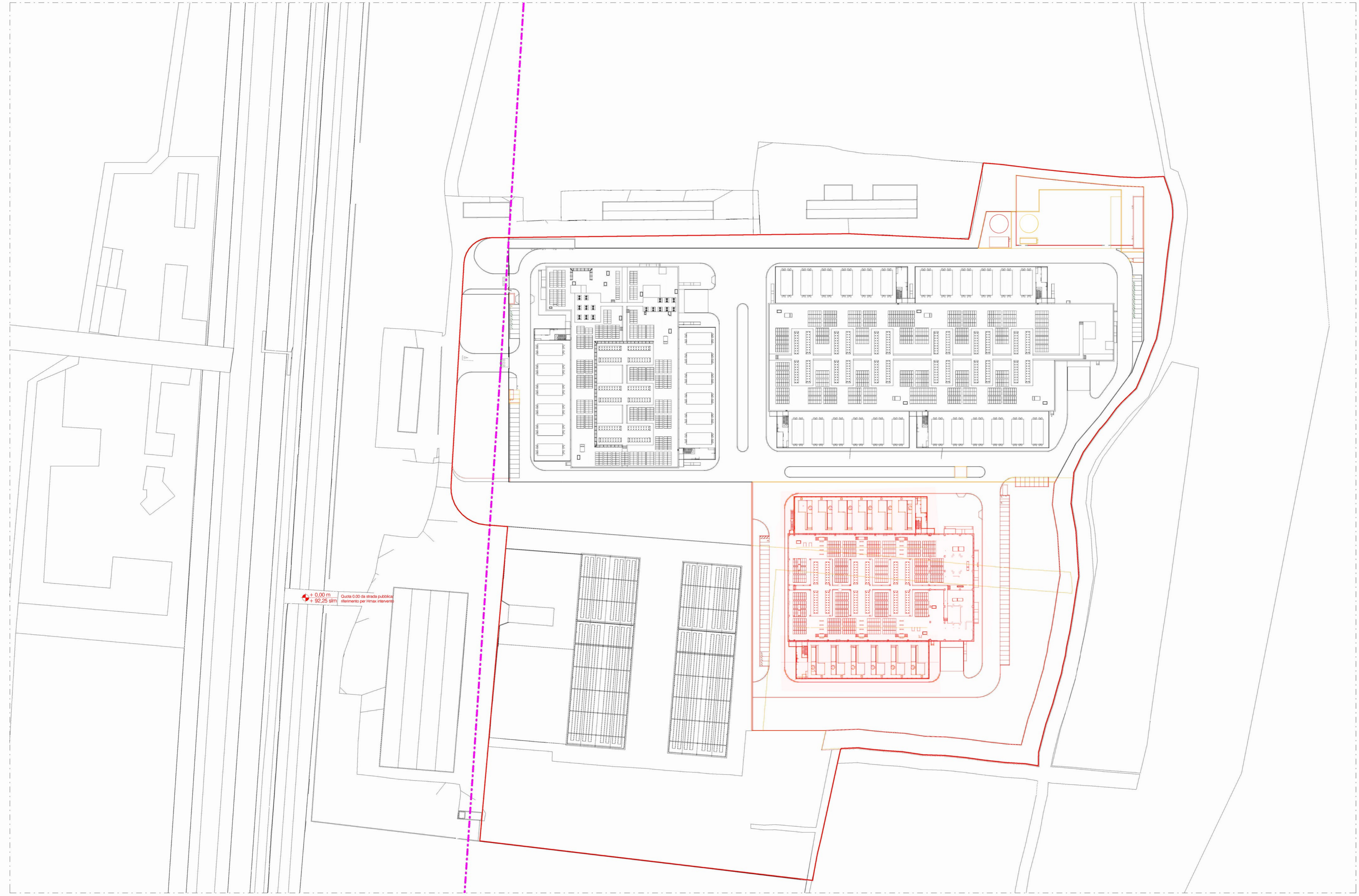
Stato di Confronto - Planimetria 1:1000