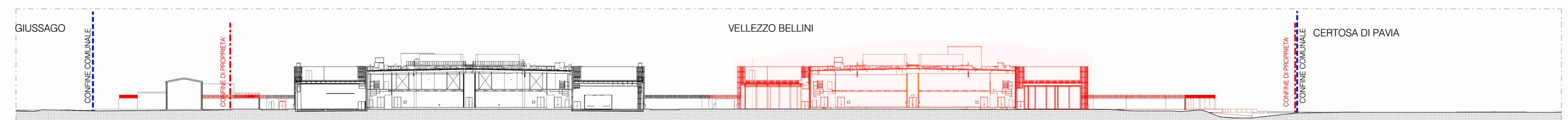
Stato di Confronto - Sezione AA 1:500