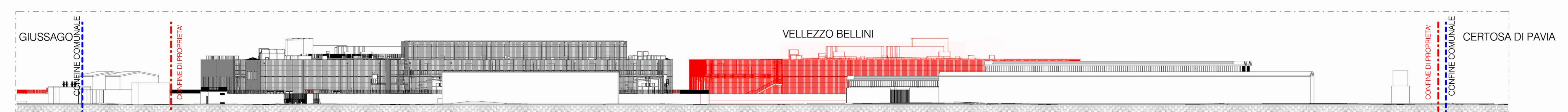
Stato di Confronto - Prospetto Ovest 1:500