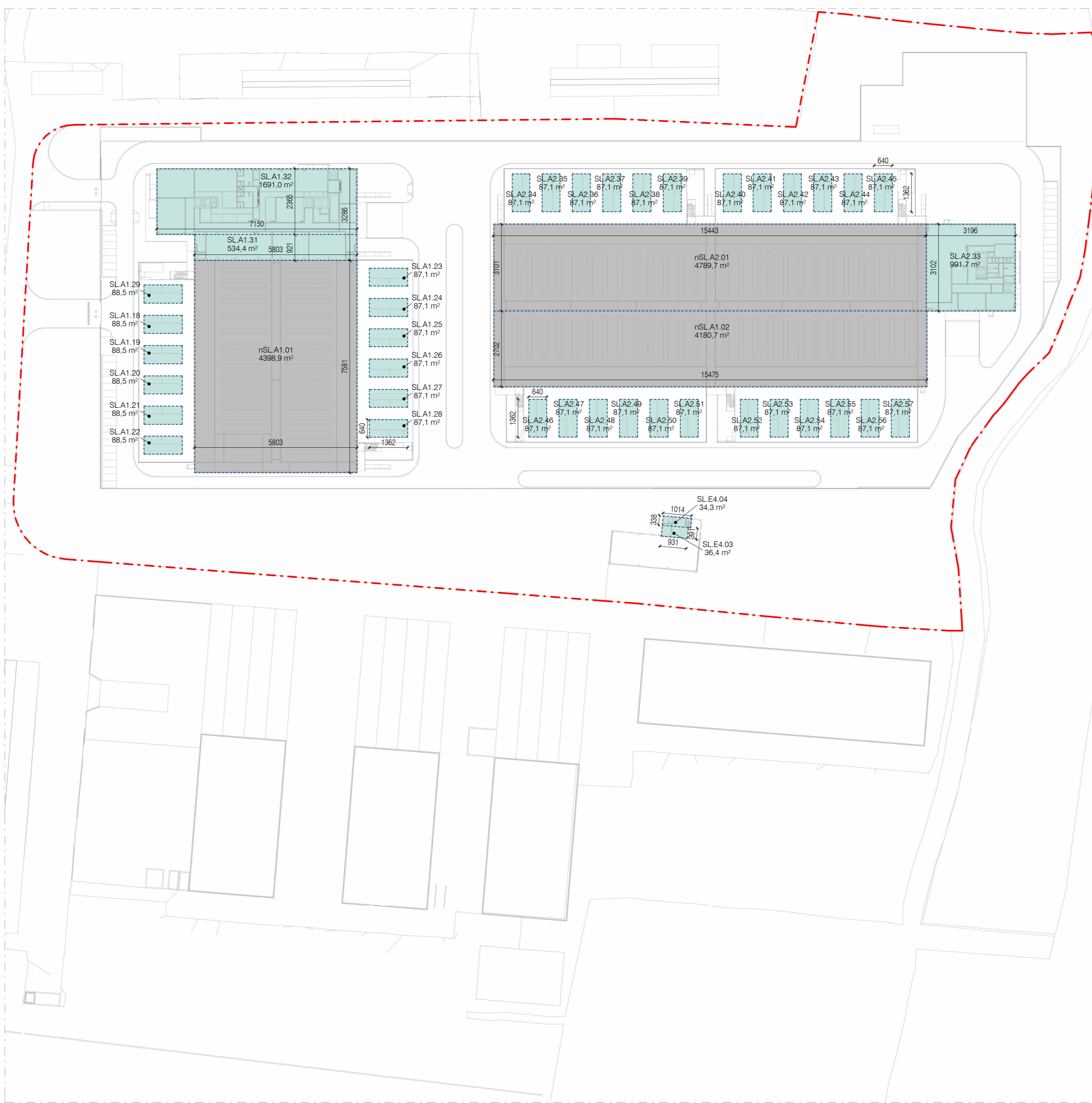
Stato di Progetto - Mappatura della SLP - Piano Primo 1:1000