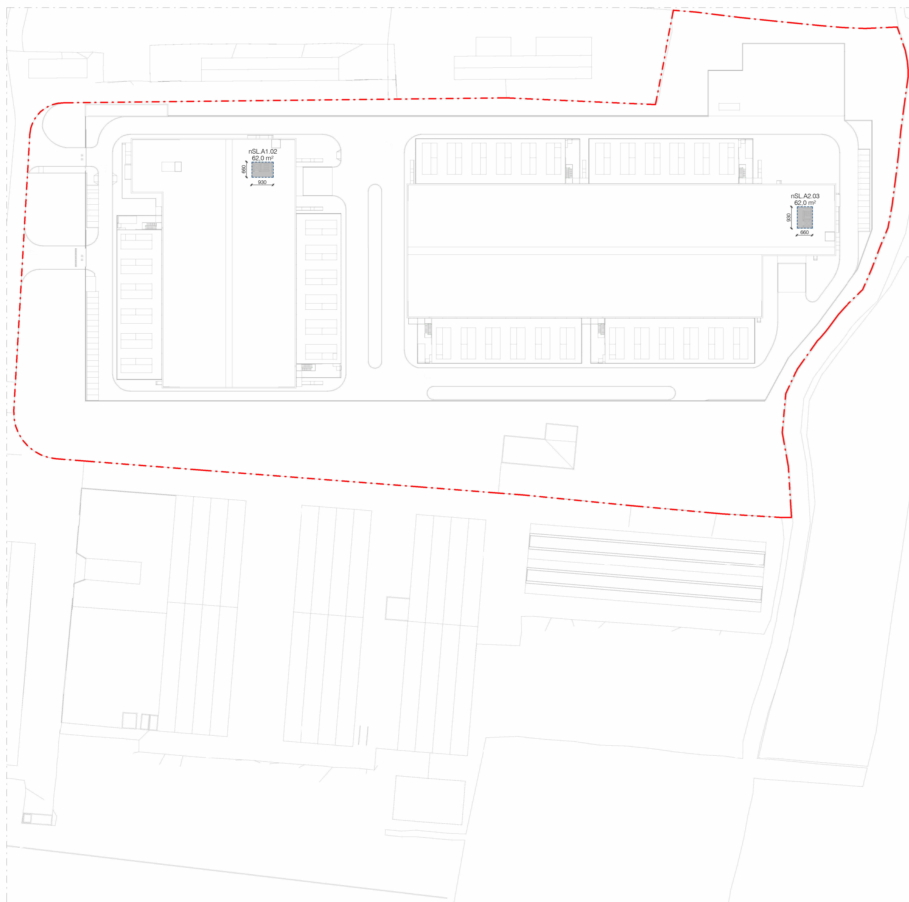
Stato di Progetto - Mappatura della SLP - Piano Copertura 1:1000