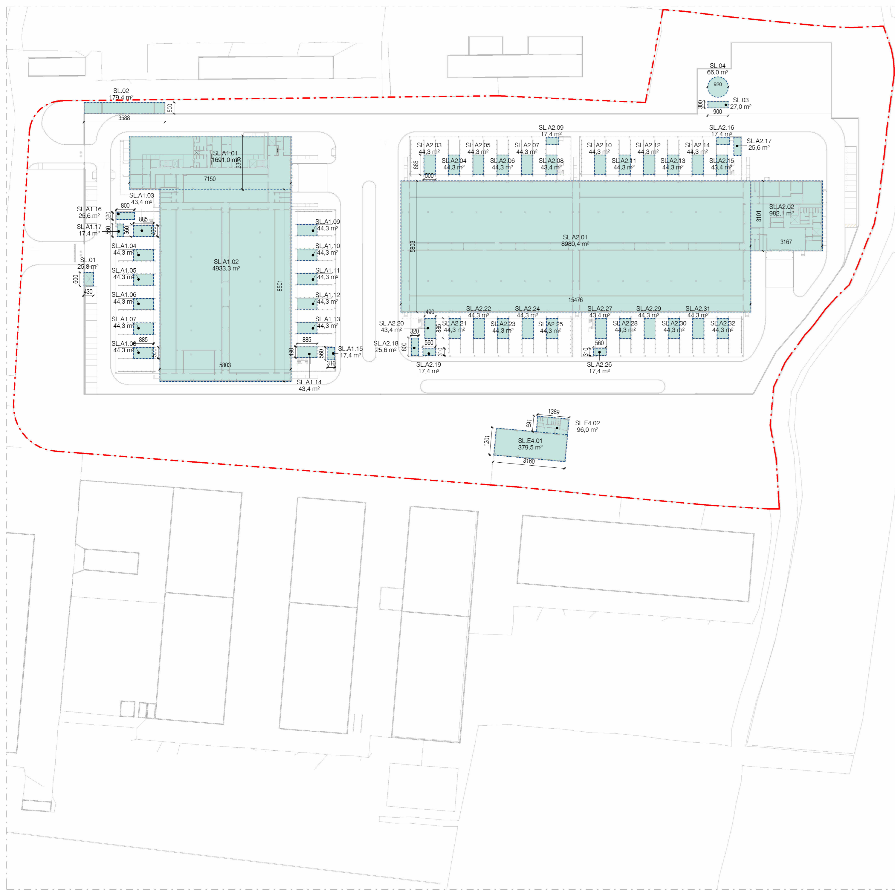
Stato di Progetto - Mappatura della SLP - Piano Terra 1:1000