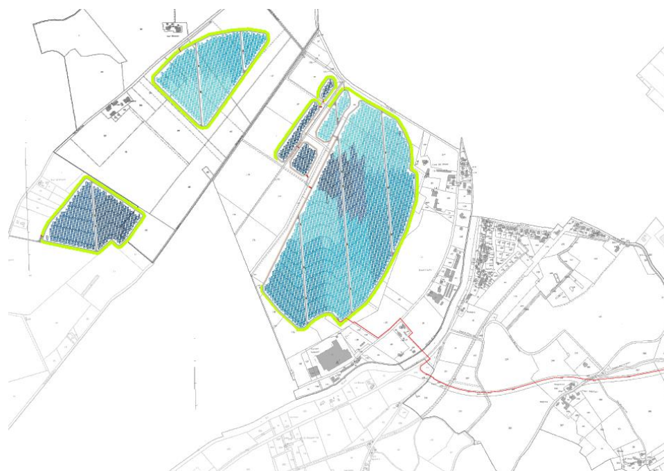
Figura 2 Inquadramento su carta catastale.