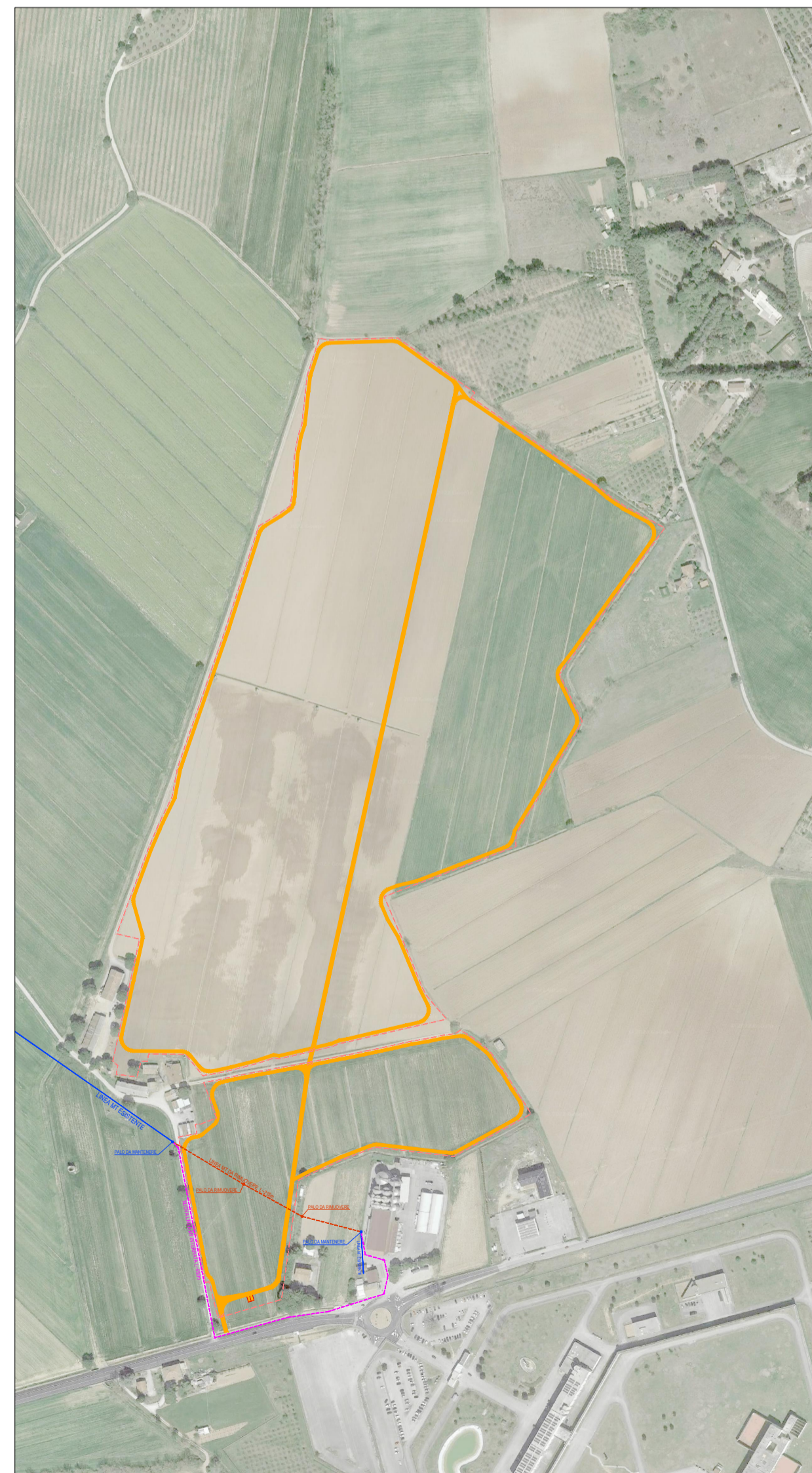
PLANIMETRIA GENERALE SCALA 1:5'000