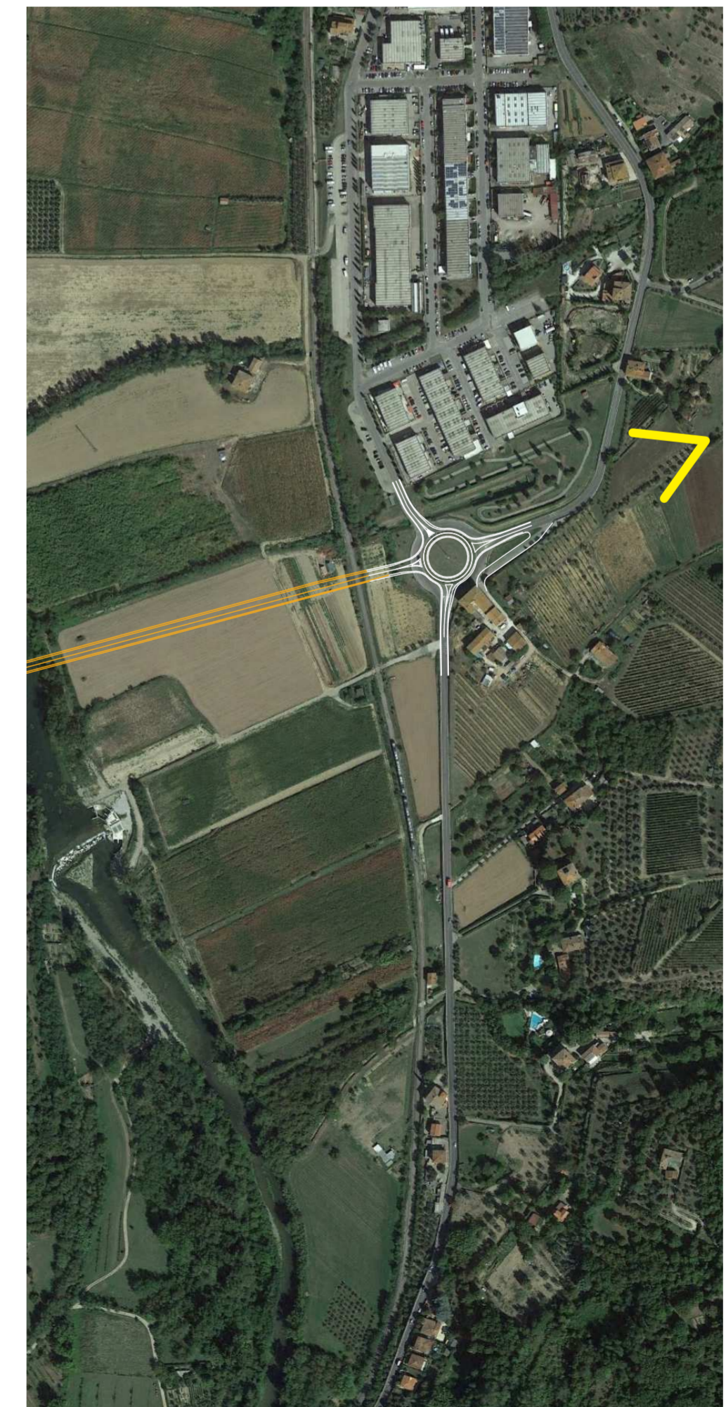
Vista 8 _ Punto di vista