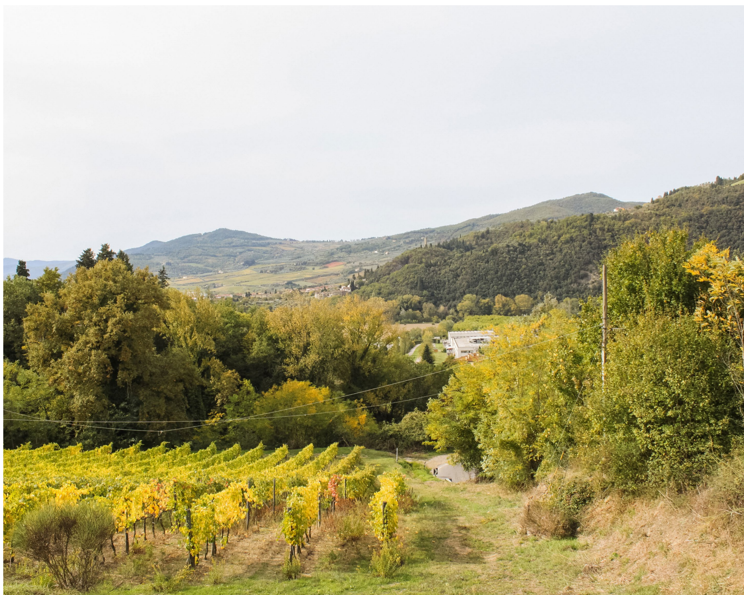
Vista 8 _ Stato di fatto