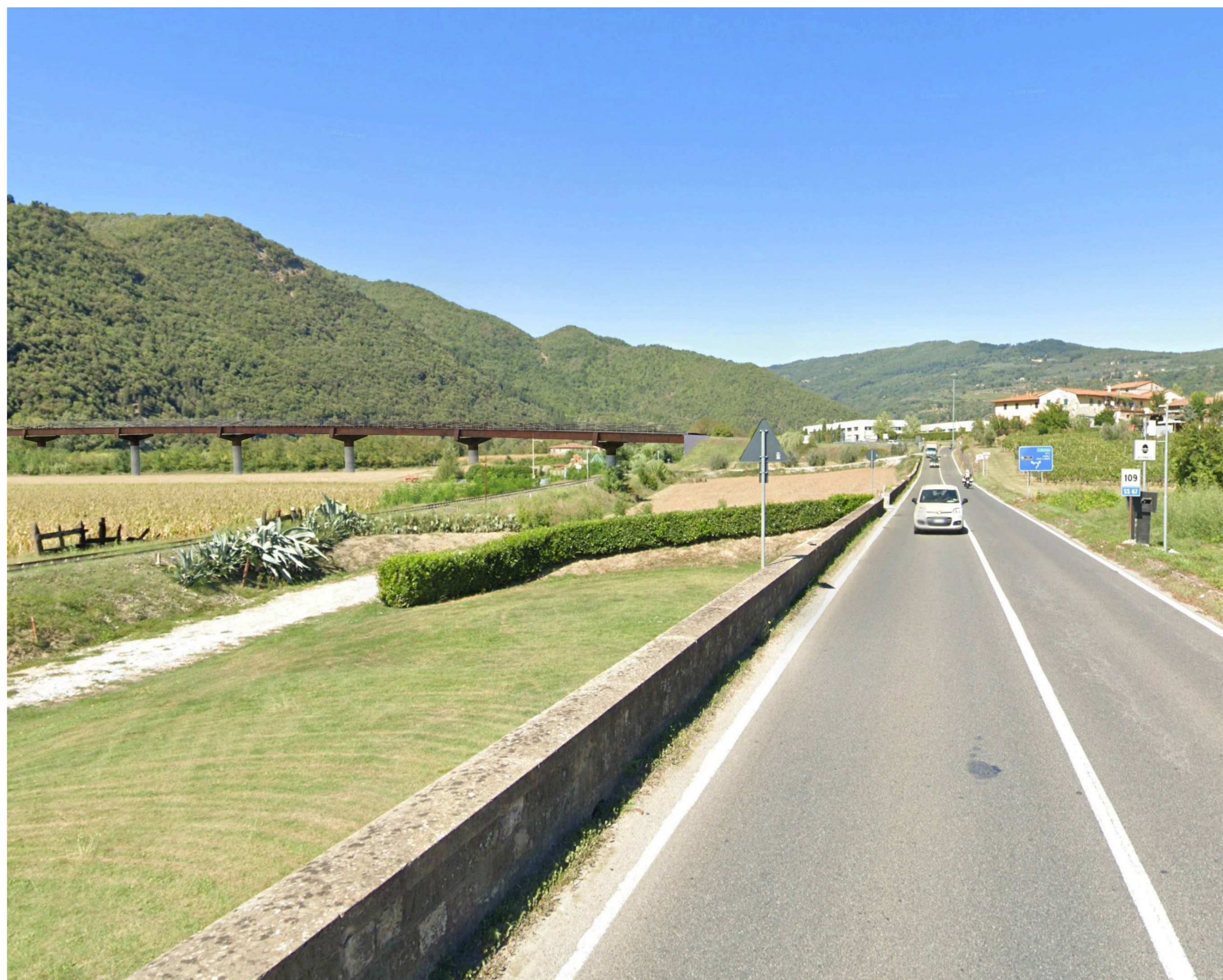
Vista 7 _ Progetto esecutivo