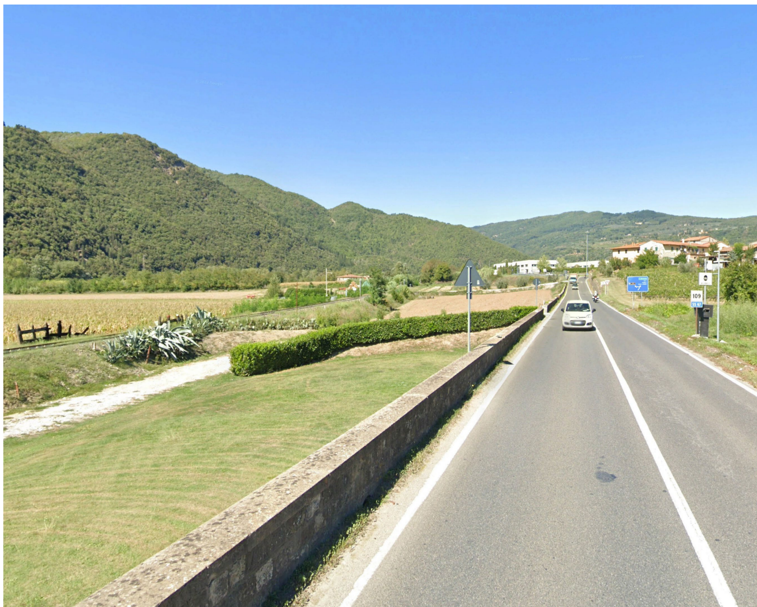
Vista 7 _ Stato di fatto