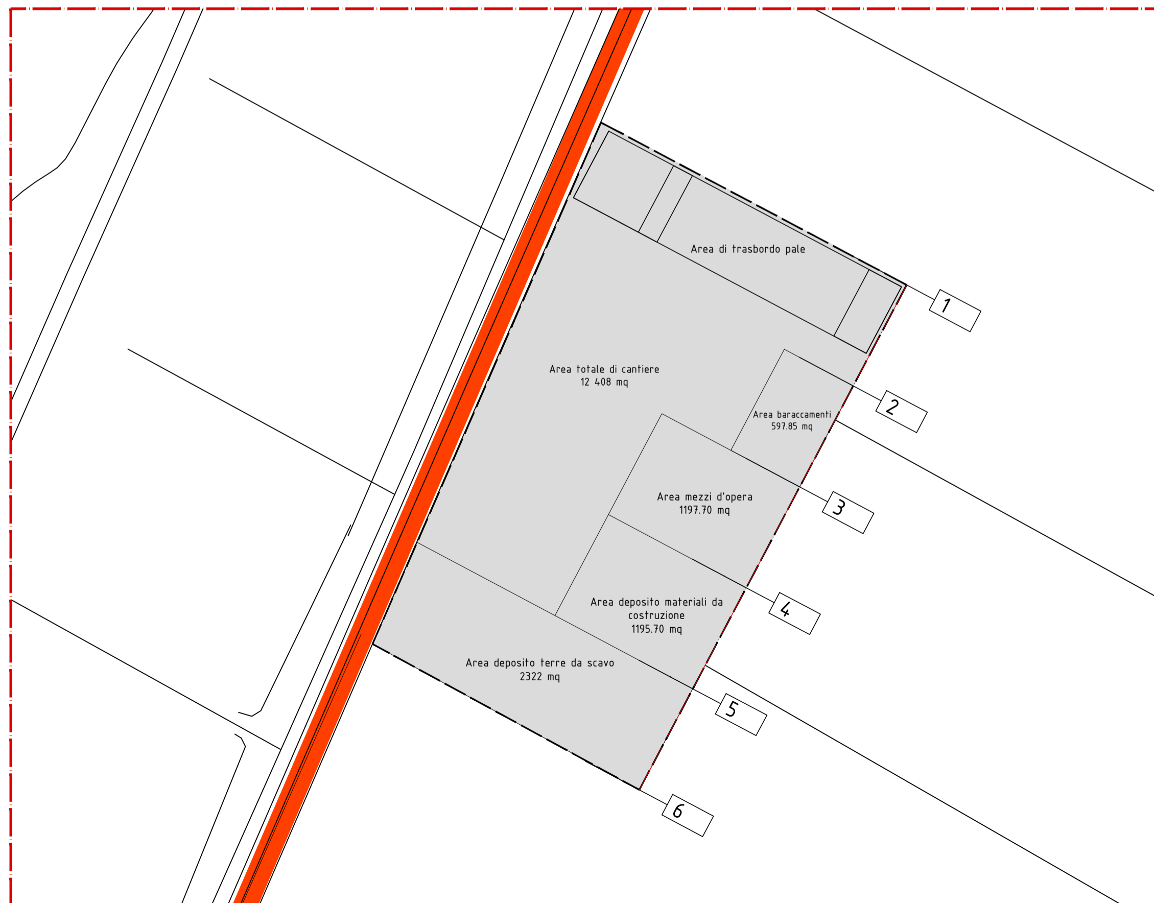
Planimetria Area di cantiere Est Scala 1:1.000