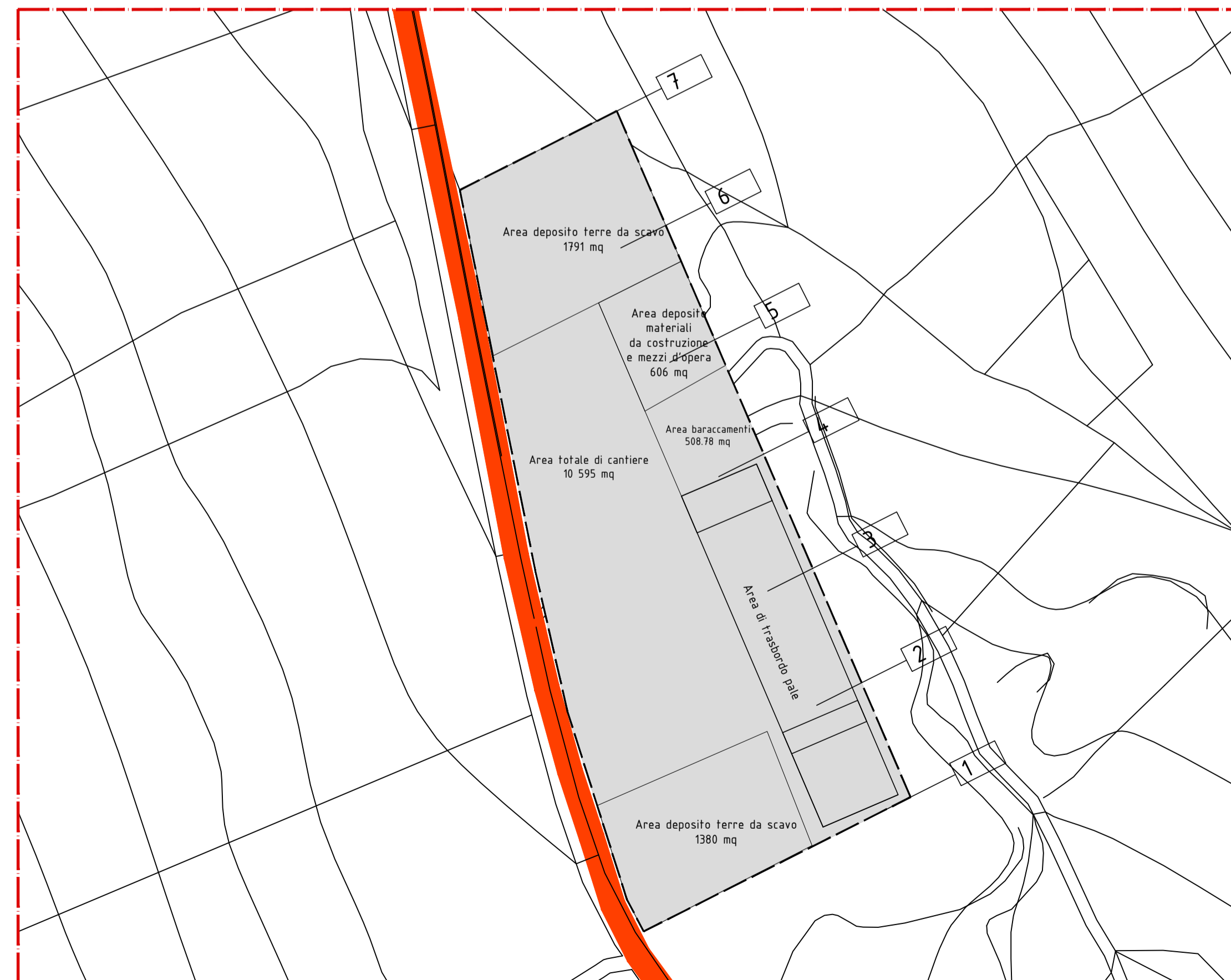
Planimetria Area di cantiere Ovest Scala 1:1.000